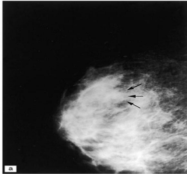
عکس ۱: ماموگرافی: افزایش تراکم دانسیته فیبرو گلاندولار و افزایش ضخامت پوست

ناحیه رترو آرئولار و ادم بافت گلاندولار دیده شد و علائمی به نفع توده مجزا یا میکروکلسیفیکاسیون مشکوک و یا علائم بدخیمی مشاهده نشد (عکس ۱).