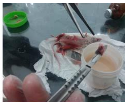
شکل ۱: مرحله ایجاد و جداسازی تومور