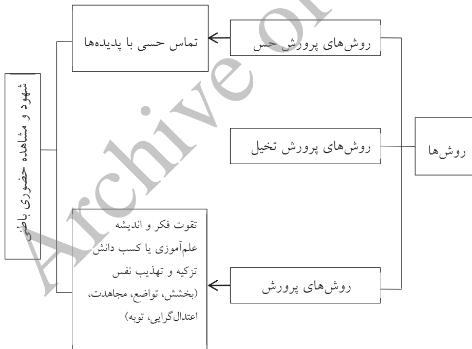
روش‌های تعلیم و تربیت

«انسان کامل کسی است که آتش رذایل و نفسانیت را با آب «توبه» و «علم» خاموش گرداند. پیش از اینکه به جهان مجازات قدم بگذارد» (ملاصدرا، ۱۳۷۱، ص ۱۹۳).