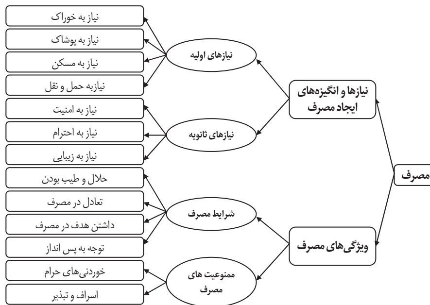
نمودار ۴: مؤلفه‌های تربیت اقتصادی در ذیل مفهوم مصرف بر اساس آموزه‌های اسلامی (نگارندگان)

مؤلفه‌های تربیت اقتصادی در حوزه مصرف، مؤلفه‌هایی هستند که انسان را به مصرف بهینه سوق داده، او را از افراط و تفریط بازمی‌دارد. برای دستیابی به تربیت اقتصادی مطلوب در این حوزه می‌توان برنامه‌های درسی را بر اساس این محتوا متناسب با سطح درک و انتزاع دانش‌آموزان تدوین کرد. مؤلفه‌های شناسایی شده در حوزه مصرف بر اساس یافته‌های پژوهش، به اجمال در نمودار شماره ۴ ارائه شده است.