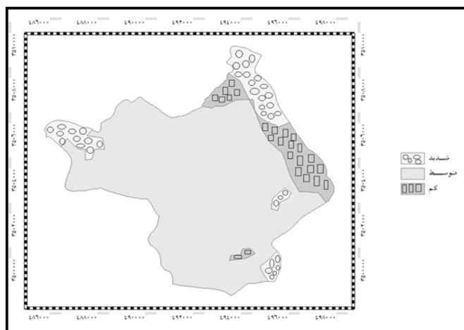
شکل ۳- نقشه شدت فرسایش در منطقه مورد بررسی