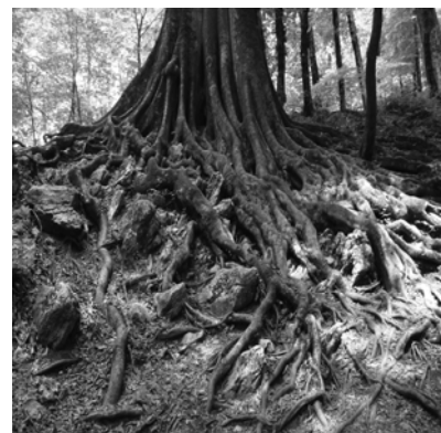
بیرون زدگی ریشه