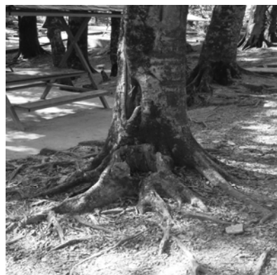
بیرون زدگی سنگ