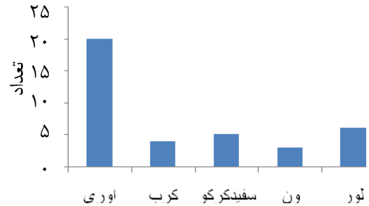
شکل ۲- مقایسه حضور و تعداد گونه‌های شاخص گل‌سنگ در تیپ اوری- لور به تفکیک گونه‌های درخت

وابستگی قوی‌تری در سمت مثبت محور اول با گونه کرب و نشان می‌دهند. همچنین گونه‌های Graphis scripta و Acrocordia gemmata در همین حالت ذکر شده به گونه ون وابستگی دارند. در ادامه گونه‌هایی مانند Usnea lapponica ، Pseudevernia furfuracea ، Anaptychia setifera ، Lecanora meridionalis و Tornabea scutellifera وابستگی زیادی با سمت مثبت محور دوم و منفی محور اول یا گونه اوری دارند. تفسیر آنها توسط گرادیان‌های محیطی محورهای اول و دوم به عمل می‌آید. در مجموع سه محور اول DCA با مقادیر ویژه ۰/۵۳، ۰/۴۲ و ۰/۲۰ به ترتیب ۲۱/۰۶، ۱۰/۵۳ و ۸/۰۸ درصد از کل تغییرات را در داده‌های پوشش حاصل از ترکیب فلورستیک عناصر گل‌سنگی شاخص در درختان تیپ اوری-لور توجه کردند (جدول ۵).