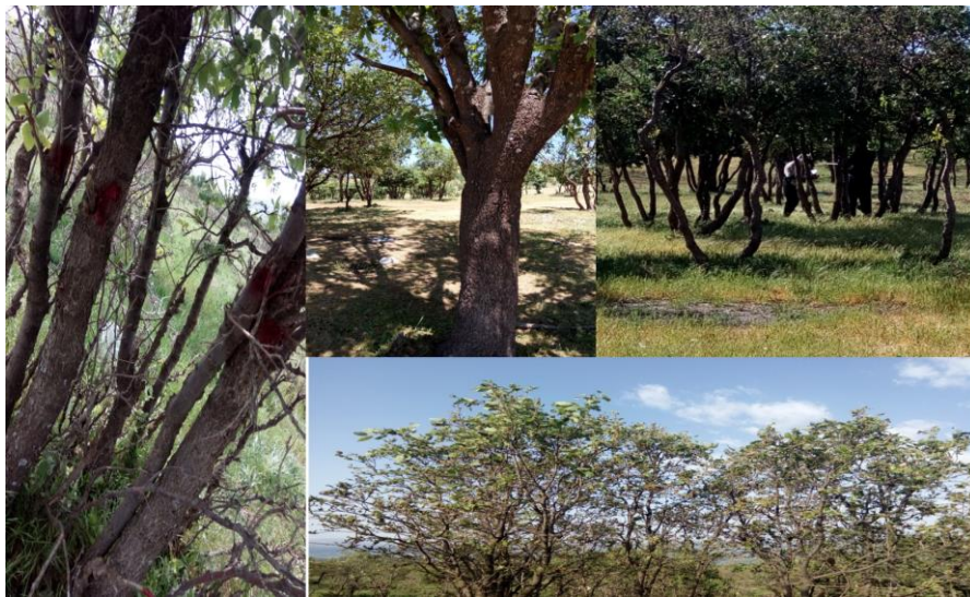
شکل ۱- منطقه مورد مطالعه و درختان نمونه برداری شده

این زنبورها از لحاظ تعداد گونه در ایران به‌ویژه آذربایجان غربی از غنای بالایی برخوردارند به طوری که تعداد ۳۶ گونه زنبور گالزای بلوط را روی گونه Quercus infectoria در ایران گزارش کرده است (Zargarani et al., 2012). بر اساس آخرین نتایج تاکنون ۷۸ گونه زنبور گالزا برای فون ایران معرفی شده است (Sadeghi et al., 2014). حدود ۸۰٪ زنبورهای گالزا گال‌های متنوعی را از لحاظ ساختمان و شکل به وجود می‌آورند (Zargarani et al., 2012). از طرفی مشخص شده است که کیفیت درخت بلوط به‌عنوان میزبان تأثیرات زیادی در فراوانی و تنوع زنبورهای گالزا دارد