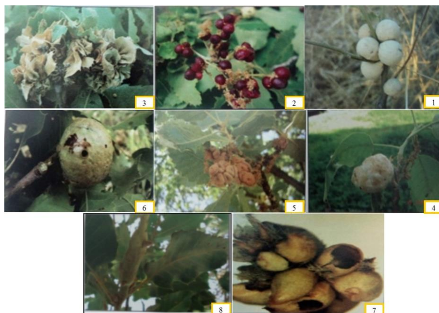
شکل ۳- شماره ۱: گونه Aphelonyx persica شماره ۲: گونه Andricus grossulariae شماره ۳: گونه Andricus multiplicatus شماره ۴: گونه Dryocosmus israeli شماره ۵: گونه Andricus cecconii شماره ۶: گونه Aphelonyx cerricola شماره ۷: گونه Andricus atkinsonae شماره ۸: گونه Pseudoneuroterus macropterus