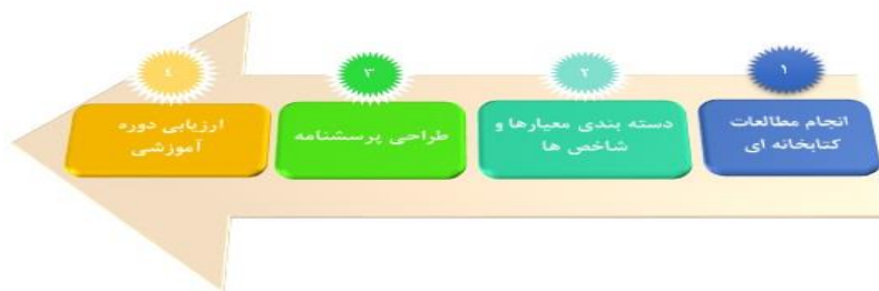
نمودار ۱. گام‌های اصلی پژوهش

رویه ارزیابی کیفیت دوره آموزشی در این پژوهش از ۴ گام اصلی تشکیل شده است که به‌طور خلاصه در نمودار ۱ نشان داده شده است.