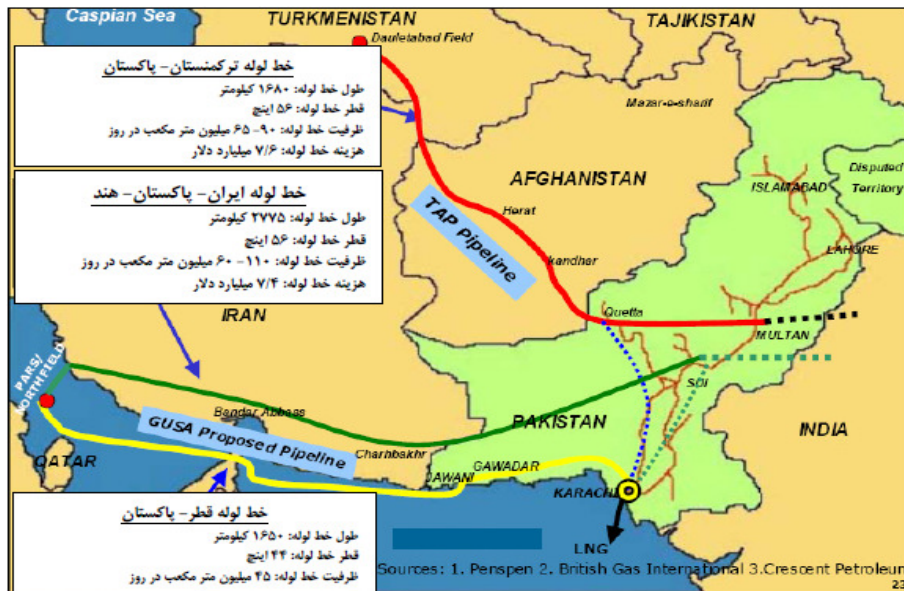
شکل ۱. مسیرهای احتمالی واردات گاز کشورهای هند و پاکستان