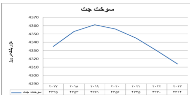
نمودار ۳. روند آتی تقاضای سوخت جت بر اساس پیش‌بینی IEA

بر اساس پیش‌بینی IEA تقاضای سوخت جت از ۴۳۳۵ هزار بشکه در روز در سال ۲۰۱۷ به ۴۳۱۴ هزار بشکه در روز در سال ۲۰۲۳ خواهد رسید.