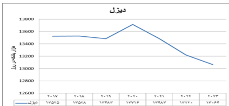
نمودار ۲. پیش‌بینی تقاضای دیزل تا سال ۲۰۲۳ بر اساس سناریوی سیاست جدید IEA

بر اساس پیش‌بینی IEA انتظار می‌رود مصرف سوخت دیزل از ۱۳۵۲۵ هزار بشکه در روز در سال ۲۰۱۷ به ۱۳۰۶۴ هزار بشکه در روز در سال ۲۰۲۳ برسد این روند حاکی از کاهش رشد ۰,۱ درصدی تقاضای این فرآورده می‌باشد.