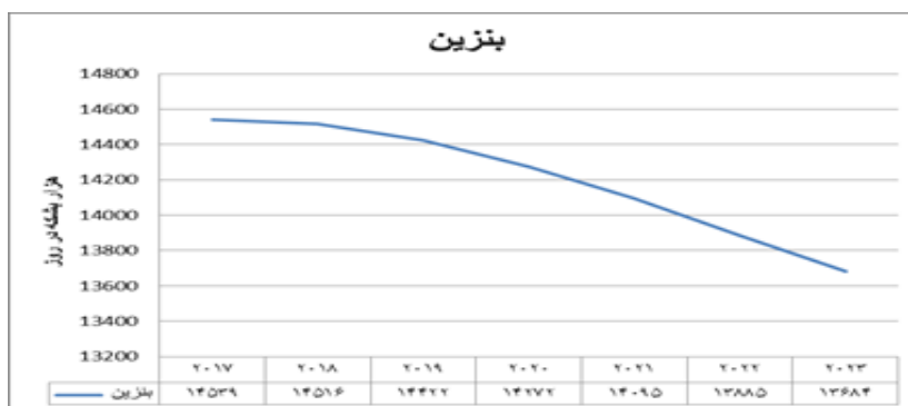
نمودار ۱. پیش‌بینی تقاضای بنزین تا سال ۲۰۲۳ بر اساس سناریوی سیاست جدید IEA منبع: IEA, 2017

بر اساس پیش‌بینی IEA انتظار می‌رود روند مصرف بنزین بین سال‌های ۲۰۱۷ تا ۲۰۲۳ افزایشی بوده و سالانه نرخ رشد ۰,۷ درصد داشته باشد. همان‌طور که در نمودار ۱ مشاهده می‌گردد روند آتی تقاضای بنزین تا سال ۲۰۲۳ کاهشی بوده و انتظار می‌رود میزان مصرف این فرآورده از ۱۴۵۳۸ هزار بشکه در روز در سال ۲۰۱۷ به ۱۳۶۸۴ هزار بشکه برسد.