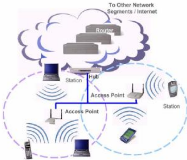
شکل 2. پیکربندی شبکه های مبتنی بر AP

ناحیه‌ای که توسط یک AP، تحت پوشش قرار می‌گیرد، سلول ۱ نامیده می‌شود. هر ایستگاه کاری در داخل یک سلول می‌تواند به AP دسترسی پیدا کند. وسعت ناحیه تحت پوشش یک AP متغیر است و به طراحی و ساخت AP، محیطی که در آن کار می‌کند و قدرت ارسال کنندگی آن، بستگی دارد (Drew 2006) (شکل 2).