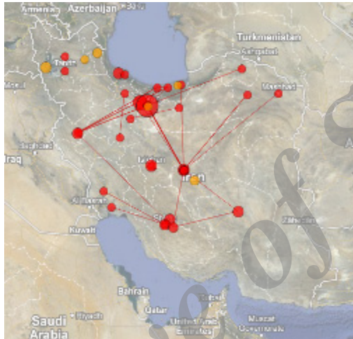
تصویر ۷. توزیع جغرافیایی انتشارات علمی در حوزه موضوعی انرژی آبی در ایران

حوزه موضوعی انرژی آبی بیشتر به صورت کلی بوده و تولیدات اندکی به حل مشکلات بومی جغرافیای خاص در تحقیقات خود اشاره داشته‌اند. این مطلب نشان‌دهنده عدم توجه به قابلیت‌های جغرافیایی در توزیع انتشارات علمی در حوزه موضوعی انرژی آبی در کشور است.