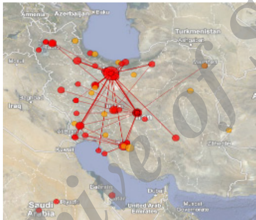
تصویر ۹. توزیع جغرافیایی انتشارات علمی در حوزه موضوعی چاه نفت در ایران

قابلیت‌های نفتی موجود در کشور، همگون ارزیابی می‌شود. همان‌گونه که در نقشه ۹ نیز قابل مشاهده است، بیشترین تراکم تولیدات علمی در استان‌های خوزستان و تهران بوده است. بیشترین تراکم در استان خوزستان ناشی از بیشترین حضور شرکت‌های نفتی در این استان بوده است. در عین حال، دانشگاه‌های صنعت نفت نیز تنها در دو استان تهران و خوزستان و شهر محمودآباد در شمال کشور پراکنده شده‌اند. پس، با وجود تجمع این امکانات و قابلیت‌ها در استان‌های تهران و خوزستان، تولید بیشتر انتشارات علمی در این استان‌ها نیز دور از ذهن نخواهد بود.