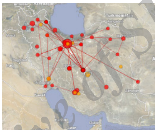
تصویر ۸. توزیع جغرافیایی انتشارات علمی در حوزه موضوعی انرژی بادی در ایران

مورد بررسی تنها ۲۵ مقاله، یعنی حدود ۱۵/۴۳ درصد در عناوین خود به مناطق جغرافیای خاص توجه داشته‌اند. اما با توجه به این مطلب که در عناوین بسیاری از تحقیقات، جغرافیای هدف مورد استفاده قرار نمی‌گیرد، نمی‌توان به صحت آمار به‌دست آمده اکتفا کرد و به همین دلیل، با توجه به نقشه، رابطه مستقیمی میان قابلیت‌های جغرافیای مناطق بادخیز و توزیع انتشارات علمی در نظر گرفته می‌شود. در این حوزه نیز تمرکز تولیدات علمی در استان تهران بوده است.