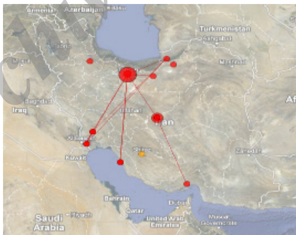
تصویر ۲. توزیع جغرافیایی انتشارات علمی در حوزه موضوعی آلودگی دریایی در ایران

کشور ایران و به دلیل مجاورت با دریا فعال‌تر باشد. تصویر ۲ توزیع جغرافیای مؤلفان مقالات و در نتیجه، انتشارات علمی این حوزه را به صورت متمرکز در استان تهران نشان می‌دهد. احتمالاً علت این تمرکز، وجود مؤسسه ملی اقیانوس‌شناسی در این استان است که البته قرار گرفتن این مؤسسه در استان تهران خود جای بحث دارد. همچنین، تحلیل محتوای تولیدات علمی نشان می‌دهد که در بیشتر تولیدات علمی به منطقه جغرافیایی مورد مطالعه تحقیق اشاره شده است. به عبارت دیگر، از ۲۵ مقاله علمی مورد بررسی در این تحقیق، ۱۸ مقاله یعنی ۷۲ درصد به جغرافیای مورد بررسی تحقیق خود اشاره داشته‌اند. از این تعداد، ۱۲ مقاله یعنی حدود ۶۶/۶۶ درصد به مبحث آلودگی در سواحل جنوبی و ۴ مقاله یعنی حدود ۲۲/۲۲ درصد به سواحل شمالی و ۲ مقاله یعنی حدود ۱۱/۱۱ درصد به هر دو منطقه ساحلی موجود در کشور پرداخته‌اند. این در حالی است که تنها ۷ مقاله یعنی ۲۸ درصد از آنها به جغرافیای مورد بررسی تحقیق خود اشاره‌ای نداشته‌اند. پس، می‌توان نتیجه گرفت که تمرکز تولیدات علمی در مناطق جنوبی بیش از مناطق شمالی کشور است و تلاش در جهت انجام تحقیقات علمی در این حوزه در مناطق جنوبی کشور بیشتر است. این مهم نشان‌دهنده وجود رابطه‌ای مستقیم میان بهره‌گیری از قابلیت‌های جغرافیایی و تولید انتشارات علمی در جنوب کشور می‌باشد.