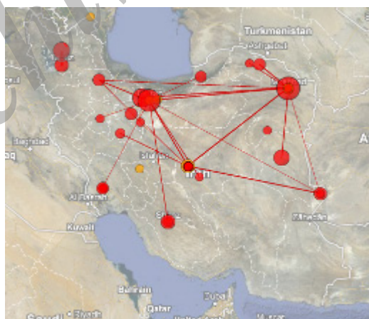
تصویر ۶. توزیع جغرافیایی انتشارات علمی در حوزهٔ موضوعی زعفران در ایران

انتظار می‌رود تجمع تولیدات علمی بیشتر در نواحی شرقی و مرکزی کشور به‌ویژه استان خراسان رضوی باشد. تصویر ۶ نشان‌دهندهٔ تجمع تولیدات علمی در شهر مشهد بوده و استان تهران برای اولین بار در جایگاه دوم قرار دارد. این مطلب نشان‌دهندهٔ رابطهٔ مستقیم میان توجه به قابلیت منطقه‌ای در تولید این محصول و توزیع تولیدات علمی آن است. تحلیل محتوایی نشان می‌دهد که در ۸۵ مقاله، حدود ۷۲/۰۳ درصد، هیچ اشاره‌ای به منطقهٔ جغرافیایی مورد مطالعه تحقیق نشده است و تنها ۳۳ مقاله، یعنی ۲۷/۹۶ درصد جغرافیای مورد بررسی تحقیق خود را ذکر کرده‌اند که بیشتر آنها نیمهٔ شرقی کشور را به‌عنوان جغرافیای بهره‌مندی خود مشخص نموده‌اند و از این تعداد، تنها ۴ مقاله سایر مناطق کشور را به‌عنوان جغرافیای هدف برگزیده‌اند. پس، می‌توان نتیجه گرفت که تلاش در جهت انجام تحقیقات علمی در حوزهٔ موضوعی زعفران در نیمهٔ شرقی کشور، به‌ویژه استان خراسان رضوی بیش از سایر مناطق در کشور است. این مهم نشان‌دهندهٔ وجود رابطهٔ مستقیم میان بهره‌گیری از قابلیت‌های جغرافیایی موجود در نیمهٔ شرقی کشور و تولید انتشارات علمی در این منطقه است. به‌عبارت دیگر، نوعی همگونی در توزیع تحقیقات علمی در این حوزهٔ موضوعی با توزیع قابلیت‌های جغرافیایی موجود در این منطقه برای انجام تحقیقات مربوطه وجود دارد.