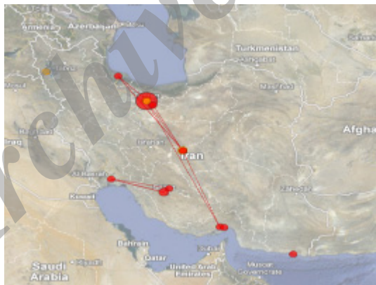
تصویر ۱. توزیع جغرافیایی انتشارات علمی در حوزه موضوعی اقیانوس‌شناسی در ایران

۱۶ مقاله یعنی حدود ۶۶/۶۶ درصد به جغرافیای مورد بررسی تحقیق خود اشاره نکرده‌اند و تنها ۸ مقاله یعنی ۳۳/۳۳ درصد از آنها مناطق شمالی و جنوبی کشور را به‌عنوان جغرافیای مورد بررسی تحقیق خود برگزیده‌اند. لازم به ذکر است که از این تعداد، ۵ مقاله (۶۲/۵ درصد) سواحل جنوبی کشور را به‌عنوان جغرافیای هدف برای انجام تحقیق خود برگزیده و تنها ۳ مقاله (۳۷/۵ درصد) به سواحل شمالی کشور در تحقیقات خود در این حوزه پرداخته‌اند. پس می‌توان نتیجه گرفت که تمرکز تولیدات علمی در مناطق جنوبی کشور بیشتر است و در نتیجه، تلاش در جهت انجام تحقیقات علمی در حوزه موضوعی اقیانوس‌شناسی در مناطق جنوبی بیش از مناطق شمالی کشور می‌باشد. این مهم نشان‌دهنده وجود رابطه مستقیم میان بهره‌گیری از قابلیت‌های جغرافیایی موجود در جنوب کشور و تولید انتشارات علمی در این منطقه است. به عبارت دیگر، نوعی همگونی در توزیع تحقیقات علمی در این حوزه موضوعی با توزیع قابلیت‌های جغرافیایی موجود در مناطق جنوبی کشور برای انجام تحقیقات مربوطه وجود دارد، اما این مهم در سطح کشور نشان‌دهنده نبود رابطه مستقیم میان توزیع انتشارات علمی و قابلیت‌های جغرافیایی حاکم در حوزه موضوعی اقیانوس‌شناسی است.