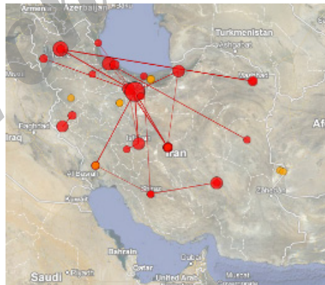
تصویر ۵. توزیع جغرافیایی انتشارات علمی در حوزهٔ موضوعی جای در ایران

انتظار می‌رود به دلیل ماهیت جای پروری مناطق شمالی کشور، تجمع تولیدات علمی در این نواحی بیشتر باشد. تصویر ۵ نشان‌دهندهٔ تجمع تولیدات علمی در استان‌های تهران و آذربایجان شرقی به‌ویژه شهرستان تبریز است. با تحلیل عنوان و چکیدهٔ تولیدات علمی گردآوری شده در این حوزه می‌توان مشاهده کرد که در بیش از نیمی از این تولیدات علمی هیچ اشاره‌ای به منطقهٔ جغرافیایی مورد مطالعهٔ تحقیق نشده است و از ۸۷ مقالهٔ مورد بررسی، ۶۸ مقاله یعنی حدود ۷۸/۱۶ درصد، به جغرافیای مورد بررسی تحقیق خود اشاره نکرده‌اند و تنها ۱۹ مقاله، یعنی ۲۱/۸۳ درصد مناطق شمالی کشور و سایر نواحی جغرافیایی را به‌عنوان جغرافیای مورد بررسی تحقیق خود برگزیده‌اند. لازم به ذکر است که از این تعداد ۱۳ مقاله (۶۸/۴۲ درصد) مناطق شمالی کشور را به‌عنوان جغرافیای هدف برای انجام تحقیق خود در حوزهٔ جای برگزیده و جغرافیای بهره‌مندی تنها ۶ مقاله (۳۱/۵۷ درصد) مربوط به سایر نواحی کشور بود. بنابراین، می‌توان نتیجه گرفت که تلاش در جهت انجام تحقیقات علمی در حوزهٔ موضوعی جای بیشتر در مناطق شمالی کشور است و این مهم نشان‌دهندهٔ وجود رابطهٔ مستقیم میان بهره‌گیری از قابلیت‌های جغرافیایی موجود در شمال کشور و تولید انتشارات علمی در این منطقه می‌باشد. اما در حالت کلی، به‌دلیل حجم بسیار زیاد تولیدات علمی بدون توجه به منطقهٔ جغرافیای خاص، رابطهٔ مستقیمی میان قابلیت‌های جغرافیایی و توزیع تولیدات علمی در این حوزه مشاهده نمی‌شود.