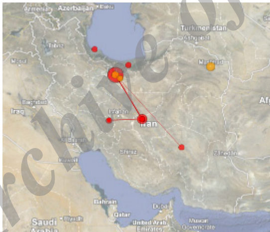
تصویر ۴. توزیع جغرافیایی انتشارات علمی در حوزه موضوعی بیماری تب شالیزار در ایران

انتظار می‌رود که مناطق غربی و مرکزی سواحل دریای خزر به دلیل شرایط خاص آب‌وهوایی و شیوع این بیماری در این حوزه فعال تر باشند. تصویر ۴ نشان‌دهنده مرکزیت استان تهران در تجمع تولیدات علمی در این حوزه است. در عین حال، پیوند قوی میان تولیدات علمی استان‌های تهران و گیلان که به عنوان مرکز تجمع تولیدات علمی و منطقه مستعد جغرافیایی در تجمع این بیماری شناخته شده‌اند، نشان‌دهنده توجه به بهره‌برداری از قابلیت‌های منطقه و جغرافیای تولید علم در این حوزه است.