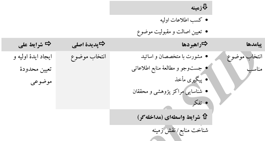
شکل ۴. کدگذاری محوری انتخاب موضوع

به‌عنوان زمینه یاد می‌کنند، صورت می‌گیرد و از زمینه و بافت آموزشی، پژوهشی، اجتماعی، فرهنگی و اقتصادی نیز تأثیر می‌پذیرد.