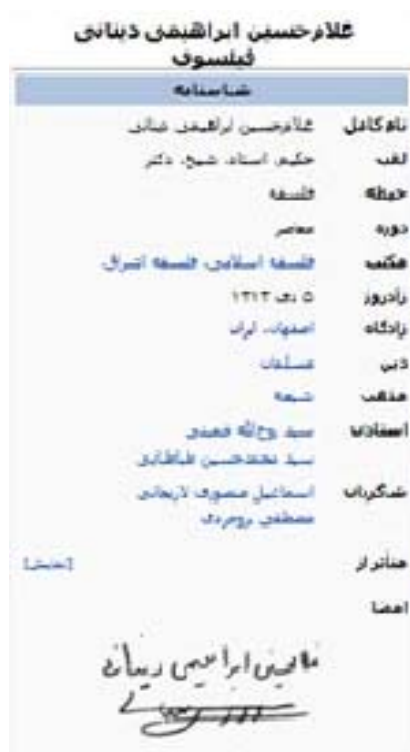
شکل ۲. نمونه‌ای از یک جعبه اطلاعات ویکی‌پدیا