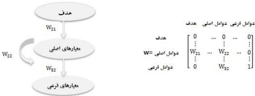
شکل ۲. ساختار شبکه‌ای و سوپرماتریس اولیه

لازم به ذکر است که ماتریس حاصل از تکنیک «دیمتل» (ماتریس ارتباطات داخلی)، در واقع تشکیل‌دهنده بخشی از سوپرماتریس فوق است. به عبارت دیگر، تکنیک «دیمتل» به‌طور مستقل عمل نمی‌کند، بلکه به‌عنوان زیرسیستمی از سیستم بزرگ‌تری چون «ای‌پی‌ان» ۱ است. در واقع، در این مرحله «دیمتل» و «ای‌پی‌ان» فازی ترکیب می‌شوند تا با استفاده از روش فرایند تحلیل شبکه‌ای، عوامل بر اساس میزان اهمیت رتبه‌بندی شوند. در ساختار ماتریسی، هدف در سطح اول شبکه و عوامل اصلی در سطح دوم قرار می‌گیرند که عوامل اصلی دارای وابستگی درونی هستند (ماتریس حاصل از تکنیک «دیمتل»). در ساختار مربوطه، عوامل فرعی در سطح سوم قرار می‌گیرند. در سوپرماتریس W ، W_{21} وزن نسبی عوامل اصلی با توجه به گره هدف، W_{22} وزن داخلی بین عوامل اصلی و W_{32} وزن عوامل فرعی نسبت به عوامل اصلی متناظرشان است. ماتریس T که خروجی روش «دیمتل» فازی است، پس از نرمال‌سازی به‌عنوان ماتریس W_{22} ، در نظر گرفته می‌شود. برای محاسبه W_{21} و W_{23} از مقایسات زوجی استفاده می‌شود. این فرایند از طریق مقایسات دوجه‌دو با پرسش این سؤال آغاز می‌شود: تا چه میزان این معیار در مقایسه با سایر معیارها با توجه به علایق و ترجیحات، اهمیت/ تأثیر بیشتری دارد؟ ارزش اهمیت نسبی را می‌توان با استفاده از مقیاس ۱ تا ۹ با در نظر گرفتن اهمیت تعریف نمود (Saaty 1996). متغیرهای زبانی و اعداد فازی مورد استفاده برای مقایسات زوجی در جدول ۵، درج شده است.