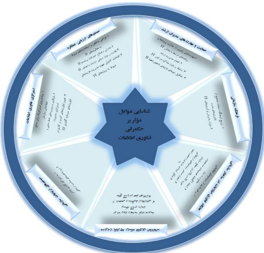
شکل ۳. دسته‌بندی زیرعوامل مربوط به هر عامل با توجه به نتایج فن دلفی

پس از اجرای فرایند دلفی فازی، عوامل و زیرعوامل تأییدشده مطابق شکل ۳، ترسیم می‌گردد.