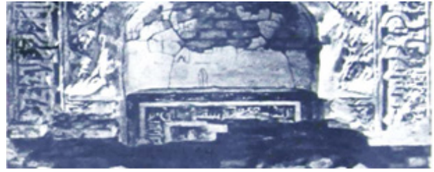
تصویر ۱۳. کتیبه گچی درون محراب، به خط کوفی برگدار (مورق)، رباط شرف.

از نظر جنس، تاریخ و مضامین، کتیبه‌ها در بُعد تاریخی