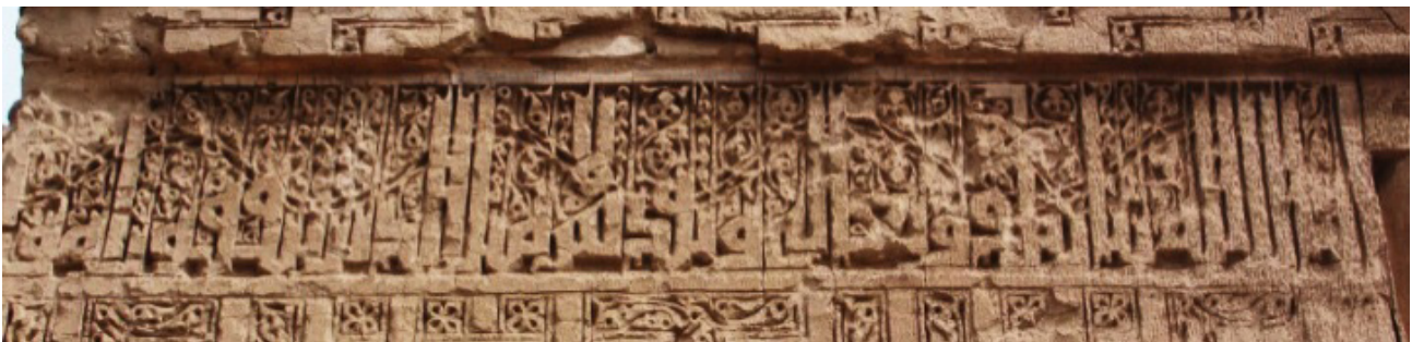
تصویر ۲. کتیبه گچی سمت چپ ایوان ورودی، رباط ماهی.

۳- کتیبه داخل ایوان ورودی: در دو طرف پایه های ورودی ایوان رباط، هم اکنون کتیبه ای گچی به خط کوفی غیر از آنچه در تصویر عبدالله قاجار دیده می شود، وجود دارد. این کتیبه سه طرف داخل ایوان را دور می زده که هم اکنون بقایای این کتیبه تنها در زیر قوس تاق ایوان ورودی مشاهده می شود. متن کتیبه در سمت راست داخل ایوان، با آیه ۲۶۱ سوره بقره چنین شروع می شود: «قال الله تبارک و تعالی و تقدس مثل الذین ینفقون اموالهم فی سبیل الله کما انبتت سبع سنابل فی کل سنبله مائده حبه و الله یضاعف، در بالای سردر ورودی همراه با تاق ورودی فروریخته است. در سمت چپ ایوان کلمات انتهایی آیه «.../.../.../.../.../...» از کتیبه باقی مانده است. انتهای کتیبه در