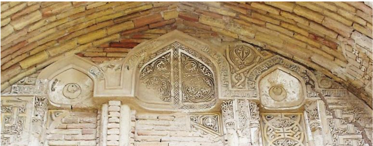
تصویر ۱۱. کتیبه گچی داخل ایوان دوم، آیه ۵۳ زمر، به خط کوفی ساده، رباط شرف.

« /... / عمل ابی الحسن /... / » که احتمالاً حاوی نام یکی از سازندگان اصلی بنا بوده، باقی مانده است (ibid, 41). ۳- دو کتیبه گچی مخدوش شده در ابتدای قوس تاق ایوان و درست در بالای ابتدا و انتهای کتیبه ثلث ایوان سوم مشاهده می شود. این دو کتیبه به خط کوفی معقد بر زمینه اسلیمی از گچ ساخته و قالب گیری شده بودند (تصویر ۱۴) که آندره گذار به آن اشاره ای نکرده است.