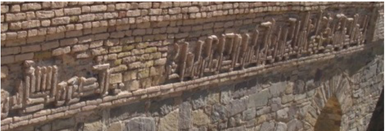
تصویر ۴. کتیبه کوفی گوشه‌دار گچی محراب (آیت‌الکرسی)، رباط زیارت.

۱- در شبستان مسجد رباط بر پاکار پوشش‌ها کتیبه آجری کوفی به عرض یک متر نقش بسته است. شبستان تالاری مستطیل‌شکل به ابعاد ۴/۵ × ۱۵ متر است. کتیبه در ارتفاع دو متری پس از چیدن دو رج آجر در داخل یک قاب که با عقب‌نشینی آجرها ایجاد شده و تالار را دور می‌زده، ساخته شده است (همان، ۴۷). بر دیوار شمالی آن آیت الکرسی (بقره، ۲۵۵) و بر دیوارهای جنوبی آن نیز بقایای کتیبه‌ای