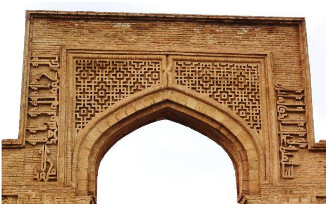
تصویر ۶. کتیبه آجری دو طرف ایوان (ورودی) اصلی، به خط کوفی گلدار، رباط شرف.