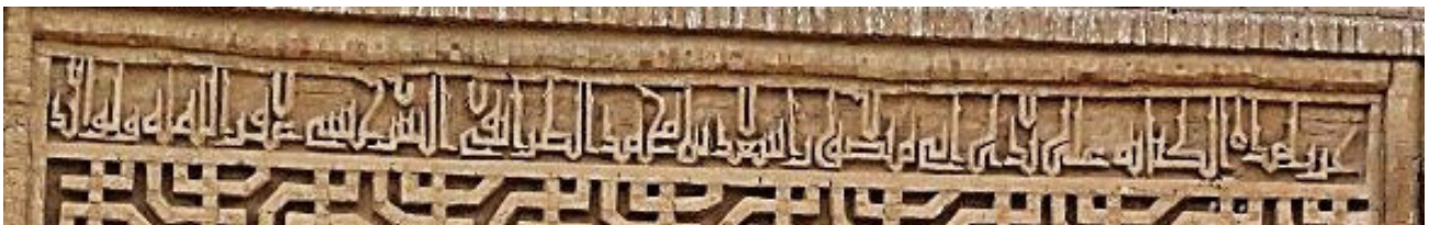
تصویر ۹. کتیبه آجری کوچک سردر ایوان انتهایی، به خط کوفی ساده، رباط شرف.