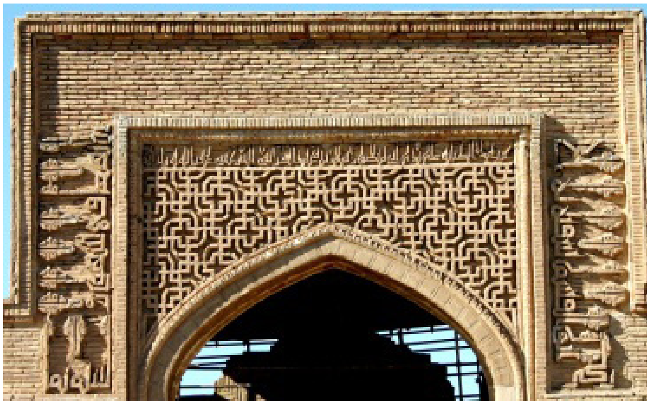
تصویر ۷. کتیبه آجری دو طرف ایوان انتهایی، به خط کوفی گلدار، رباط شرف.