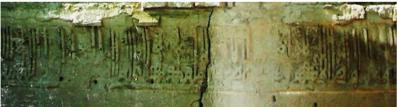
تصویر ۳. کتیبه گچی سمت راست ایوان شمالی، رباط ماهی.