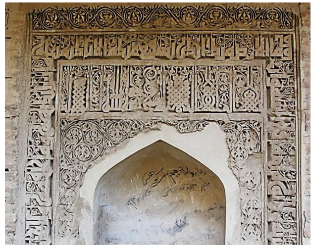
تصویر ۱۲. کتیبه های گچی محراب ها، آیه ۲۵۵ بقره، به خط کوفی برگردار (مورق)، رباط شرف.

همگی کتیبه های کوفی و حتی ثلث رباط های بررسی شده بدون نقطه اند. از نظر شیوه نگارش در سردرهای رباط شرف و ماهی دو نوع خط وجود دارد؛ در رباط شرف و ماهی خط درشت (جلی) که با استفاده از آجرهای بزرگ، سردرها را دور می زده و در طرفین سردرها نیز ادامه یافته است. دیگری خط باریک و ظریفی (خفی) است که به صورت افقی روی طرح هندسی سردر ایوان انتهایی (شرف) و ایوان اصلی (ماهی) نگاشته شده اند. قابل توجه این که درشتی خطی که سردرها را دور می زند با خط ظریف بالای پشت بغل ها و طرح هندسی آن ها رابطه ای بسیار موزون و هنرمندانه دارد. در رباط ماهی خط ظریف درست در بالای سردر ورودی نگاشته و در دو طرف سردرها از خط درشت