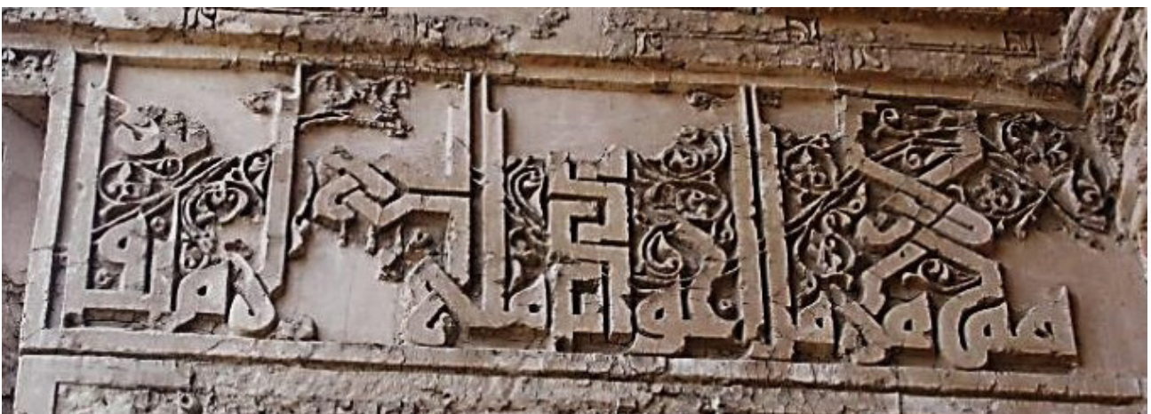
تصویر ۱۰. کتیبه گچی سمت راست ایوان دوم که به کلمات عربی ختم می‌شود، به خط کوفی معقد، رباط شرف.