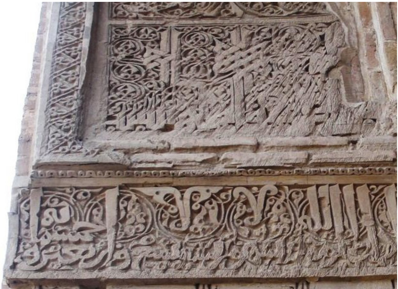
تصویر ۱۴. انتهای کتیبه‌ی ثلث ایوان سوم. و کتیبه گچی بالای آن، به خط کوفی معقد، رباط شرف.