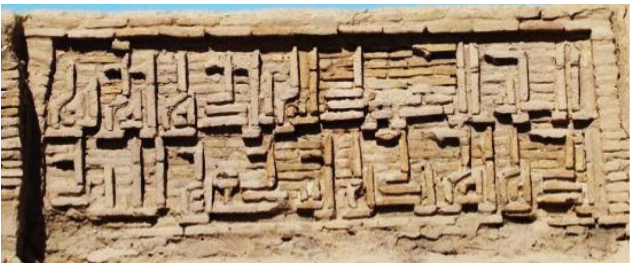
تصویر ۵. کتیبه کوفی گوشه‌دار گچی محراب (سوره توحید)، رباط زیارت.