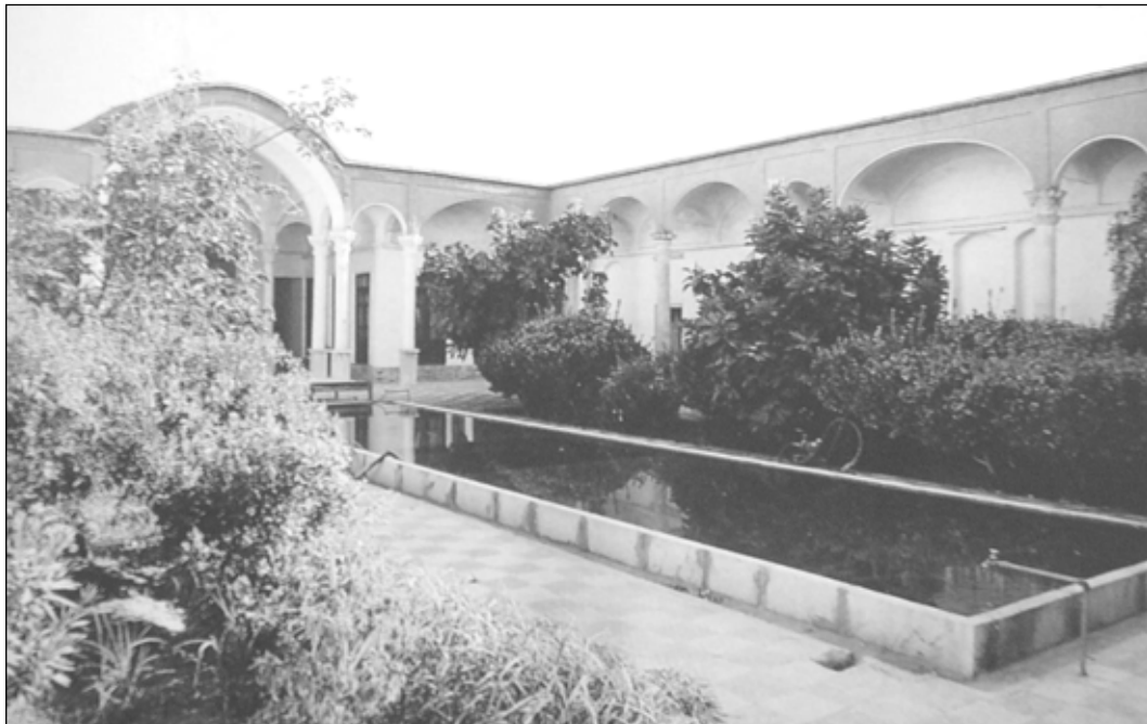
تصویر ۱: جایگاه استقرار حوض آب در حیاط خانه سنتی ایران

هر بنایی به عنوانی جزئی از فرهنگ، وظیفه دارد که یک اندیشه ذهنی را از طریق فرم، عینیت بخشد و این عینیت حامل پیامی تحت عنوان "هویت" مطرح می شود. معمار سنتی در جستجوی نظمی بر اساس بهره وری از مواهب طبیعی و هماهنگی با نظم حاکم بر طبیعت بوده؛ به دنبال آماده سازی مکانی است که هر آنچه از مواهب طبیعی است، در محدوده زیست فراهم آورد؛ بدون آنکه خلوت زندگی به هم بخورد. در پاسخ به این خواست، خصوصی ترین باغ درونی را می سازد و آن را با نام حیاط معرفی می کند. حالت بلورین و طرح منظم هندسی فضاها در خانه سنتی و ساختار هندسی این واحدهای بلورین برگرد حیاط، بر اساس ملاحظات محیط زیست و رعایت عرصه های عمومی تا خصوصی است که کل خانه را می سازد.