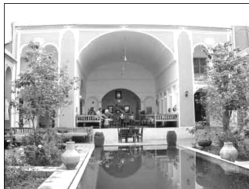
تصویر ۴: تدوین فضای قرار در حیاط خانه سنتی با استفاده از عنصر آب

در اسلام آب زمینه ساز ارتباط با معبود بوده و شرط دخول در بسیاری از عبادات، وضو داشتن است. انجام آیین وضو، به معنای یکی دانستن خود، در دنیای مادی، با موج رحمت خدا و بازگشت به همراه آن به سوی اصل و مبدأ است. (لینگز، ۱۳۷۴: ۶۰۵). حضور آب در حوض حیاط های خانه سنتی، فرصت مناسبی را جهت انجام مقدمات فرائض دینی فراهم می آورد.