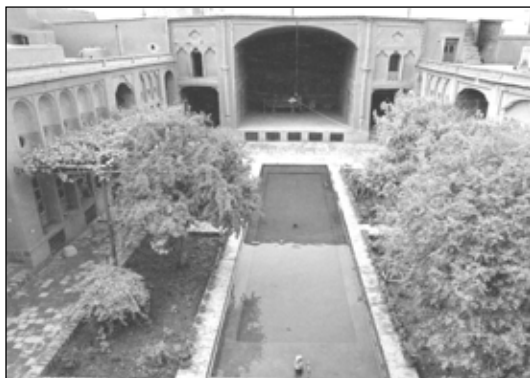
تصویر ۵: منظر دل انگیز و روح افزای حیاط در همراهی آب با گیاه و معماری

به طور کلی حوض در حیاط به دلیل تلطیف هوا، محلی برای وضو، همچنین شستشو و ذخیره آب برای آبیاری باغچه ها در نظر گرفته می شد. در فرهنگ اسلامی حضور آب در حوض و در دل حیاط، به عنوان نماد زندگی، بهشت، پاکی و نشانه زیبایی و آبادانی است و آب گذشته از جنبه مصرفی آن، بیشتر به دلیل جنبه های نمادین آن، مورد استفاده قرار گرفته است. حوض آب، نماد بهشت و زندگانی است. تعالیم اسلامی آب را به صفت طهور (پاک و پاک کننده) و مبارک و خجسته توصیف می نماید؛ که در قرآن با آیات و انزلنا من السماء ماء مبارکاً؛ از آسمان، آبی خجسته و مایه برکت نازل کردیم (ق، ۹) بیان شده است.