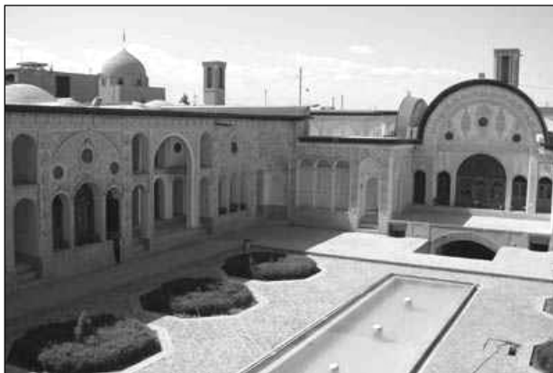
تصویر ۳: تشدید اهمیت مرکزگرایی در معماری سنتی ایران با قرار دادن عنصر ارزشمند آب

وجود حوض در مرکز حیاط، اشاره بر اهمیت و مرکزیت آب در هستی دارد. حیاط مظهري از صورت مرکزگرای عالم صغیر یا باطن است. فضا در حد مکان "کنز مخفی" خانه در شکل محاط شده است، همچنان که در انسان نیز نفس که دربرگیرنده روح است، در جسم محاط می شود. میانکش شکل و سطح باید فضایی پاک، غرق آرامش و خالی از هر تنش و تفکر انگیز باشد. تعبیه حوض سنتی در این فضای آرام، مرکزی را همچون جهتی مثبت برای تخیل خلاقه فراهم می آورد. بدینسان آفرینش عرضی آدمی به علت طولیه می پیوندد و بازسازی بهشت تمامی می پذیرد. (اردلان و بختیار، ۱۳۸۰: ۶۸) تصور بهشت موعود که از ادوار قبل تا کنون در مخیله ایرانیان به وجود آمده، تصویری است از زیباترین و دلپذیرترین باغ ها. (ویلبر، ۱۳۴۸: ۵۲) حیاط ها نماد و تمثیلی از بهشت هستند که در خانه های ایرانی، جلوه خاص خود را داشته اند. به تعبیر بورکهارت، طبیعت بهشت ایجاب می کند که مستور و راز آلود باشد؛ به همین ترتیب خانه مسلمان با حیاط مرکزی محصور شده به همراه درختان و آب، مشابه این جهان معنوی است. (نقی زاده، ۱۳۴۸: ۲۲۲) همچنین آیات بسیاری در قرآن به کرات آب را به عنوان یکی از عناصر بهشت معرفی می نماید. ۴