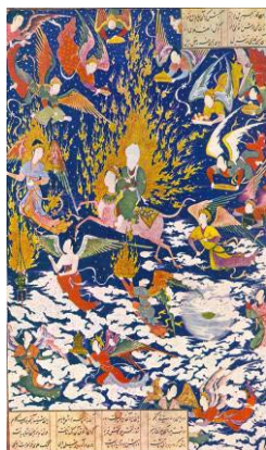
تصویر ۴: سلطان محمد، معراج پیامبر، خمسه شاه تهماسبی، مکتب تبریز، قرن ۱۰ ه. ق.