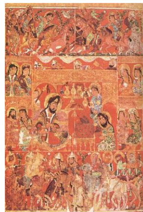
تصویر ۱: کتاب التریاق، مکتب سلجوقی قرن ۷ ه. ق.