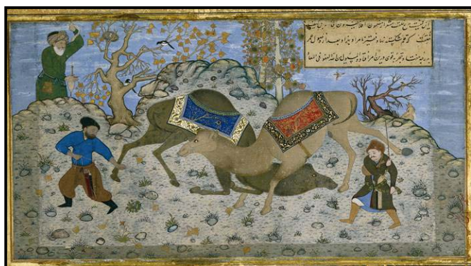
تصویر ۷. نزاع شتران، مرقع گلشن کمال الدین. بهزاد، هرات، حدود ۹۳۵ هـ ق)