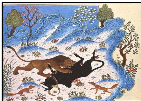
تصویر ۶. شیر در حال کشتن گاو، کلیله و دمنه شاهنامه بایسنقری، هرات، ۱۴۳۰

آورده اند. همچنین کیمیا وارد تصوف اسلامی شد و تا کنون نیز این تأثیر را در میان صوفیان دارد" [آرام ۱۳۶۶: ۴۷]. در واقع هنر نگارگری ایران در تجسم عالم ملکوت و ماهیت نورانی آن با استفاده از رنگهای ناب (ملهم از جوهره ی نورانی آنها)، و نیز، کاربرد طلا (با مفهوم کیمیایی آن) توانسته است، تصاویر نمادینی را بر مبنای مفاهیمی متعالی و معنایی خلق کند. نگارگر ایرانی توانسته است نور را بصورت تجسم آسمانهای طلایی که عالم سراسر نور خوارنه و حضور نور ایزدی را در جهان هستی نمایندگی می کند؛ هاله های نور طلایی رنگ دور سر قدیسن، پیامبران و شهriاران کیانی که نشان از برخورداری انسانهای کامل از خوره شهریاری یا "فر ایزدی" خاص آنها می دهد؛ تجسم گرفت و گیر نیروهای خیر و شر، نور و ظلمت در قالب داستانهای حماسی (مانند نبرد بهرام گور و اژدها) (تصویر ۵) و یا بیان سمبلیک آن در قالب فرم های حیوانی (مانند گرفت و گیر شیر و گاو) (تصویر ۶) و فرم های گیاهی (مانند درختان خشکی ده و سر سبز) (تصویر ۷) به صورتی محسوس وارد دنیای تصویری نمادین خویش نماید.