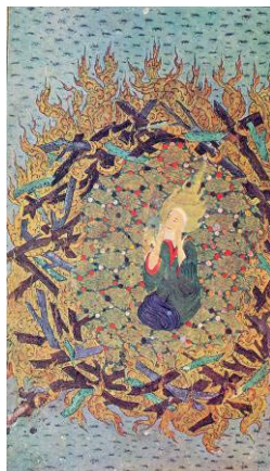
تصویر ۲: ابراهیم میان آتش مکتب شیراز، قرن ۸