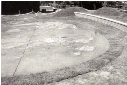
تصویر ۳. طرح مشارکتی کودکان با دانشجویان معماری برای نصب آثار هنری در حیاط دبستان (Sutton et al,2002)

یافتن به نیازهای واقعی کودک به عنوان استفاده کننده اصلی فضا است. در این خصوص با استناد به نظریات مشارکت استفاده کننده در فرایند طراحی، ورود کودکان به فرآیند طراحی و نظرسنجی از آنها به روش هایی چون نقاشی از محیط محله و تعامل مناسب آنان با کارگروه طراحی و ساخت و مداخله آنان در خلق فضای مناسب می تواند مورد توجه باشد. بدیهی است که مشارکت آگاهانه و علاقمندانه کودکان در خلق فضاهای باز محله مثل بوستان کودک، خلاقیت آنها را در تمام ابعاد برمی انگیزد و خود به ایجاد محیط خلاقانه تری منجر می شود و امکان حضور بیشتر و بهره برداری بهینه آنها را نیز به دنبال دارد.