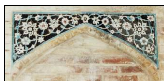
تصویر ۵. کاشیکاری معرق با نقش گل اناری و گل برگ چناری. طاقچه های داخل سردر کاروانسرا.