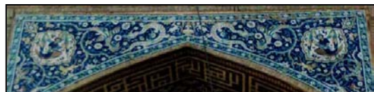
تصویر ۱۱. تابلو های کاشیکاری معرق با نقش فرشته، سیمرغ، اژدها، ضلع شمالی و جنوبی حیاط کاروانسرا.

طاق بستان دو فرشته بالدار را تحت تاثیر هنر روم باستان می بینیم. اما فرشته ها لباس ساسانی به تن دارند. بنابراین هنر ایران در دوران مختلف علی رغم تاثیر پذیری از شرق و غرب، هرگز حال و هوای خود را از دست نداده است و اینگونه نبوده که تماماً تحت تاثیر واقع شود. بلکه تاثیرات بیگانه را در خود حل کرده و هنری ترکیبی و دلنشین ارائه نموده است. به طوریکه در تمام قسمت های این تابلو علی رغم استفاده شکل ها و موضوعات مختلف یک هماهنگی در ترکیب بندی شکل و رنگ وجود دارد که حال و هوای نقاشی سستی ایرانی در آن حفظ شده است. (تصویر ۱۱)