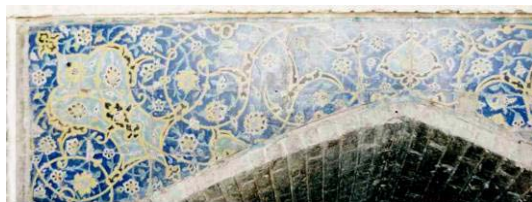
تصویر ۲۳. کاشیکاری معرق با نقش ترنج و اسلیمی لچکی های سردر آب انبار.

ورودی قوسی آب انبار در وسط دیوار مقابل قرار دارد. در بالای قوس لچکی هایی با زمینه آبی و نقوش گل و بته و ترنج و اسلیمی با رنگ سفید و رنگ زرد و سیاه دیده می شود. نقش ترنج های بزرگ که در مرکز لچکی ها قرار دارند با دیگر ترنج هایی که در سایر لچکی ها در این مجموعه متفاوت است. این ترنج ها دارای شکلی کشیده هستند که داخل آنها ترنجی کوچک دیده می شود. این ترنج کوچک و سر ترنج (ترنج کوچک) که نوک ترنج است و اصطلاحاً به آن سر ترنج می گویند) دارای شکل و رنگ مشابه هستند. ترنج دیگری به شکل قلب (یا سرو خلاصه شده) در وسط تابلو قرار دارد. بنابراین چهار گونه ترنج در این تابلو دیده می شود. (تصویر ۲۳)