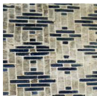
تصویر ۲۲. آجر و کاشی لاجوردی با نقش هندسی داخل سردر آب انبار.

داخل قوس در قسمت بالا و زیر سقف مقرنس کاری گچی است. روی سطوح مقرنس نقاشی رنگی بوده که از بین رفته و بازسازی شده است. در قسمت پائین و ازاره های دیوار روبرو و دیوارهای جانبی، ترکیبی از آجرهای لعاب دار لاجوردی و آجر ساده کرم رنگ مشاهده می شوند که در قطعات مربع و مستطیل با شکل های لوزی شکل چیده شده اند. (تصویر ۲۲)