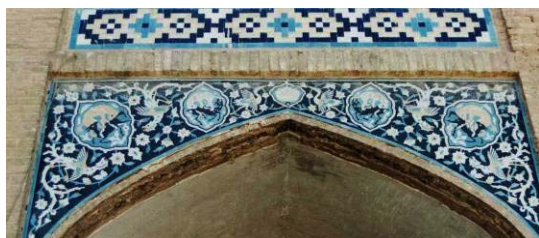
تصویر ۱۳. کاشیکاری معرق با نقش لک لک ها، سیمرغ و حیوانات. حیاط کاروانسرا. ضلع شرقی طبق پایین.

تابلویی با زمینه سیاه و نقش گل و بته، اسلیمی، ترنج و حیواناتی مانند شیر و آهو و پرندگانمانند لک لک و سیمرغ در حال پرواز هستند. در وسط تابلو یک سر شیر سفید روی ترنجی با زمینه فیروزه ای دیده می شود. چهار ترنج دیگر با زمینه فیروزه ای که به صورت قرینه در طرفین سرشیر قرار دارند. داخل دو ترنج شیر سفیدی است که آهوی سیاه را گرفته است و در دو ترنج دیگر، شیر حنایی آهوی سیاه را گرفته است. در طرفین این دو ترنج دو سیمرغ با دم های پیچان و بلند در حال پرواز هستند. سیمرغها سفید، نوک، پا و قسمتی از پرهای آنها آبی است. در طرفین سر شیرها دو لک لک با پرو بال سفید در حال پرواز هستند در حالی که نوک، پا و بخشی از پر آنها کرم و آبی است. (تصویر ۱۳)