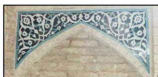
تصویر ۷. کاشیکاری معرق با نقش ترنج و اسلیمی. طاقچه های داخل سردر کاروانسرا.