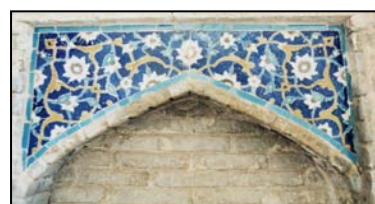
تصویر ۸. کاشیکاری معرق با نقش گل اناری و اسلیمی های فیروزه ای و طلایی. طاقچه های داخل سردر کاروانسرا.