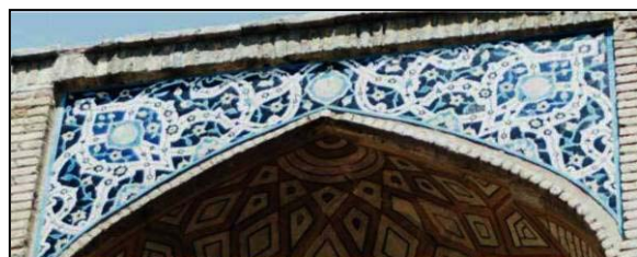
تصویر ۱۲. کاشی کاری معرق در حیاط کاروانسرا. ضلع شرقی طبقه بالا.

تابلوی زمینه سیاه با اسلیمی و ترنج سفید که بصورت نوار پهن می باشند. زمینه ترنجهای مرکز لچکی ها لاجوردی است. داخل ترنجهای و در وسط تابلو سه سر شیر به رنگ کرم روی زمینه فیروزه ای قرار دارند داخل نوارهای سفید پهن، نوار نازک سیاهی با گل و بته های ریز از گل اناری رد شده است. (تصویر ۱۲) این گونه نوار سفید پهن قبلاً در حاشیه بیرونی سردرینای قبه سبز کرمان** متعلق به قرن هفتم هجری وجود داشته است. (ضلع شرقی، طبقه بالا سمت چپ ایوان های ورودی و ضلع شمالی و جنوبی طبقه بالا سمت راست). سمت راست ایوان ورودی و سمت چپ ایوان شمالی و جنوبی قرینه تابلوی بالایی با یک تفاوت دیده می شود. باین ترتیب که سر شیرها حذف شده و در وسط تابلو یک گل سفید روی زمینه فیروزه ای قرار دارد.