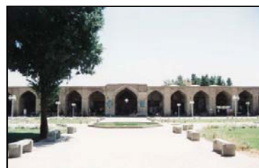
تصویر ۱. نمایی از میدان گنجعلی خان با ورودیهای بازار ماخذ : نگارنده