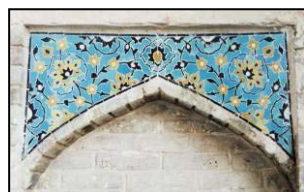
تصویر ۴. کاشیکاری معرق با نقش گل برگ چناری. طاقچه های داخلی سردر کاروانسرا.

هریک از این طاقچه ها به تابلویی ظریف و زیبا می ماند که تلفیقی از آجرکاری ساده هندسی بارنگ کرم، کاشیکاری گلدان و رنگین است. ترکیب بندی این طاقچه ها و محل قرار گیری آنها و عجين شدن با فضای اطراف و همچنین نقوش و رنگهای بکار رفته در آنها همگی معرف مهارت هنرمندان این عصر است. در اینجا از افراط در کاشیکاری خبری نیست. بلکه کاشی و آجر با هم تلفیق شده و فضایی ملایم و دلچسب را بوجود آورده اند. همچنین از نکات مهم و قابل تامل در این شیوه، ایجاد اختلاف سطح به واسطه حاشیه های برجسته آجری است که بر زیبایی و تنوع کار صد چندان می افزاید. (تصاویر ۴ و ۵ و ۶ و ۷ و ۸)