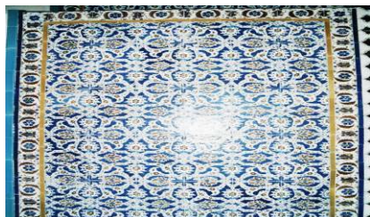
تصویر ۱۵. کاشی هفت رنگ با نقش گلهای چهار پر. ازاره رخت کن حمام.

در طرفین قوس ورودی رختکن از داخل، دو سنگ مرمر سفید با نقش برجسته لک لک ها در حال پرواز دیده می شود ۳ سپس دو سکوی سنگی که بالای آنها به ارتفاع یک متر از ااره کاشیکاری با نقش گلهای انار و کوبک وجود دارد. حاشیه بالای ازاره ها نوار پهنی با نقش صورت زن، گل انار و اسلیمی و برگهای کنگره دار، روی زمینه لاجوردی است. صورتها و گلها در شکل دایره طراحی شده، زمینه صورت سفید و همچون نقاشی های عصر صفوی زیبایی شناسی معمول آن دوره را نشان می دهد. اجزای صورت با رنگ سیاه است. بین هر دو صورت یک گل انار قرمز و سیاه به حالت یکی درمیان وارونه قرار دارد. دو رشته اسلیمی پهن زنجیر وار درهم گره خورده و صورتها و گلها را در برگرفته است. اسلیمی ها سفید، سیاه و آبی هستند. یک نوار حنائی از پایین و یک نوار فیروزه ای از بالا این حاشیه را قاب کرده اند. این گلهای در ردیفهای افقی کنار هم قرار گرفته و از ترکیب هر چهار گل باهم یک گل در وسط آنها تشکیل شده و جمعاً یک الگو با پنج گل را بوجود می آورند. گلهای با خطوط محیطی سفید و زمینه لاجوردی هستند. داخل خطوط پهن سفید یک نوار باریک از گلها و برگهای ریز اناری به رنگ نارنجی، رد می شود. داخل هر گلبرگ، یک گل به رنگ نارنجی قرار دارد. این نحوه رنگ آمیزی با رنگهای آبی، سفید و نارنجی احتمالاً تاثیر گرفته از کاشیکاری عثمانی باشد. *** تاثیرپذیری هنر عثمانی از صفوی در پایتخت عثمانی به وفور مشاهده می شود. اما به ندرت تاثیر متقابل را در هنر صفوی شاهد هستیم. (تصویر ۱۵) همین نقش در قسمتی دیگر از ازاره دیده می شود، در حالیکه به جای رنگ لاجوردی از فیروزه ای استفاده شده است.