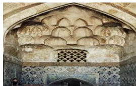
تصویر ۲۱. سردر آب انبار گنجعلی خان با مقرنس کاری و نقاشی های رنگین روی گچ و کاشیکاری.

آب انبار گنجعلی خان در سال ۱۲۰۹ هجری (۱۷۹۳ م) به فرمان علیمردان خان پسر گنجعلی خان حاکم کرمان ساخته شده است. روی کتیبه سنگ مرمر سفید که داخل سردر آب انبار دیده می شود، با خط نستعلیق اشعاری کنده کاری شده که نام سازنده آب انبار و نام شاه عباس صفوی و تجلیل نسبت به او و تاریخ ۱۲۰۹ هجری (ساخت آب انبار) را نشان می دهد. این آب انبار در ضلع غربی میدان گنجعلی خان در میان بازار مسگرها واقع شده است. قوس بلند سردر این آب انبار دارای تزئینات کاشی، و نقاشی روی گچ می باشد. (تصویر ۲۱)