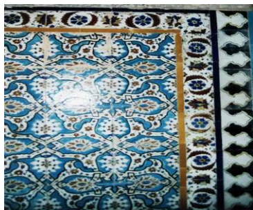
تصویر ۱۶. حاشیه های ساده، گلدار و هندسی در ازاره حمام

در قسمت پائین ازاره کشیده شده است. این گل‌ها به صورت مثبت و منفی و عکس یکدیگر، یکی سفید و دیگری قرمز در حالی که قرمزها سربالا و سفیدها رو به پائین قرار دارند. (تصویر ۱۶) کف سکوها با کاشیهای مربع فیروزه ای به طور یکنواخت فرش شده است.