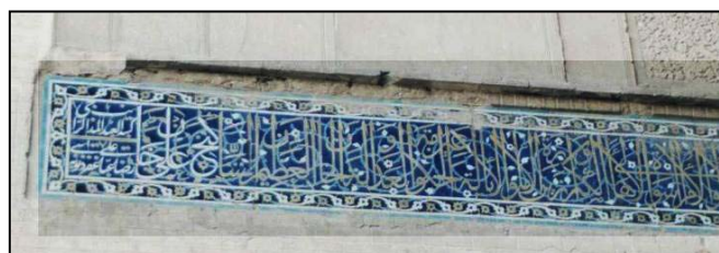
تصویر ۳. کتیبه خط ثلث با امضاء رضا عباسی، داخل سردر کاروانسرا

زیر قوس سردر قسمتی از کتیبه نفیسی از خط ثلث اثر رضا عباسی خطاط معروف زمان صفوی را می بینیم. جملات آخر این کتیبه نام و القاب حاکم وقت را نشان می دهد. زمینه کتیبه لاجوردی و خطوط به رنگ طلایی است. در انتهای کتیبه نام گنجعلی خان با رنگ سفید نوشته شده و بلافاصله داخل قاب سفید مربع با خط نستعلیق نام رضا عباسی به چشم می خورد. (تصویر ۳) ترکیب بندی حروف در این خطاطی با ترکیبی پیچیده و پر تحرک می باشد. خطوط طلایی که در جهات افقی، عمودی، مایل و گرد قرار دارند با اسپیرال های ظریف آبی در هم آمیخته و بین آنها گل و غنچه های بسیار کوچک سفید پخش شده است. سه نوار باریک سفید به ضخامت خطوط طلایی، حاشیه گلدان کتیبه را قاب می کنند. حاشیه زیبایی با زمینه سیاه و زنجیری از گل های کوچک سفید و طلایی و خطوط آبی کتیبه را قاب کرده اند. این کتیبه داخل قاب مقعر آجری قرار دارد که وجود این قاب به زیبایی آن افزوده است.