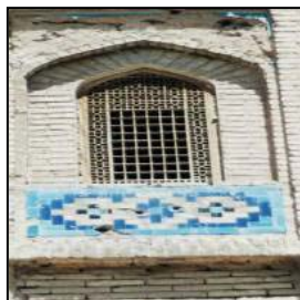
تصویر ۱۰. نوار آبی تزئینی از آجر و کاشی. نمای پنجره حجره های کاروانسرا.

نقوش لچکی ها متنوع و شامل انواع نقش‌مایه‌های گیاهی، حیوانی، اسلیمی و اندام‌های افسانه ای است. جلوی ایوان حجره های طبقه بالا، تابلوهای باریک مستطیل شکلی دیده می شود که مانند نواری رنگین دورتادور حیاط در حد فاصل بین حجره های بالا و پایین کشیده شده اند. نقوش این تابلوها ترکیبی از کاشی و آجر با شکل‌های هندسی است. و شامل مربع و مستطیل های کوچکی است که بصورت لوزی کنارهم چیده شده اند به این شیوه ترکیب آجر و کاشی در قطعات کوچک مربع و مستطیل معقلی می گویند. (تصویر ۱۰)