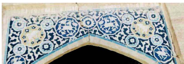
تصویر ۱۴. کاشیکاری معرق با نقوش گیاهی و هندسی (ترنجها). حیاط کاروانسرا. ضلع شمالی طبقه پایین.

تابلویی با نقش متفاوت شامل پانزده قاب به شکل گل وجود دارد. این قابها بصورت قرینه هفت قاب در سمت راست، هفت قاب در سمت چپ و یکی در وسط تابلو واقع شده اند. در طرفین هر پنج قاب یک مجموعه گل پنج پر بوجود آورده است. و چهار قاب دیگر دوتا در گوشه های پایین تابلو و دوتاد در طرفین قاب وسطی هستند. داخل چهار قاب نقش آهو و داخل دو قاب نقش شیر دیده می شود. داخل پنج قاب کوچک نقش گل انار و داخل چهار قاب کوچک نقش گل هفت پر جلب نظر می کند. بین این قابها خطوط سفید روی زمینه لاجوردی تابلو پخش شده است. قاب های نامبرده با زمینه های خاکی، لاجوردی و آبی، گلها و حیواناتها به رنگهای سفید، آبی، لاجوردی و خاکی بر رنگ متضاد زمینه جلوه گر شده اند. (ضلع شمالی طبقه پایین بالای قوس پلکان) خطوط سفید بر زمینه لاجوردی با حاشیه سفید قابها هماهنگی دلنشینی به وجود آورده اند. (تصویر ۱۴)