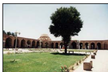
تصویر ۲. نمایی از میدان گنجعلی خان با سردر کاروانسرا

مجموعه گنجعلی خان بر روی دکان‌ها و خانه‌های قدیمی شهر که اسناد خرید آنها نیز موجود می‌باشد مابین شهر قدیم و محلات شمالی شهر احداث می‌گردد. ترتیب قرارگیری این مجموعه بر سر راه بازار قدیم به گونه‌ای است که اهمیت یافتن مسیر تازه بازار را از جانب مجموعه گنجعلی خان بطرف شرق خاطر نشان می‌سازد. این مجموعه در طی سال‌های ناآرامی اوایل حکومت قاجار و در حمله آغامحمدخان به کرمان آسیب دید و طی سالیان بعد نیز به دلیل تغییراتی که در عملکرد آن داده شده بود در خطر نابودی قرار داشت ولی خوشبختانه در دهه‌های اخیر بازسازی شده و در وضعیت خوبی به سر می‌برد. این مجموعه مشتمل بر میدان، کاروانسرا، حمام، آب انبار، ضرابخانه، مسجد و بازار است. عنصر اصلی مجموعه گنجعلی خان که بناهای مختلف در اطراف آن شکل گرفته‌اند میدان می‌باشد که به میدان خان مشهور بوده است. این میدان سال‌ها مرکز اقتصادی شهر و شاهد حوادث و وقایع تاریخی چندی بوده است. میدان در دوره‌هایی مقر حکومتی و محل تجمع سربازان بود. شکایات مردم در این محل حل و فصل می‌شد حتی برخی مجرمین نیز در این محل سیاست می‌شدند. این میدان با ۱۰۰ متر طول و ۵۰ متر عرض از سه طرف بوسیله بازار احاطه شده است. در ضلع شمالی میدان ضرابخانه، ضلع شمال شرقی مسجد، ضلع غربی آب انبار، ضلع جنوبی حمام و در ضلع شرقی آن کاروانسرا قرار دارد. موقوفات فراوانی برای این مجموعه در نظر گرفته شده بود. (تصاویر ۲و ۱)