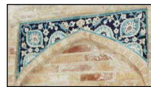
تصویر ۶. کاشیکاری معرق با نقش ترنج و سرترنج. طاقچه های داخلی کاروانسرا. ماخذ : نگارنده