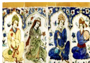
تصویر ۱۹. کاشیکاری هفت رنگ با نقش زنان نوازنده و ساقی. بخشی از دیوار فضای واسطه.

فضای واسطه به صورت دالانی پیچ در پیچ با ورودی های قوسی به ارتفاع حدود دو متر، بین رخت کن و گرمخانه واقع شده است. این دالان به منظور حفظ هوای داخل گرم خانه می باشد. ازاره این دالانها به ارتفاع یک متر و هشتاد سانتی متر دارای کاشیکاری است. نقوش استفاده شده در این قسمت شامل پنج نوع نقش گلدار در بخشهای رخت کن و گرم خانه می باشد. کاشیکاری ازاره ها با حاشیه هایی قاب شده که آن ها علاوه بر دو نوع نقش گلدار که قبلاً معرفی شده نقوشی از زنان نوازنده نیز می شوند. این نقش ها به صورت یک نوار با زمینه سفید و به ضخامت حدود سی سانتی متر و با تصویر ده زن نوازنده با قاب مستطیل شکل به رنگهای زرد کمرنگ، لاجوردی، آبی، فیروزه ای، سبز، قرمز تیره و نارنجی کم رنگ است. نوازندگان نشسته و سازهایی مانند دف و چنگ می نوازند و بعضی دیگر لیوان و تنگ شراب در دست دارند. این زنان در نگارگری ایران برای صحنه های بزم شاهان با ترکیب بندی های مختلف رنگی و شکلی استفاده شده است. مدل لباس و کلاه و آرایش صورت و موی زنان نشانگر تیپ زن دوره صفوی است. (تصویر ۱۹)