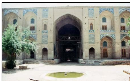
تصویر ۹. نمایی از حیاط کاروانسرا.

حیاط کاروانسرا بشکل هشت ضلعی نامنظم است که در وسط آن حوض هشت گوشه واقع شده و چهار باغچه کوچک با درختچه ها و بوته های سبز اطراف حوض را احاطه کرده‌اند. (تصویر ۹) دورتا دور حیاط حجره های دو طبقه قرار دارد و مقابل هر حجره ایوان کوچکی است. زیر سقف مقعر ایوان با شکل کاربندی و نقوش هندسی ساده نقاشی شده است. در چهار سمت شمال، جنوب، مشرق و مغرب حیاط، چهار سردر با قوس بزرگ واقع شده است که طرفین این سردرها بوسیله پلکان به طبقه دوم و بام راه دارد. لچکی‌های بالای این قوسها و قوس حجره ها کاشیکاری شده است.