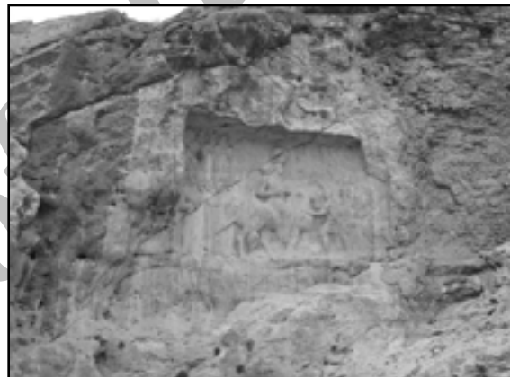
تصویر ۱. نقش برجسته شاپور اول - پادشاه ساسانی - در مجاورت شهر دارابگرد سیدین. ۱۳۸۷

به اعتقاد هوف این شهر که در ابتدا "رام و اشناسکان" نامیده می‌شد، [هوف، ۱۳۷۴: ۴۱۱] بارویی مثلثی شکل داشته؛ لیکن حجاج بن یوسف - که حاکم اموی ایالت پارس بود - در سال ۷۱۴ میلادی (اوایل قرن دوم هجری) حصار شهر را ویران و با الگو برداری از باروی گور، حصاری جدید و دایره شکل را بر گرد دارابگرد می‌سازد [هوف، ۱۳۶۵: ۱۸۰]. احتمالاً از این روست که ابن حوقل [۱۳۶۶: ۴۷] و جیهانی، باروی دارابگرد را جدید و مطابق حصار اردشیرخوره توصیف کرده‌اند [جیهانی، ۱۳۶۸: ۱۱۵].