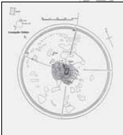
نقشه شماره ۱. نخستین نقشه تهیه شده از دارابگرد Morgan 2003

پیتر مورگان و دیتریش هوف [۱۳۷۴ : ۴۱۴] عرض خندق را در قسمت دروازه غربی شهر حدود ۶۰ م نوشته اند. (Morgan, 2003: 6) آزما این اندازه را ۲۵ متر و عمق خندق را ۱۲ متر نوشته است. [آزما، ۱۳۷۰ : ۱۱۲] فرصت، ۷ - ۶ ذرع ۳۵ را برای عرض خندق ثبت نموده است. [فرصت شیرازی، ۱۳۷۷ : ۱۵۴] ظاهراً تا همین اواخر، روزها تخته پل هایی را برای تردد به شهر بر روی خندق می‌انداخته اند که شبها برای حفظ امنیت بیشتر جمع می گشت ۳۶ [آزما، ۱۳۷۰ : ۱۱۳]. (نقشه شماره ۱)