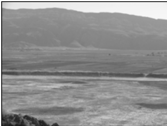
تصویر ۲. باروی شهر از فراز ارگ حکومتی کریمیان. ۱۳۸۷

شیرازی، ۱۳۷۷: ۱۵۳؛ جغرافیا و اسامی دهات کشور، ۱۳۲۹: ۲۹۰؛ حسینی فسایی، ۱۳۶۷: ۱۳۱۱] و میزان گردی آنرا به حدی قابل توجه یافته اند که ساخت آنرا به رسم دایره ای با پرگار تشبیه کرده‌اند [ابن بلخی ۱۳۷۴: ۳۰۹؛ مستوفی قزوینی ۱۳۶۲: ۱۳۹؛ حسینی فسایی ۱۳۶۷: ۱۳۱۱]. (تصویر ۲) منابع تاریخی طول این بارو را در حدود یک فرسخ یا شش کیلومتر، نوشته اند [جغرافیا و اسامی دهات کشور، ۱۳۲۹: ۲۹۰؛ حسینی فسایی، ۱۳۶۷: ۱۳۱۱؛ فرصت شیرازی، ۱۳۷۷: ۱۵۴؛ آزما، ۱۳۷۰: ۱۱۲]. در حالی که فرصت، ارتفاع بیرونی بارو را حدوداً پنج ذرع و ارتفاع درونی را تقریباً سه ذرع نوشته ۳۷ ؛ [فرصت شیرازی ۱۳۷۷: ۱۵۴] ابوت (Keith Abbot)، ارتفاع آنرا ۴۰ - ۳۵ پا و پریس (Preece) آنرا ۲۰ پا ۳۸ به حساب آورده است [شواتس ۱۳۷۲: ۱۳۰]. مورگان تنها فردی است که ارتفاع درونی بارو را ۱۰ متر درج و اندازه عرض پایه آنرا برابر با ۲۲ متر نگاهشته است. [Morgan, 2003: 6] در حالی که هوف قطر باروی دارابگرد را تقریباً با شهر اردشیرخوره برابر و حدود دو کیلومتر نوشته، [هوف، ۱۳۷۴: ۴۱۳] ابوت قطر باروی گور، و پریس قطر باروی دارابگرد را حدود یک میل ذکر کرده‌اند ۳۹ [شواتس، ۱۳۷۲: ۸۷]. ابن حوقل نیز وسعت دارابگرد را به اندازه اردشیرخوره و بیشاپور می‌داند [ابن حوقل، ۱۳۶۶: ۴۸].