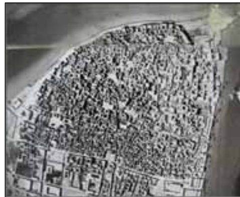
تصاویر ۳ و ۴. عکس هوایی ۱۳۳۵ و دید کلی بافت بوشهر.