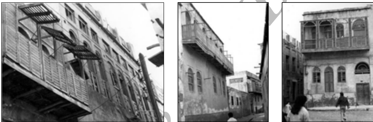
تصاویر ۱۴، ۱۵ و ۱۶. انواع شناشیر.

به جای نرده‌های چوبی یا فلزی شناشیر، از بازشوها و جداره‌های چوبی ثابت مثل کرکره، نیز استفاده شده که این جداره‌های مشبک، گذر نسیم را میسر کرده بدون آنکه از بیرون، فضای داخل دیده شود همچنین مانع خوبی در برابر تابش مستقیم آفتاب بوده است. بعضی از کرکره‌ها متحرک است و رو به بیرون باز می‌شود. شناشیر به دو صورت مسقف و بی‌سقف ساخته شده است که در نوع سقف‌دار، پوشش بر روی ستون‌های کم‌قطر چهار تراش تکیه می‌کند. پوشش چوبی یا به صورت پیوسته بر روی کل آن و یا به شکل غیر پیوسته و فقط روی بازشوهای اتاق‌ها قرار گرفته است. ابعاد شناشیر از دو یا سه متر تا حدود بیست متر متغیر است. شناشیر در یک یا دو جبهه بیرونی و در یک تا چهار جبهه داخلی قرار گرفته است. کاربرد چوب‌های چهار تراش، نرده (معجر) چوبی و فلزی زیبا، کرکری‌های و گلپاهای چوبی و فلزی پرکار و آویزان در زیر آن، زیبایی خاصی به آن داده است. شناشیر را می‌توان تلاش فضاهای خصوصی جهت استفاده بیشتر از جریان باد فضاهای عمومی بافت دانست. به نوعی می‌توان گفت شناشیر، یک درهم‌تنیدگی پیوسته فضای عمومی و خصوصی در استفاده از باد را فراهم آورده و این عملکرد اقلیمی زندگی عمومی را به زندگی خصوصی پیوند می‌زند.