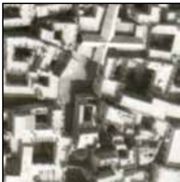
تصویر ۱۰. قرارگیری ساختمان بلند در کنار ساختمان‌های کوتاه و فرم شکسته میدان دهدشتی. مأخذ : انتخاب نگارندگان از عکس هوایی ۱۳۴۵.

بدنه فضاهای عمومی نیز متناسب با جریان باد شکل می‌گیرد؛ به گونه‌ای که بافت قدیم بوشهر بیشترین بازشوها به سمت بیرون را دارد. بازشوها در سطوح مختلف با فرم‌های متنوع شکل می‌گیرد و علاوه بر کارکرد اقلیمی، بر تنوع بصری فضاهای شهری نیز اثر می‌گذارد. علاوه بر بازشوها، عناصری خاص نظیر شناسیر و طارمه نیز متناسب با استفاده بهتر از سایه و باد در بدنه فضاهای شهری شکل گرفته است [رنجبر، ۱۳۸۶: ۱۳۶-۱۳۰].