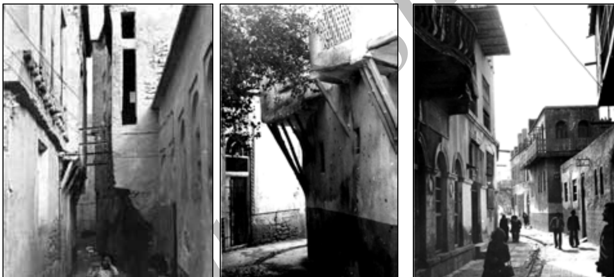
تصاویر ۵، ۶ و ۷. معابر و نمونه پیش‌آمدگی‌ها.

کوران هوا علاوه بر پایین آوردن رطوبت معابر و ایجاد آسایش حرارتی، رطوبت دیوارهای دو طرف کوچه را نیز جذب می‌کند. با خشک شدن این دیوارها به دلیل استفاده از مصالح ساختمانی بومی یعنی سنگ‌های متخلخل دریایی، رطوبت فضای داخلی نیز جذب می‌شود. در واقع با ایجاد کوران در معابر، قسمتی از رطوبت فضای داخلی از طریق دیوار به بیرون هدایت می‌شود.