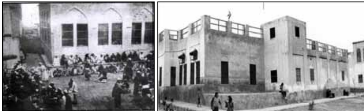
تصاویر ۸ و ۹. مبلمان در بدنه فضاهای شهری و نمونه جانپناه و بون در خط آسمان : میدان کوتی و دهدشتی.

نکته مهم دیگر در طراحی همزمان این فضاها، همزمان با ملاحظات اقلیمی، توجه به حضور مردم در فضا و فراهم آوردن مبلمان نشستن به عنوان جزئی از بدنه فضاست. دو عکس باقیمانده از مرکز محله‌های دهدشتی و کوتی این موضوع را به طور بارز نمایش می‌دهد. ۳۱