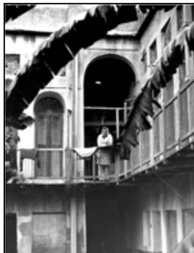
تصاویر ۱۱، ۱۲ و ۱۳. انواع طارمه.