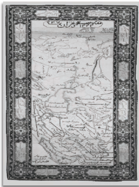
تصویر ۱۱. قالی تصویری نقشه ایران، تهران، ۱۳۴۴/۱۹۲۵، موزه فرش ایران، ۱۶۸ × ۱۰۵.

Fig11. Pictorial carpet of Astrolabe.