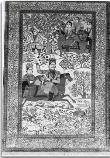
تصویر ۶. قالی تصویری بهرام گور و آزاده، تبریز، اواخر سده سیزدهم/ نوزدهم، موزه فرش ایران، ۲۰۴ × ۱۲۷. Fig6. Pictorial carpet of Bahram-e Gur and Azadeh.