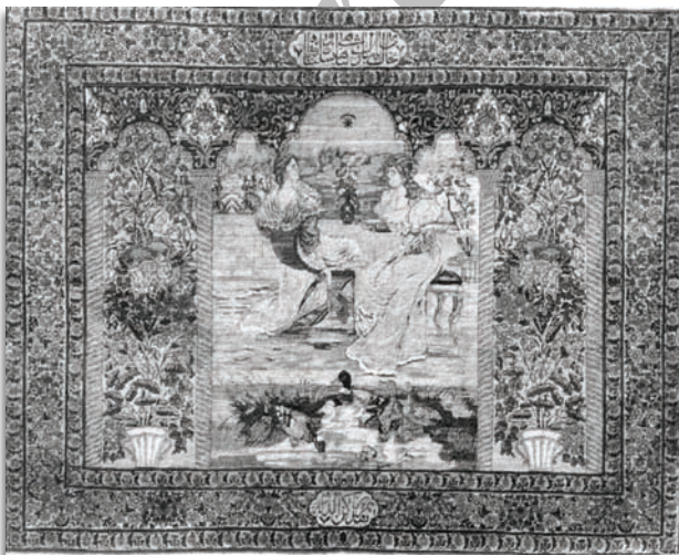
تصویر ۳. قالی تصویری دورنمای اروپایی، کرمان، ۱۳۲۴/۱۹۰۶، موزه فرش ایران، ۲۰۵ × ۱۳۲، مأخذ: آرشیو موزه فرش ایران.

که در موزه فرش ایران نگهداری می‌شود جنگجوی مذکور، رهبر گل‌ها ۱۳ در جنگ بر علیه ارتش روم به رهبری ژولیوس سزار بوده است. طغیان این جنگجوی فرانسوی اغلب به عنوان مثال قهرمانی ملی گل‌ها و مظهر اراده و پایداری آنها مطرح می‌شود [کشاورز افشار، ۱۳۸۷: ۷۲]. اما به کار رفتن آن در یک قالی ایرانی، جای بسی شگفتی است و این احتمال را تقویت می‌کند که طرح قالی برگرفته از عکس یا تصویر چاپی باشد. زمینه بیضی شکل قالی تصویر ۴، دورنمایی از یک منظره اروپایی با پرتره‌های متعدد است و احتمالاً از روی یک عکس یا کارت پستال بافته شده است. در اطراف متن، طرح مشهور سبزی‌کار کرمان به کار رفته است. این قالی در سال ۱۳۲۴/۱۹۰۶، مقارن با اولین سال سلطنت محمد علی شاه و به دستور فرمانفرما بافته شده است. نمونه مشابه این قالی در موزه ویکتوریا و آلبرت لندن نگهداری می‌شود [Ford, 1989: 16].