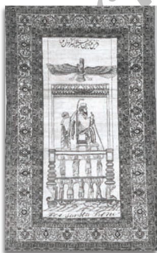
تصویر ۹. قالی تصویری خشایار شاه، کرمان، اواخر سده سیزدهم / نوزدهم، موزه فرش ایران، ۲۰۲ × ۱۳۵.

توجه به مظاهر فرهنگ و تمدن ایران باستان و دوران صفویه که دو دوره و مقطع بزرگ و افتخار آفرین در تاریخ ایران به شمار می‌رود، رویکرد سیاسی دولت قاجار را تشکیل می‌دهد که تجلی این رویکرد در آثار هنری به خوبی مشهود است. ۲۱ در حقیقت، تأکید هنر قاجار بر موضوعات مرسوم در هنر ایران باستان، به منظور برابر نهادن اقتدار سیاسی شاهان قاجار با اقتدار سیاسی شاهان باستانی ایران و مشروعیت بخشیدن به قدرت حاکم بوده است [آژند، ۱۳۸۵: ۴۱]. "شاهان قاجار با کشیدن این تصاویر می‌خواستند، اعتبار سیاسی و فرهنگی خود را به جهان باستانی ایران گره بزنند و به تقویت مشروعیت حکومتی خود بپردازند" [همان: ۳۸] تا بدین وسیله حکومت خود را همپایه و در ردیف حکومت‌های مقتدر تاریخ ایران قرار دهند. از این رو، در قالی‌های این دوره، شاهد نقوش باستانی، به خصوص، تصویری از صحنه‌های مربوط به تخت جمشید از دوران هخامنشیان هستیم. یکی از این صحنه‌ها که در قالیچه‌ای به فرمایش عبدالحسین فرمانفرما، حاکم کرمان بافته شده است، خشایار شاه را بر تخت نشان می‌دهد که از نقش برجسته درگاه جنوبی تالار صد ستون، کاخ پذیرایی خشایار شاه، اقتباس شده است (تصویر ۹). در این نقش، خشایار شاه روی صندلی زرین نشسته و خدمتگزاری پشت سر او دیده می‌شود. در بالای سر شاه، علاوه بر دو ردیف شیر و گاوهای کوهی، تصویر فروهر نیز به شکل تأکید یافته‌ای نقش شده است. در نقش برجسته مذکور، زیر تخت شاه، چهارده نفر در سه ردیف ترسیم شده‌اند که البته در این قالیچه، تنها دو ردیف از آن‌ها به تصویر درآمده است. هر کدام از این افراد، نماینده یکی از کشورهای تحت متابعت شاهنشاهی هخامنشی است [تناولی، ۱۳۶۸: ۳۹].