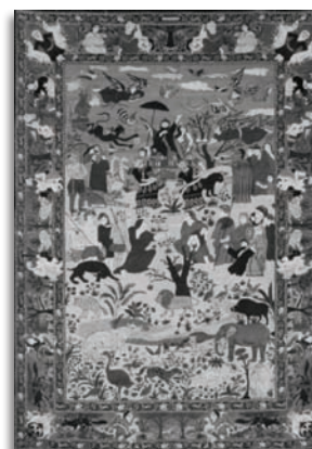
تصویر ۸. قالی تصویری داوری حضرت سلیمان، کاشان، سده چهاردهم / بیستم، موزه فرش ایران، ۳۶۳ × ۲۵۹.

Fig8. pictorial carpet of Solomon's Judgment.