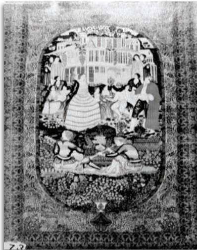
تصویر ۴. قالی تصویری بزم اروپایی، کرمان، اوایل سده چهاردهم/ بیستم، موزه فرش ایران، ۱۰۱ × ۸۱، مأخذ: دادگر، ۱۳۸۰ الف: ۱۶.

Fig4. Pictorial carpet of European shindig. Source: Dadgar, 2001a: 16.