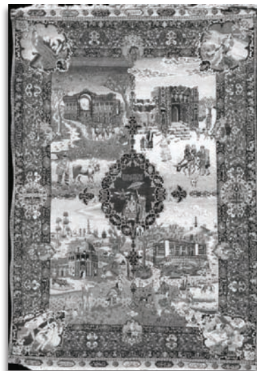
تصویر ۱۰. قالی تصویری چهار فصل، تبریز، ربع اول سده چهاردهم/ بیستم، موزه فرش ایران، ۲۸۹ × ۲۲۰. مأخذ: دادگر، ۱۳۸۰ الف ۱۰۰.

Fig11. Pictorial carpet of Astrolabe. Source: archive of carpet museum of Iran.