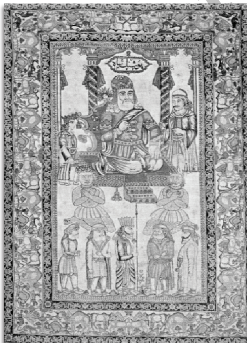
تصویر ۱. قالی تصویری هوشنگ‌شاه، کرمان، ۱۳۲۲/۱۹۰۴، موزه فرش ایران، ۲۰۰ × ۱۳۳. مأخذ: دادگر، ۱۳۸۰ الف: ۳.

با مشاهده و بررسی قالی‌های تصویری این دوران، می‌بینیم که نه تنها تصاویر شاهان قاجار همچون فتحعلی شاه، ناصرالدین شاه، محمدعلی شاه و احمد شاه، بلکه دیگر پادشاهان تاریخ ایران از هوشنگ شاه گرفته که به روایت شاهنامه، مؤسس اولین سلسله پادشاهی در ایران است، تا خشایار شاه، شاپور اول، شاه عباس و نادر شاه نیز در این این