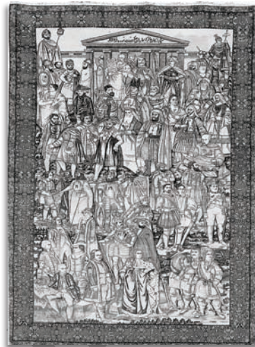
تصویر ۲. قالی تصویری مشاهیر، کرمان، ۱۳۳۷/۱۹۱۸، موزه فرش ایران، ۲۷۳ × ۱۶۵، مأخذ: دادگر، ۱۳۸۰ ب: ۱۳۱.

Fig3. Pictorial carpet of French warrior. Source: archive of carpet museum of Iran.