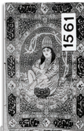
تصویر ۷. قالی تصویری نور علیشاه، کرمان، اواخر سده سیزدهم / نوزدهم، موزه فرش ایران، ۶۱ × ۹۰ (عدد ۱۵۶۱ در این تصویر، شماره کد عکس در آلبوم موزه است).

Fig9. pictorial carpet of Khashayar Shah.