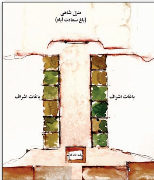
تصویر ۱. پلان محدوده خیابان برگرفته از توصیفات عبدی بیگ و سیاحان خارجی.

صفوی ترسیم کنیم. تصویری که مقایسه آن با فضای خیابان در باغ سعادت آباد که عبدی بیگ در توصیف باغ هم زمان به صورت ویژه به آنها می‌پردازد و همچنین قرار دادن این تصویر بازنمایی شده در کنار تصاویر و تفصیلات از خیابان در باغ ایرانی که قدمتی چند هزار ساله دارد، نتایج قابل توجهی را به دست می‌دهد.