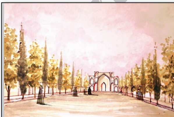
تصویر ۲. بازنمایی منظر خیابان بر اساس اشعار عبدی بیگ. مأخذ: آل‌هاشمی، مجتهدی و روح‌نیا، ۱۳۸۸.

Fig1. The construction plan of Khyaban at the time of construction based on poems of Abdi Beyk and the descriptions provided by Europeans visiting this venue. Source: Author, 2010.