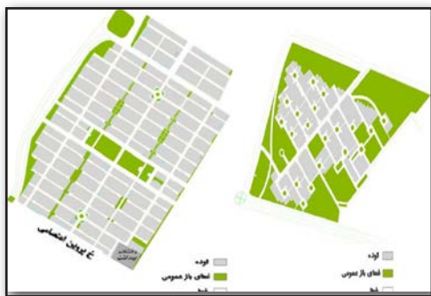
تصویر ۲. تصویر راست: فضاهای باز و ساخته شده کوی علوم پایه در یک تفکیک دوربرگردان. تصویر چپ: فضاهای باز و ساخته شده کوی انصاریه در یک تفکیک ترکیبی. Fig 2. Right-open and built spaces in Olom Paye neighborhood in a cul-de-sac pattern-Left: open and built spaces in Ansariye neighborhood in a grid-cul-de-sac pattern.

نمودار ۲. راست: جایگاه تفکیک اراضی در طرح‌های گسترش موفق جهانی. چپ: جایگاه تفکیک اراضی در گسترش‌های شهری در ایران.