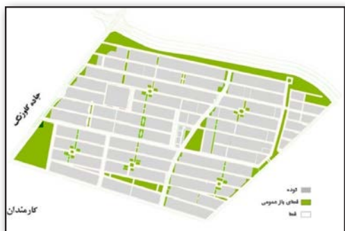
تصویر ۱. فضاهای باز و ساخته شده کوی کارمندان در یک تفکیک شطرنجی. Fig1. Open and built spaces in Karmandan neighborhood in a grid pattern.