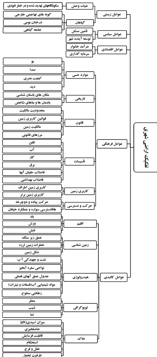
Diagram 1. Influential factors in urban land subdivision in successful global examples. Source: Authors, 2011.

مسکونی است؛ در حالی که براساس دیدگاهی که در اینجا مورد بحث قرار گرفت، باید آن را مفهومی فراتر از مفهوم یاد شده تلقی کرد (نمودار ۲).