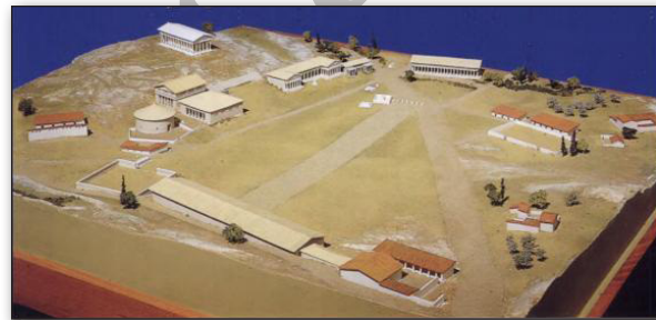
تصویر ۲. مدل آگورا در ۴۰۰ ق.م از ضلع جنوب شرقی. مأخذ: Lang, 2004: 4. Fig. 2. Model of the Agora in 400 B.C from the southeast wing. Source: Lang, 2004: 4.

از آنجایی که دوره کلاسیک از مهم‌ترین ادوار استفاده از این فضای بسیار کلیدی در آتن است، در ادامه به توصیف بناهای این دوره بر پیرامون آن (تصویر ۲ و ۳) پرداخته شده است.