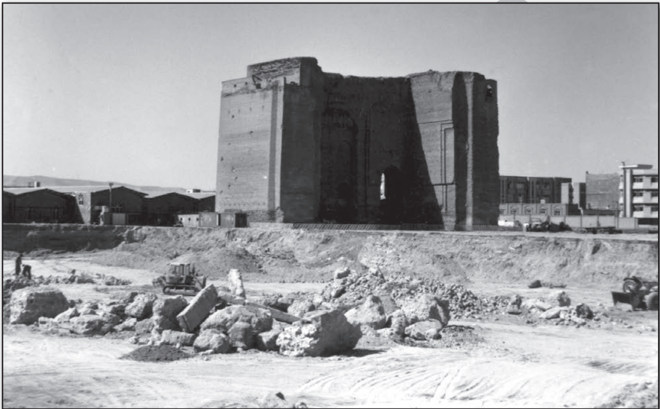
تصویر ۱۰. تخریب حریم شرقی ارک تبریز در سال ۱۳۷۶ ه.ش.

۳) در سال ۱۳۶۰ ه.ش. بخش شمالی دیوارهای عهد ایلخانی ارک علی شاه، مضاف بر پلکان قاجاری متصل به جبهه شرقی آن، با هدف ساخت سازه‌های جدید، تخریب شدند (خیری و صدرایی، ۱۳۸۱).