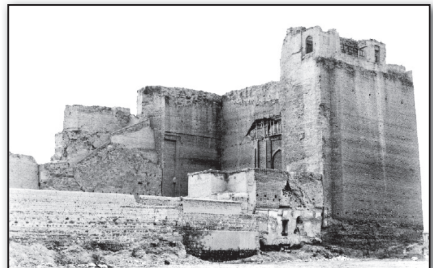
Fig. 11. The final remains of the Qajarid walls in the Arch of Alishah in Tabriz that were destroyed in 1971.

تصویر ۱۱. واپسین بازمانده‌های باروی عهد قاجاری ارک تبریز که در سال ۱۳۵۰ ه.ش. تخریب شد.