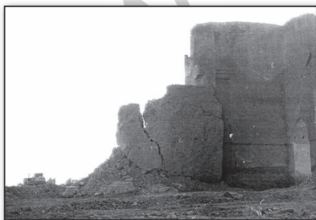
تصویر ۹. تخریب دیوار شرقی جبهه شمالی ارک تبریز در سال ۱۳۶۰ ه.ش. Fig. 9. Destruction of the eastern wall situated in the northern façade of the Arch of Alishah in Tabriz in 1981.