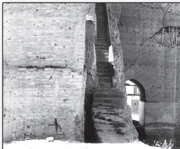
تصویر ۵. گوشه شمال شرقی ارک تبریز: پلکان عهد قاجاری که در سال ۱۳۶۰ ه. ش. تخریب شد. Fig. 5. The northeastern corner in the Arch of Alishah in Tabriz: the Qajarid staircase which had been destroyed in 1981.

پهلوی اول از باستان‌گرایی و نیز الگوهای غربی تأثیر پذیرفت (سهیلی و دیبا، ۱۳۸۹).