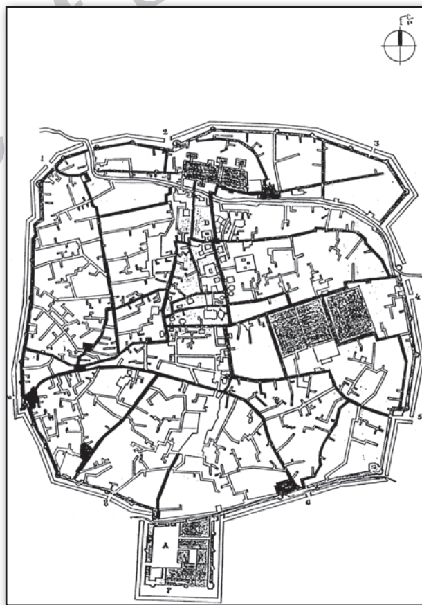
تصویر ۱. موقعیت ارک تبریز نسبت به سور و حصار شهر در اواخر عهد قاجاریه. Fig. 1. The setting of the Arch of Alishah in Tabriz in connection with the city walls and bastions of Tabriz by the end of Qajarid era.