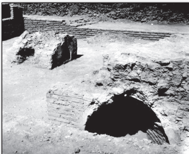
تصویر ۶. جبهه شمالی ارک تبریز: بازمانده کوره‌های آهنگری در کارگاه توپ‌ریزی عهد قاجار که در کاوش‌های سال ۱۳۵۰ ه. ش. آقای سرفراز خاکبرداری شدند. Fig. 6. The northern corner in the Arch of Alishah in Tabriz: the architectural remains of Qajarid blacksmith kilns deployed for artillery manufacturing; all unearthed by A. Sarfaraz's excavations in 1971.