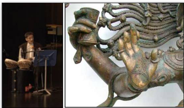
تصویر ۴. تطبیق طبل نوازی شیوا و قدم‌نوازی مراسم سماع.

کاسه‌های آن چون ساعت شنی به هم چسبیده نیست. اما از نظر مضمون کاملاً شبیه هم هستند و هر دو بر نوای آفرینش و خلقت دلالت دارند. تفاوت در ظاهر نمادگرایی مرگ و قیامت (مردن و دوباره زنده شدن) است که در رقص شیوا با شعله آتش نمادپردازی شده در حالی که همین مفهوم را در مراسم سماع در نی‌نوازی شاهد هستیم (تصویر ۴).