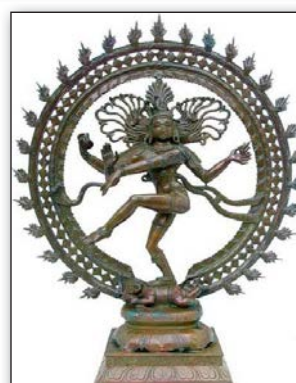
تصویر ۲. شمایل رقص کیهانی شیوا.

Drawing: Adelvand Padideh From the descriptions of knights and Gerber, 2003.