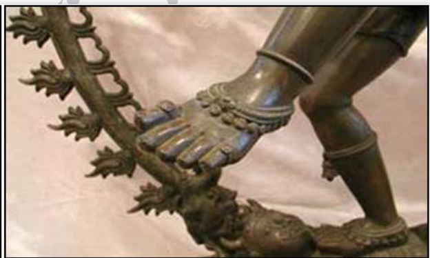
تصویر ۵: تطبیق پای کوبی درویشان در مراسم سماع با پای کوبی شیوا در رقص نداننا. مأخذ راست: www.lotussculpture.com چپ: www.whirlingdervishes.org Fig. 5. Matching of Dervishes hoofing in whirling dance with ritual dance of Shiva. Right Source: www.lotussculpture.com Left: www.whirlingdervishes.org.