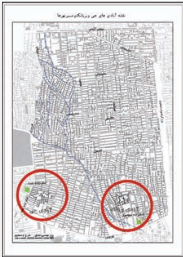
تصویر ۴. موقعیت روستای بریانک و جی در منطقه ۱۰ شهر تهران. مأخذ: مهندسین مشاور طرح و معماری.