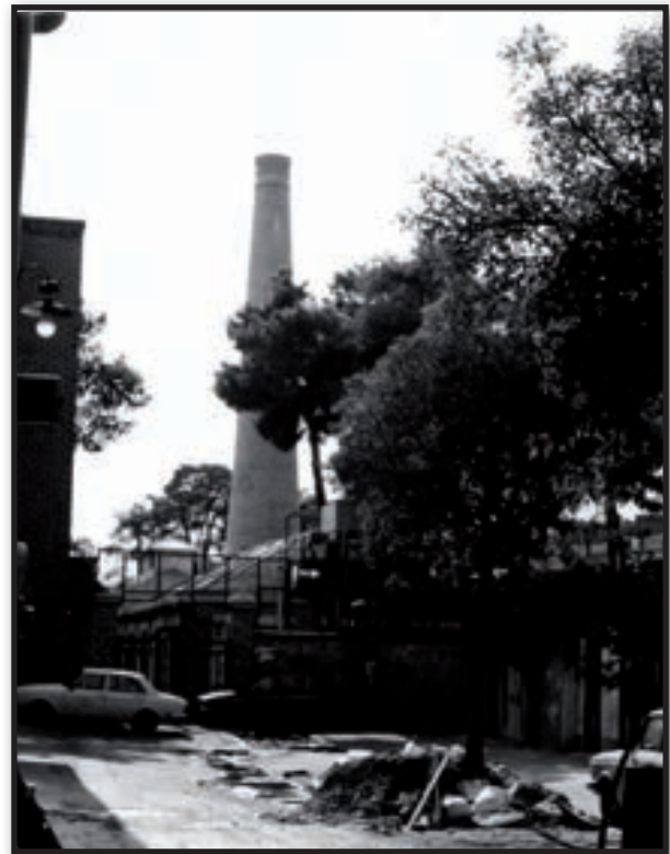
تصویر ۵. کارخانه جوراب‌بافی (موزه هفت‌چنار).

Map 1. Deteriorated fabric Approved by High Council of Urban Planning and Architecture.