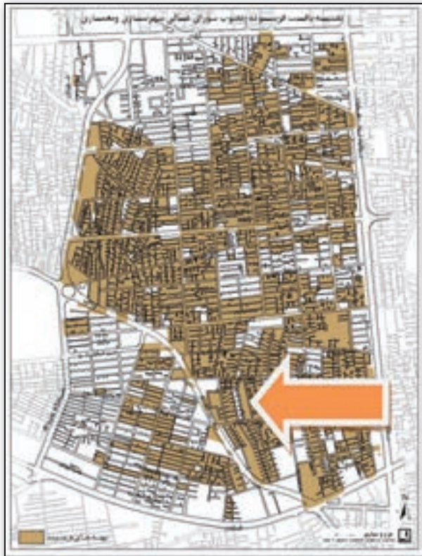
نقشه ۱. بافت فرسوده مصوب شورای عالی شهرسازی و معماری منطقه ۱۰.

مشکلات ترافیکی ناشی از عدم وجود هماهنگی میان گذرهای باریک و قدیمی، با مقتضیات امروز شهر تهران، مشکلات زیست‌محیطی ناشی از عدم وجود سیستم‌های مناسب دفع آب‌های سطحی و عدم امکان خدمت‌رسانی به تمامی نقاط بافت به علت