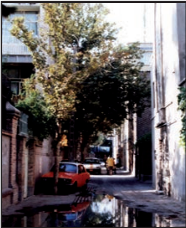
تصویر ۶ مجموعه تصاویر داخلی بافت فرسوده محله هفت‌چنار که همگی معرف معابر باریک و بافت مسکونی فشرده و ناسامانی‌های کالبدی‌اند. Fig. 6. Interior picture of deteriorated fabric "Haft Chenar".

و این امر به فرسودگی اجتماعی محله دامن زد. وجود تفاوت‌های فرهنگی در بین این گروه‌ها نارسایی اجتماعی را افزایش داده است گسترش نارسایی‌های اجتماعی موجب کاهش امنیت سکونت شده و این امر مانع ورود جمعیت توانمند از نظر فرهنگی و اقتصادی به محله و همچنین موجب خروج جمعیت ساکن در محله با افزایش توان اقتصادی می‌شود. این موضوع نیز بر بسط و دوام فرسودگی دامن می‌زند.