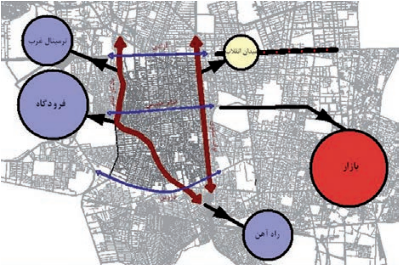
Fig. 2. Location of District 10 of Tehran.

تصویر ۲. موقعیت منطقه ۱۰ در شهر تهران.