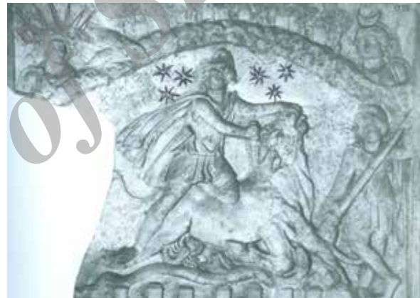
تصویر ۱۲. نقش ستارگان و نمادهای ماه و خورشید به شکل انسانی (نیم تنه) بر گنبد آسمان. مهرباب اسکویلین، نزدیک کلیسای سن لوچیا در سلسی. واتیکان موزه چپارامونتی.