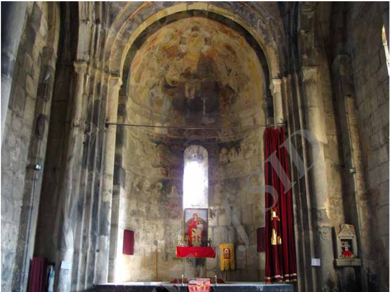
تصویر ۸. آتشدان یا مذبح که در مه‌راب کلیسا تبدیل به میز و جایگاه مقام مذهبی شده است. صومعه حق پات، ارمنستان. عکس: منصور، ۱۳۹۲.