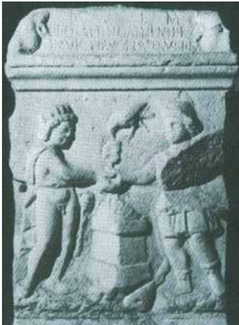
تصویر ۱۰. کلاغ تکه گوشت قربانی را روی مذبح روشن می گذارد. مأخذ: مرکلیاخ، ۱۳۸۷: ۴۱۸. Fig.10. A crow puts a piece of sacrificial meat on the altar. Source: Merkel Bach, 2008: 418.