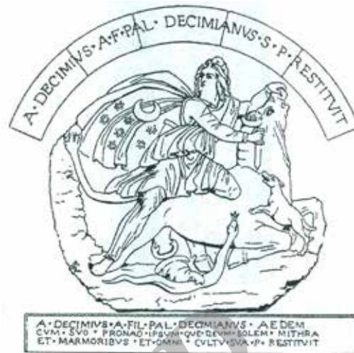
تصویر ۹. نقش ماه و ستاره بر شتل لاجوردی مهر.