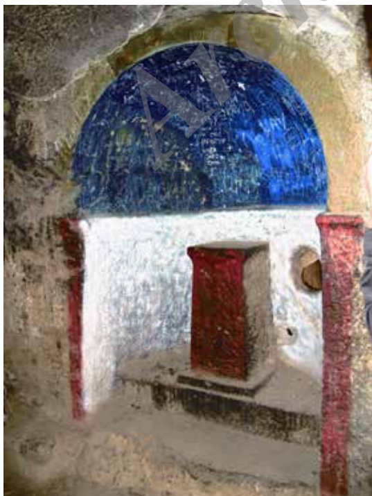
Fig. 5. Armenian inscriptions. The figures of cross, lion, eagle, sun and stars as symbolic figures in the Mithraism and Christianity. The victory of lion on cow as a symbol of triumph of summer over the winter. Photo: Ehsan Dizani, 2013.

سرخ نماد خون و حیات و کنایه از خون مقدس گاو است که به دست میترا قربانی شده و عامل باروری و حیات در آفرینش (انسان، حیوان و گیاه) و همچنین کنایه از سرخی خورشید بوده است. در مسیحیت شراب سرخ کنایه از خون مسیح (ع) است. رنگ سرخ ارغوانی و آبی لاجوردی در مهرابه‌های اروپا برای شنل مهر به کار رفته و گاه شلوار میترا به رنگ سرخ است (ثاقب‌فر، ۱۳۸۵ : ۳۲۸ و ۹۵). رنگ سفید نماد کمال متعالی، نور، پاکی، تقدس، نجات و اقتدار معنوی است، سفید رنگ عشق و زندگی و هم رنگ مرگ و تدفین است (کوپر، ۱۳۷۹ : ۱۶۹). در شماری از مهرابه‌های اروپا شنل مهر به رنگ قرمز ارغوانی