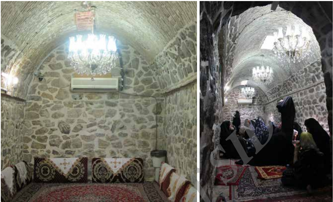
تصویر ۲. زیارتگاه بی بی شهربانو، شهر ری.