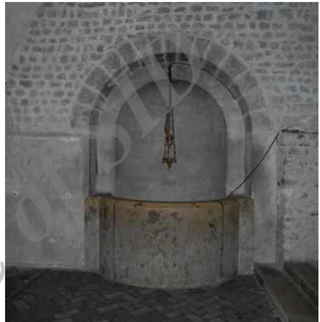
تصویر ۱-۲. چاه آب، تعمیدگاه کلیسای شارتر- فرانسه. عکس: محمد آتشین‌بار، ۱۳۸۶.

1-1. Trough in the nave of San Vitale cathedral, Ravenna, Italy. Photo: M. Atashinbar, 2007.