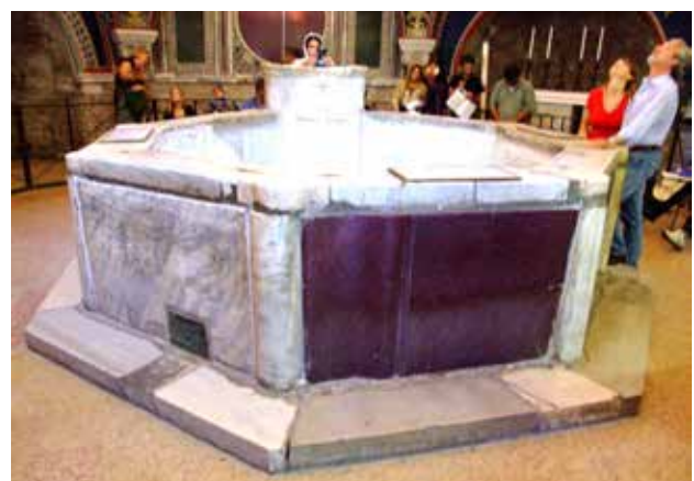
تصویر ۱-۳ و ۱-۴. سنگاب‌ها در تعمیدگاه کلیسای سن ویتاله، راونا- ایتالیا. عکس: محمد آتشین‌بار، ۱۳۸۶.

1-3, 1-4. Water wells in Chaters cathedral, France. Photo: M. Atashinbar, 2007.