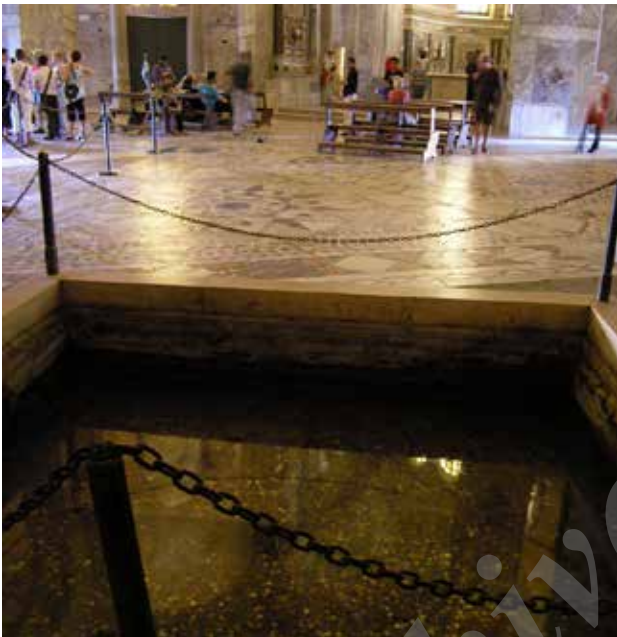
تصویر ۱-۱. حوض آب، شبستان کلیسای سن ویتاله، راونا- ایتالیا. ۱۳۸۶.

تالارهایی در طبقه اول است. امروز بخش اصلی و فعال کلیسا طبقه هم‌کف است که با ورودی از سمت غرب به تالارهای عظیم و ستون‌دار می‌رسد که از پنجره سمت شرق نور می‌گیرد و از گوشه سمت مقابل پلکانی به طبقه بالا می‌رود. بر دیوارهای مقابل و طرفین ورودی شبستان خصوصی، مهراب‌هایی تزئینی بر دیوار جای گرفته‌اند. انتهای شبستان خصوصی که محل عبادت و اجرای مراسم جمعی است، شاه‌نشین و مهراب روی سکو و با ارتفاع بالاتر از کف در جهت شرق واقع شده‌اند. الگوی معابد مهری و بازلیک‌ها