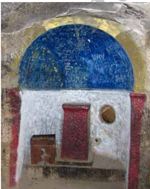
Fig. 8. Mehrib hearth or altar in the church was converted into a table and place of religious authority. Hqpat stern silo, Armenia. Photo: Mansouri, 2013.

است و به سقف مه‌راب رنگ آبی با نقش خورشید، ماه و ستارگان و علایم صور فلکی به رنگ‌های سفید و طلایی نقش بسته‌اند (تصویر ۹). همین رنگ‌ها بعداً در لباس روحانیون مسیحی و تزیینات معماری کلیساها وارد شده‌اند (تصاویر ۱۰ تا ۱۲). از طرفی دیگر این رنگ‌ها در عرفان میتراپی، زرتشتی، مسیحی و اسلامی نیز جایگاه ویژه‌ای یافته‌اند.