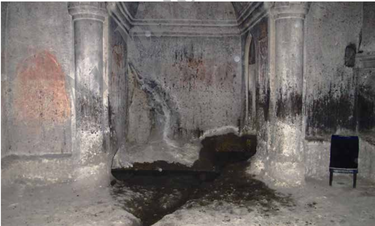
تصویر ۳. چشمه آب در شبستان غاری و جوی منشعب از آن. کلیسای گنارد-ارمنستان. عکس: منصورى، ۱۳۹۲.