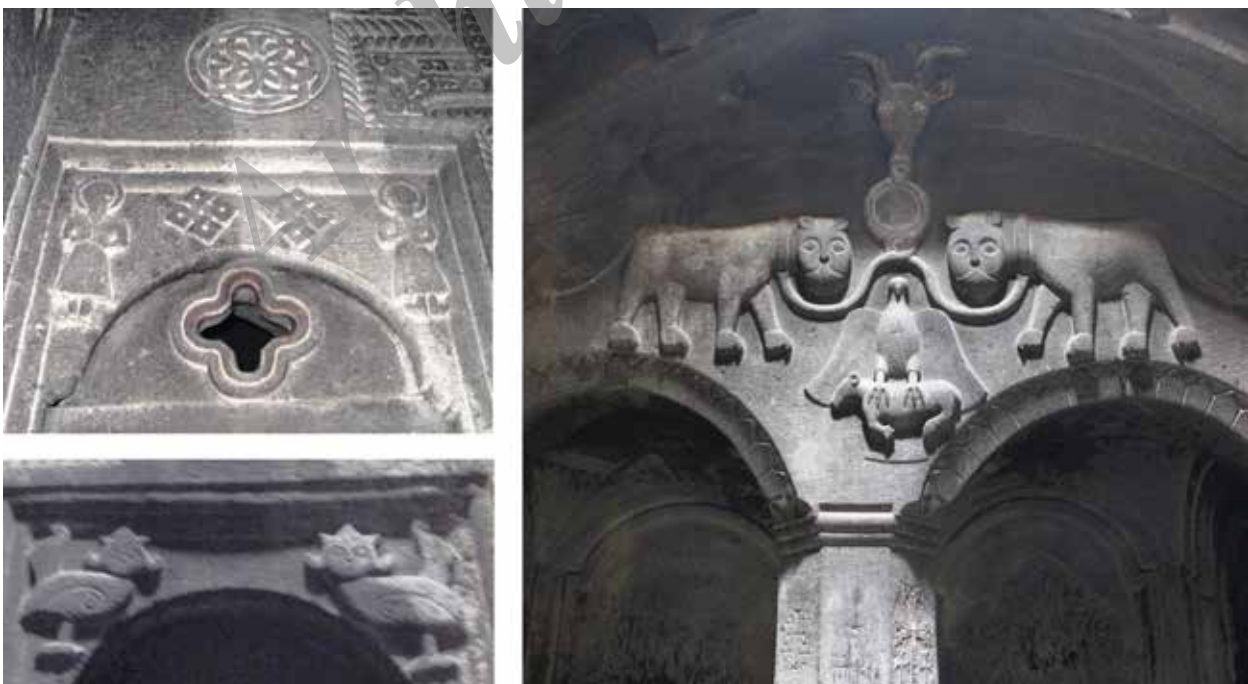
تصویر ۴. نقش شیر، گاو، عقاب و قوچ - پرند با سر انسان شبیه به عناصر ترکیبی دوره قاجار - نقش‌های هندسی چلیپا، خورشید و انسان.

معابد صخره‌ای غاری که گرداگرد کلیسای اصلی گنارد را فرا گرفته‌اند مکان‌هایی کوچک، مخفی و صعب‌العبور در دل صخره‌های بلند هستند که به نظر می‌رسد جایگاه عبادت، تزکیه و ریاضت مهرپرستان و سپس راهبان مسیحی بوده است. نقش‌هایی نمادین مربوط به باورهای میترای و مسیحی بر پیشانی صخره‌ها و اطراف ورودی غار معبدها دیده می‌شود که شامل نقش صلیب، خورشید، پرند، شیر و کتیبه‌های ارمنی است. این علائم و صلیب‌هایی که