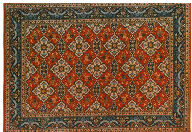
تصویر ۹. قالی با طرح تال و خونچه.