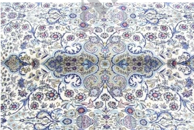
تصویر ۷. نمونه امروزی قالی امیر جنگی، مجموعه آقای علی مُندگاری.

"این قالی معمولاً در هفت‌رنگ، لاجوردی یا سرمه‌ای، لاکه، کرم یا سفید قهوه‌ای، دارچینی و فیروزه‌ای بافته شده است. فیروزه‌ای از رنگ‌های مهم قدیمی بوده که بعدها منسوخ شد. این قالی معمولاً در