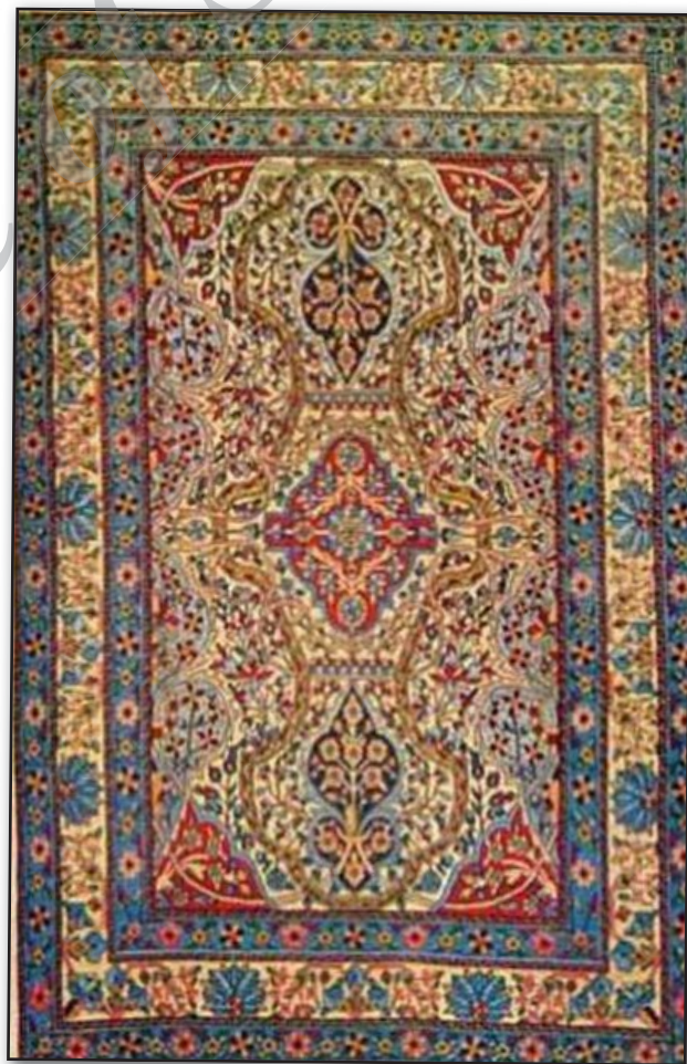
تصویر ۲. قالی ترنج‌دار، محل بافت: یزد.