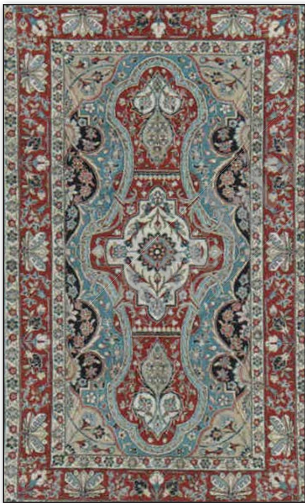
تصویر ۳. قالی ترنج‌دار، از مجموعه قالی‌های احیاء شده در یزد.

نقش ماهی و گل هشت‌پر از مهم‌ترین و پرکاربردترین نقوش به کار رفته در هنرهای بومی یزد به ویژه هنر سفالگری، زیلوبافی و النگوسازی به شمار می‌روند. به نظر نگارنده ثابت بودن رنگ سرمه‌ای برای زمینه این قالی، نشانی از آب برای حیات ماهیان است. کمبود آب، باران‌خواهی و تأکید بر تکرار آن به واسطه واگیرهای بودن طرح و در نهایت حضور این قالی زیر پای نمازگزاران