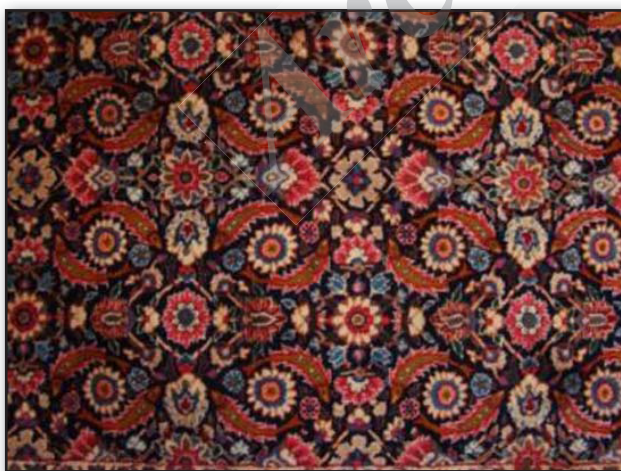
تصویر ۱. قالی دستباف یزد با طرح هراتی، موجود در مسجد تاریخی نظرکرده یزد عکس: منیره عطرگیران.

در برخی قالی‌ها، مانند آنچه در تصویر ۱ مشاهده می‌شود، بافنده تلاشی برای پنهان کردن نقش ماهی نداشته و حتی با نشان دادن آن به رنگ قرمز و ایجاد تالو با رنگ سفید در فلس‌های آن، به نقش ماهی تأکید ورزیده است. در میان دو ماهی گلی با ۱۶ پر وجود دارد که این ویژگی در نمونه‌های دیگر موجود در یزد دیده نشد.