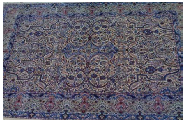
تصویر ۶. قالی با طرح امیرجنگی موجود در اتحادیهٔ قالی دستباف استان یزد.

Fig.7. Modern sample of carpet with "Amir-e Jangi" pattern.