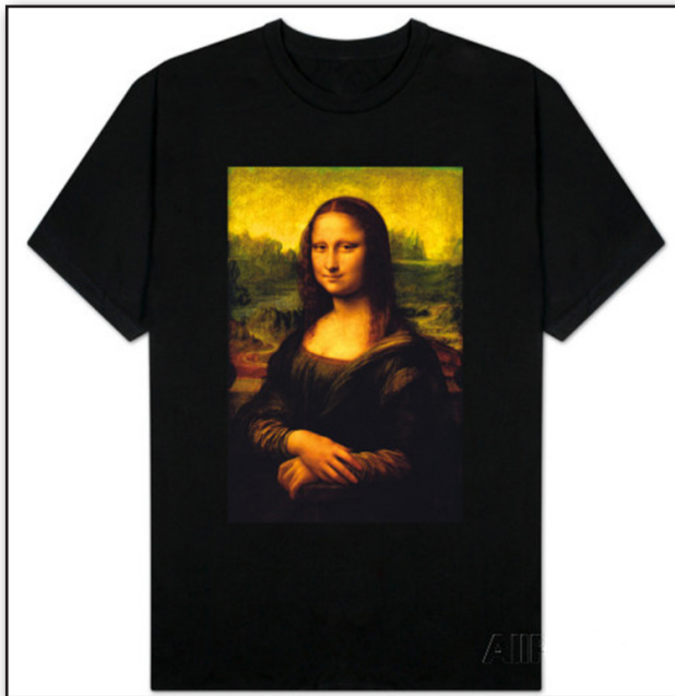
تصویر ۱. استفاده از تصویر هنری (مونالیزا) جهت فروش کالا.