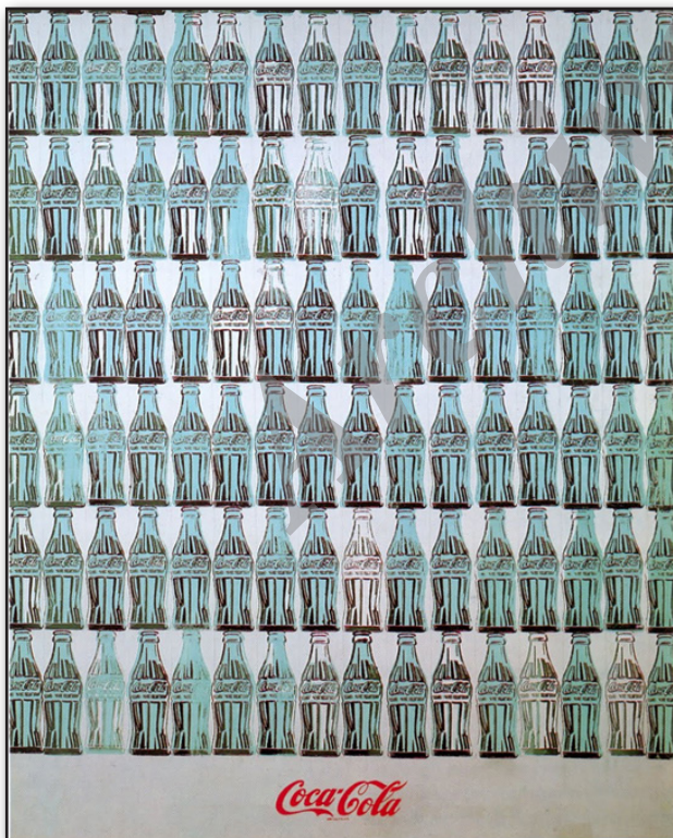
تصویر ۲. اندی وارهل، بطری‌های سبزرنگ کوکاکولا، ۱۹۶۱، رنگ روغن روی بوم.