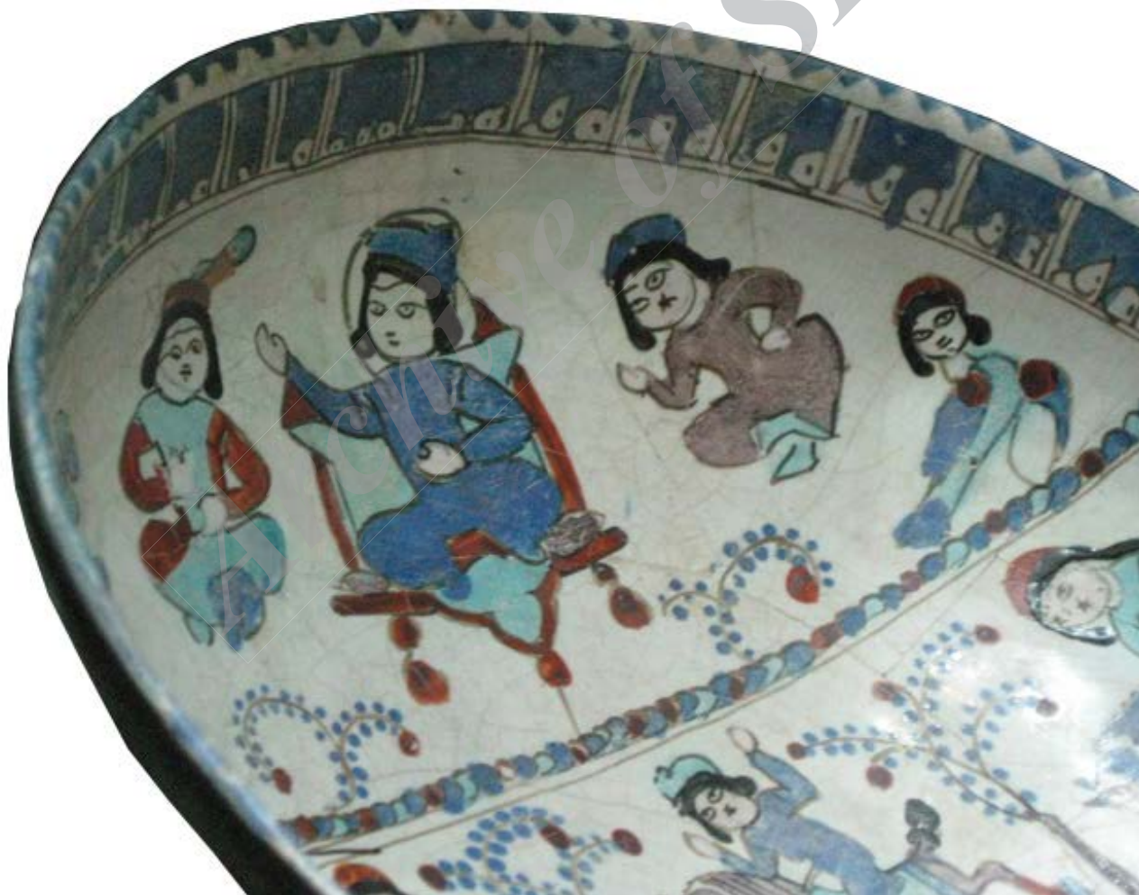
تصویر ۱. تخت سلجوقی منقوش بر کاسه مینایی.

اما نکته قابل توجه علاوه بر اشکال، غنای شگفت‌انگیز طرح‌های تزئینی و نقشمایه‌های پیکره‌ای آن است. چنین می‌نماید که شکوفایی و کاربرد تصویر پیکره‌ای و نمادین در تخالف با گرایش تصویری عمومی جهان اسلام باشد که تبیین بیشتری را می‌طلبد. از آنجا که ایران در این دوران کانون و رهبر هنر به شمار می‌رفت و نیز بخش اعظم مجموعه پیکره‌ای این عهد در ارتباط با ایران بود، برای حل معما لازم است به دو نوشته فارسی و مخصوصاً به دو جنبه از آن رجوع کنیم. خمسه نظامی حاوی تصاویر رنگی درخشانی به شکل استعاره است. این نوع تصاویر بالاتر از همه محصول یک بینش عاطفی و احساسی است که به گونه تخیل جلوه یافته و هویت وجودی ویژه‌ای پیدا کرده است. در اشعار عرفانی مثنوی مولانا، برای نخستین بار بازنمایی‌های پیکره‌ای جلوه‌گر شده و هدف از آن نیز رد و تکذیب نقاشی از دیدگاه مذهبی نیست بلکه بهره‌گیری تعلیمی از آن برای تبیین رموز باریتعالی