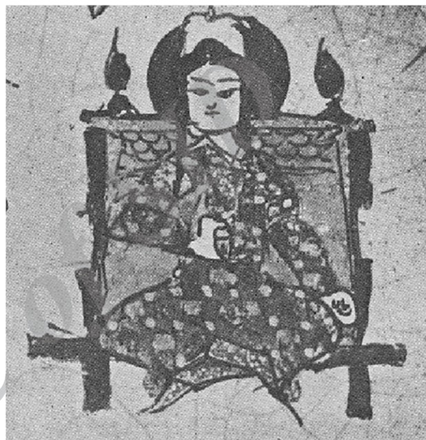
تصویر ۲. تخت سلجوقی، کاسه مینایی، ری.

می‌کند، می‌گیرد" (رید، ۱۳۷۱:۲۲۳) و هر آنچه ما انجام می‌دهیم در درون ساختارهای اجتماعی صورت می‌گیرد، بنابراین از آنها تأثیر می‌پذیریم (رامین، ۱۳۸۹:۱۷) از این رو این نکته را می‌بایست مورد توجه قرار داد که هنرمند-مبلساز عصر سلجوقی در دوره‌ای می‌زیسته که از یک سو وارث الگوهای ساختاری و تزئینی مبلمان ایرانی پیش از سلجوقی بوده و از سوی دیگر می‌بایست پاسخگوی نیازهای کاربردی و رفتاری کاربران (حاکمان سلجوقی) باشد.