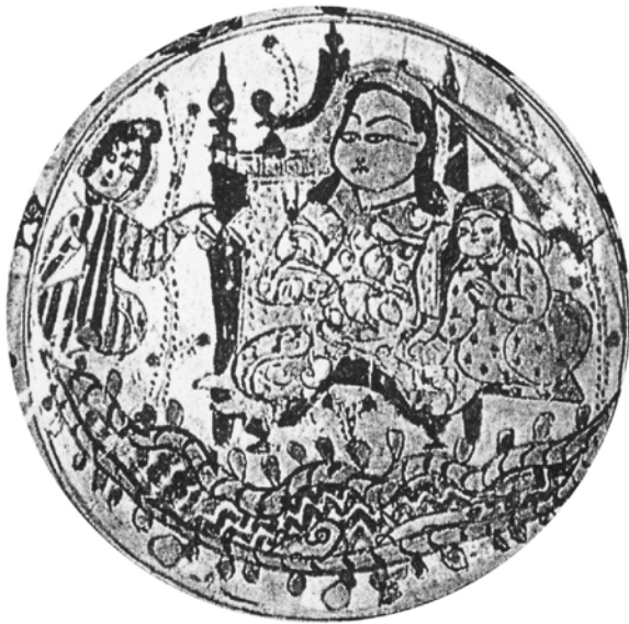
تصویر ۵. نشستگاه تاجدار