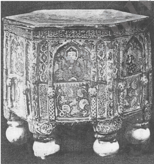
تصویر ۸. چهارپایه از کاشی منقش مینایی