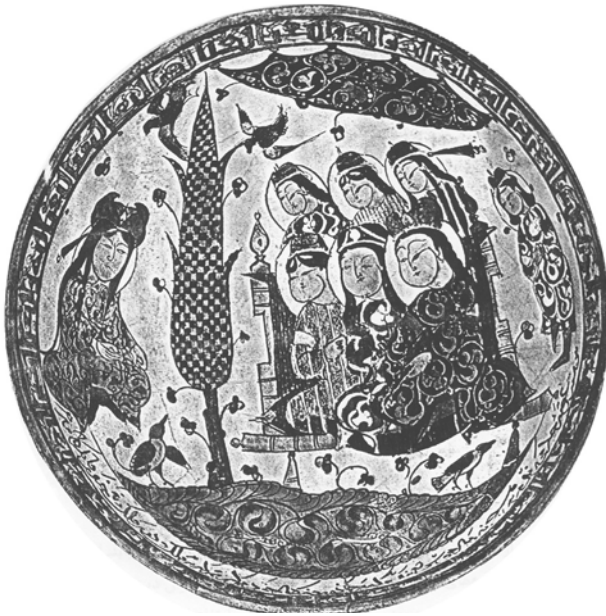
تصویر ۷. نشستگاه چندنفره