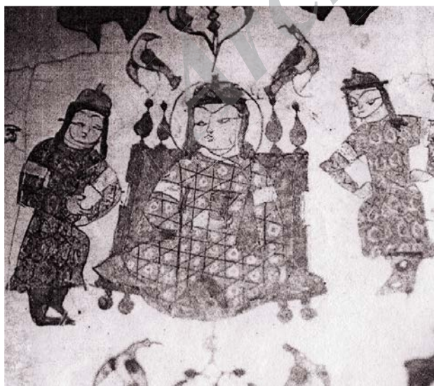
تصویر ۳. نشستگاه سلجوقی، کاسه مینایی.