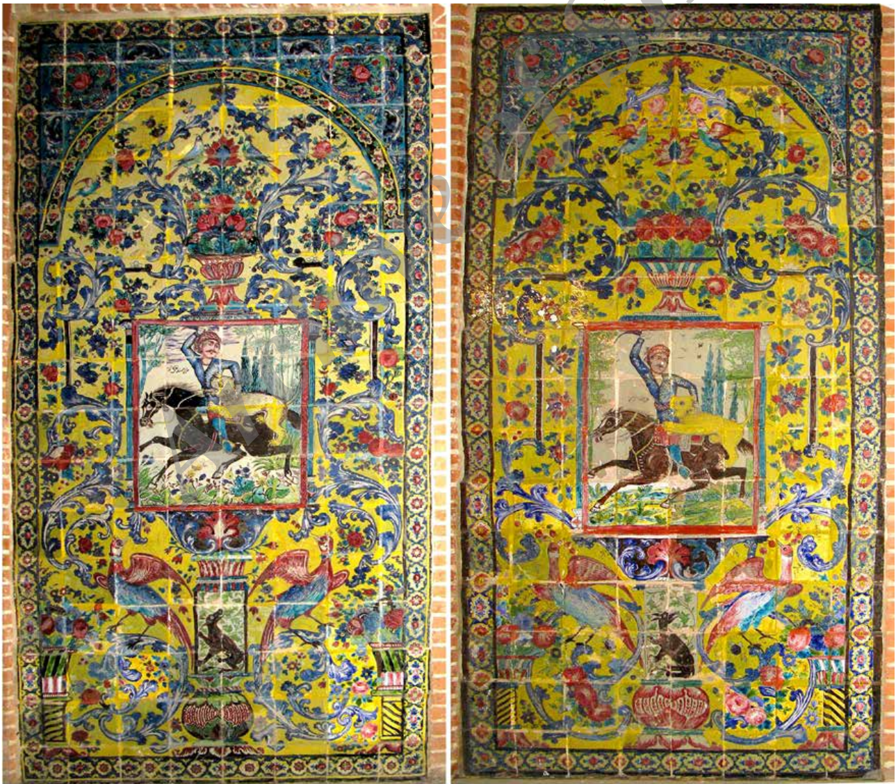
تصویر ۵. صحنه‌های سوارکار شیرافکن یا کوراولو با اسب قیرآت.

نمونه‌های گرمابه نوبر تبریز به لحاظ موضوع و مضمون آنها با نمونه‌های قابل مقایسه در دیگر شهرهای ایران با تأکید بر بافت-بستر آنها و همچنین با مراجعه به اسناد تاریخی قابل بحث و بررسی است :