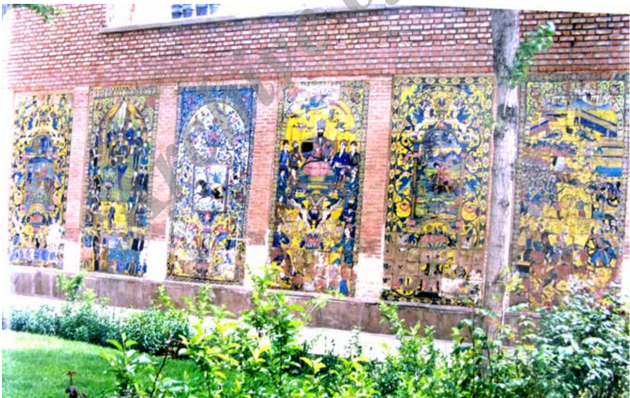
تصویر ۹. نمایی از بافت-بستر اصلی مجموعه کاشی‌نگاره‌های گرمابه نوبر در حیاط عمارت فرشی (شکیللی) در سال ۱۳۷۷ ه.ش.

شهرهای ایران قابل رؤیت است: عمارت‌های باغ ارم و نارنجستان قوام و زینت‌الملوک در شیراز، حسینیه مشیر شیراز، کاخ گلستان و شمس‌العمارة تهران، عمارت آیینه‌خانه بجنورد و تکیه معاون‌الملک در کرمانشاه. بنابراین، برای بررسی فرضیه اصلی این پژوهش، به ترتیب از دو روش مشاهده میدانی و اسناد تاریخی استفاده شده است: در ابتدا لازم بود که از عدم سابقه تصویرنگاری در تزیینات گرمابه‌های تاریخی تبریز اطمینان کافی حاصل شود که البته نتیجه منفی بود (درباره این حمام‌ها، ن.ک. رشیدنجفی، ۱۳۸۹: ۷۰-۳). در نتیجه، سابقه کاشی‌نگاری در خانه‌های تاریخی تبریز تنها گزینه معقول می‌نمود. اما از آنجا که سیف (۱۳۸۹: ۱۹۰-۳ و ۱۳۳) هیچ مشخصات و نام و نشانی از خانه‌ای که آن کاشی‌نگاره‌ها را آنجا رؤیت کرده، منتشر و عرضه نکرده است، ناگزیر عمارت‌ها و خانه‌های تاریخی تبریز باید بررسی و مرور می‌شدند که البته به‌استثنای عمارت متروک خانواده کلانتری، تزیینات معماری آنها فقط شامل گچبری، آجرکاری و نقاشی دیواری (عمارت بهنام) است (درباره تزیینات و پلان خانه‌های تاریخی تبریز، ن.ک. کی‌نژاد، شیرازی، ۱۳۸۹). نمای عمارت کلانتری تبریز با کاشی‌های هفت‌رنگ هندسی آراسته شده