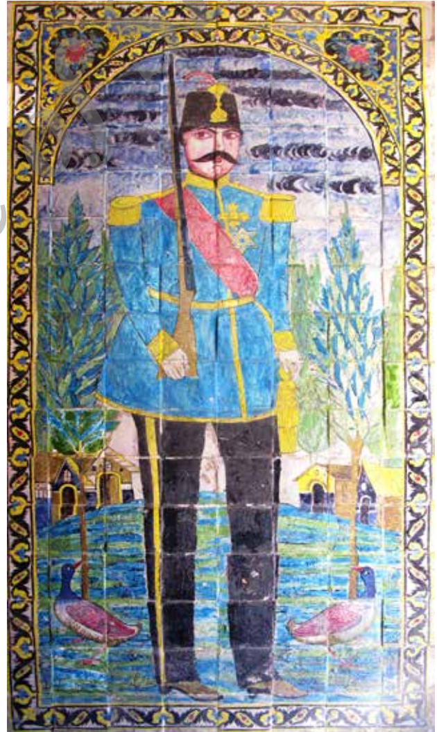
تصویر ۲. کاشی‌نگاره صاحب منصب قاجار، احتمالاً جوانی مظفرالدین شاه قاجار به هنگام ولایت‌عهدی‌اش در تبریز.