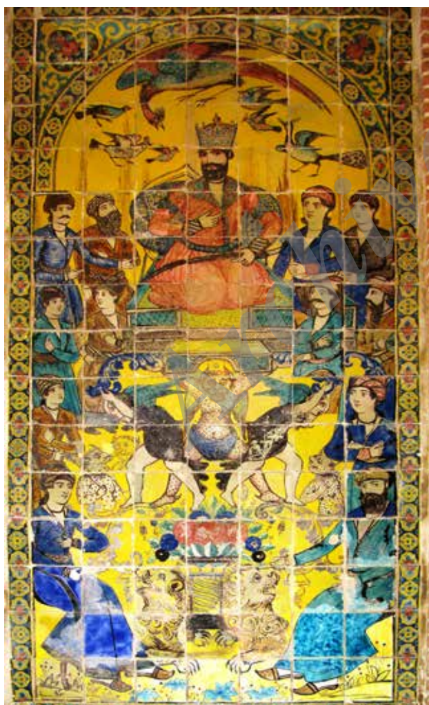
تصویر ۸. بارگاه سلیمان نبی (ع).

ج. مجالس نخجیر و شکارگاه: دو مجلس سوار شیرافکن، گویا بخشی از افسانه معروف کوراوغلو و اسب قیرگون تندرو مشهور به قیرآت را روایت می‌کند. منظره‌پردازی‌های زمینه سوار شیرافکن و جوان شکارچی به شیوه ایرانی است. در حالی که منظره پشت سر آن دو سردار به شیوه اروپایی قلم‌گیری شده است (دربارۀ منظره‌پردازی در نگارگری ایرانی و اروپایی، ن.ک. جوادی، ۱۳۸۳). اما درباره تصویر آن جوان سوارکار شکارچی گویا به نظر می‌رسد که باید یکی از اشراف باشد. این نکته نه تنها از نقش رسمی و دولتی شیر و خورشید در لچکی‌های طرفین بالای نگاره بلکه از نیکه‌هایی که تاج سلطنتی را پیشکش می‌کنند نیز استنباط می‌شود (تصویر ۶). مناظر اشراف سوارکار بر فرسک‌های تالار عمارت بهنام تبریز نیز نقش بسته است. صحنه‌های شکار و نخجیر دارای نمونه‌های مشابهی در عمارت شمس‌العماره و کاخ گلستان در تهران و عمارت باغ ارم و عمارت عطروش در شیراز است که البته منظره‌پردازی آنها اسلوب ایرانی و قاجاری دارد. کاشی‌نگاره‌هایی با مضمون و صحنه