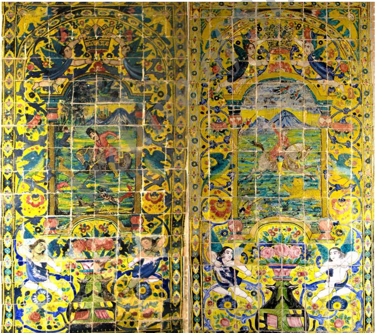
تصویر ۶ صحنه‌های جوان شکارچی.