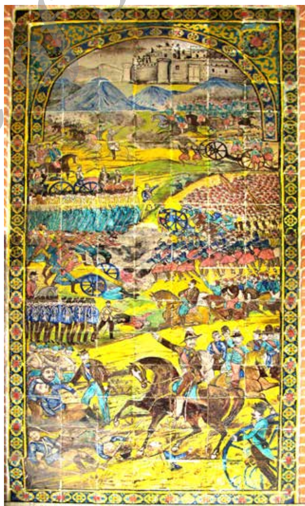
تصویر ۷. صحنه نبردگاه اروپا.