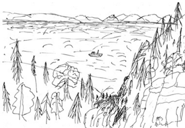
تصویر ۱. نمونه‌ای از تصاویر ذهنی و نقشه‌های شناختی مبتنی بر روش‌های گوناگون. مأخذ: Ueda et al., 2012; Oliver, 2007; de Jonge, 1962. Fig1. Mental images & maps based on various techniques. Source: Ueda, et al., 2012; Oliver, 2007; de Jonge, 1962.