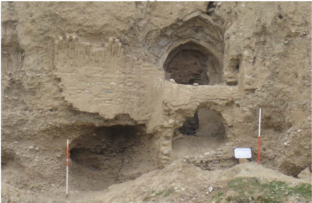
تصویر ۸. بقایای معماری دوره ایلخانی محوطه لور در نزدیکی پل بند. Fig. 8. Architectural remains of the Ilkhani Period near Loor Dam.

شواهد تاریخ‌گذاری: در اطراف سازه مورد بحث تعدادی قطعات سفال به دست آمد که همگی آنها متعلق به دوره میانه یا متأخر اسلامی هستند. این سفال‌ها که بیشتر از نوع لعابدار با لعاب سبز و تعدادی بدون لعاب با نقش‌کنده هستند، متعلق به دوره اسلامی میانه (ایلخانی) اند، همچنین در فاصله ۵۰ متری پل آثار معماری