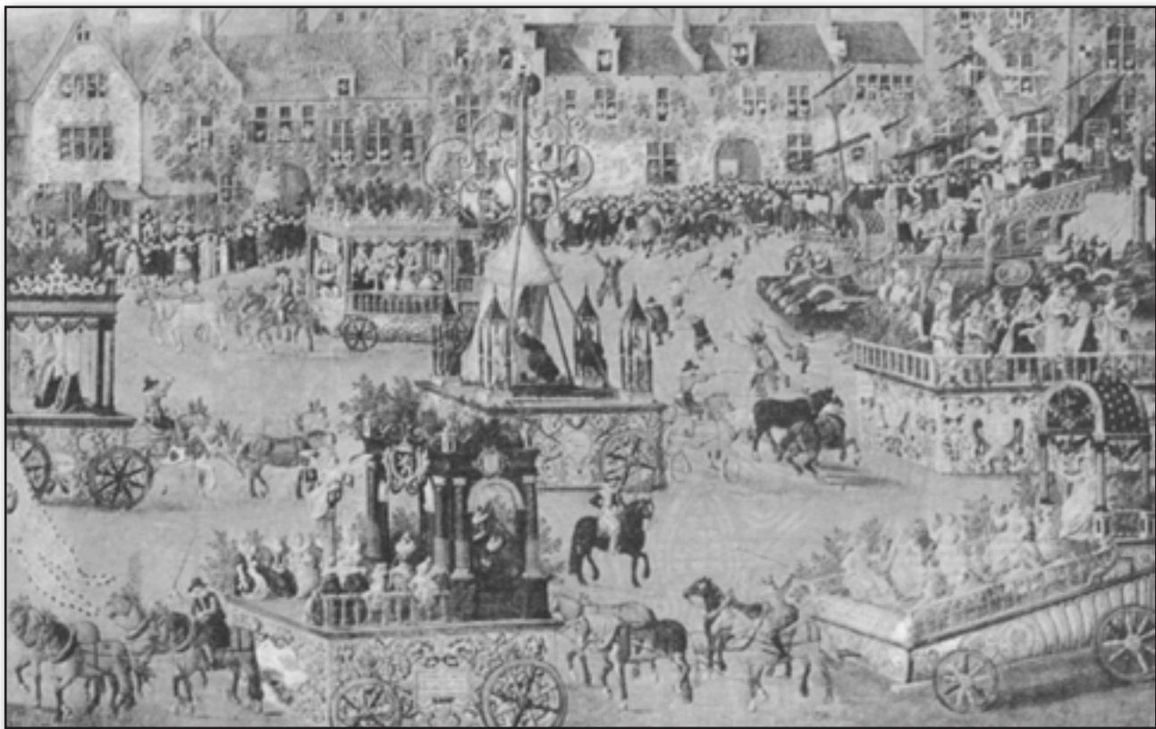
تصویر ۲. یک نمایش واگنی سیار همان‌طور که تصویر نشان می‌دهد، نمایش خارج از فضای کلیسا اجرا می‌شود. از سال ۱۳۰۰ میلادی به بعد نمایش‌های مذهبی این شانس را یافتند تا بیرون از کلیسا اجرا شوند. مأخذ: هارتنول، ۱۳۴۷: ۴۳. Fig. 2. As the figure shows, religious plays (Mystery Plays) are performed on pageant wagons outside the churches. From 1300, religious plays had the chance to be performed outside the churches. Source: Hartnol, 1968: 43.