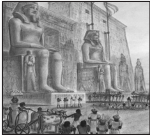
تصویر ۱. اجرای یک نمایش دسته‌روی مذهبی همراه با حمل مجسمه اوزیریس بین دو معبد لوکسور ۲۰ و کارناک ۲۱ نمونه‌ای از یک نمایش در فضای بیرونی، مأخذ: Carpiceci, 1998: 13622. Fig. 1. Performing a processional and religious play, carrying the statue of Osiris between two temples of Luxor and Karnak, as an example of performance in outdoor space. Source: Carpiceci, 1998: 136.

بنابر مستندات فوق، می‌توان چنین اذعان کرد که از دیرباز جوامع انسانی شاهد اجرای نمایش در محیط‌های بیرونی بوده‌اند؛ نمایش‌هایی که در اشکال و مقاطع گوناگون و با اهداف متفاوت اجرا می‌شده‌اند. اما نکته مهم اینجاست که اصطلاح "تئاتر خیابانی" به گونه‌ای از نمایش اطلاق می‌شود که حاصل تزیید تفکرات جدید در حوزه هنر نمایش و مربوط به جریاناتی است که آغاز آنها به قرون متأخر به ویژه اواخر قرن نوزدهم و اوایل قرن بیستم باز می‌گردد. کالین چمبرز ۲۸ در کتاب تئاتر قرن بیستم، تئاتر خیابانی را با جنبش‌های فمینیستی هنر در قرن بیستم مرتبط دانسته و می‌گوید: در اوایل قرن بیستم و با ظهور جنبش‌های اجتماعی گسترده‌ای مانند جنبشی که فمینیست‌ها در زمینه‌های مختلف سازماندهی کردند، اشکال جدیدی از تئاتر هم ظهور پیدا کرد؛ از جمله تئاتر خیابانی که نوعی تئاتر اعتراضی محسوب می‌شد. اعتراضی که هم در شکل سنت‌شکنانه آن و هم در محتوای نمایش‌ها قابل درک بود. تعداد دیگری از نظریه‌پردازان برجسته تئاتر هم درباره تئاتر خیابانی و سنت‌شکنی‌های این تئاتر مطالبی را عنوان کرده‌اند. به طور مثال برتولد به موضوعات استفاده شده در تئاتر خیابانی اشاره کرده و معتقد است مضامینی چون حقوق انسان‌ها، تبعیض در طبقه و نژاد، حقوق اجتماعی زنان، فقر و سرمایه‌داری مدرن، جنگ و نسل‌کشی