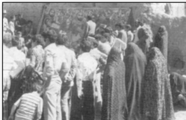
Fig. 5. Kashan, Mashhad Ardehal, performing Qali Shoyan (capet washing) Ritual. The players of this dramatic ritual are ordinary people carrying sticks (perhaps as a symbol of weapon) to show their anger about killing the Saint by the government's rulers.

تصویر ۴. نمایی از پرده‌خوانی در دوره پهلوی (۱۳۰۵-۱۳۵۸).