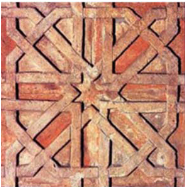
تصویر ۵. کاشی دوره سامانیان. چلیپا شکسته از گرمی دشت مغان، موزه متروپولیتن. مأخذ: رضالو، ۱۳۹۲: ۱۷.