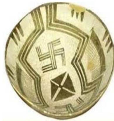
تصویر ۲. آوند شوش با نقش چلیپا شکسته.