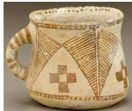
تصویر ۳. لیوان ۳۰۰۰ساله ایرانی با نقش چلیپا، محل نگهداری موزه اسمیتسونیان.