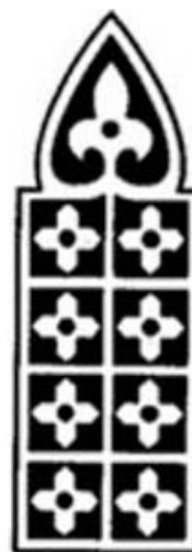
تصویر ۷. نقوش مقرنس‌های دالان ورودی الجایتو در مجموعه بسطام

به آفریننده، تکامل و تعالی آرمان‌های خوب و برجسته است» (ذاکرین، ۱۳۹۰: ۲۶). تداوم نشان چلیپا بر سفالینه‌ها (تصویر ۳) و آثار هنری (تصویر ۴) و معماری ایرانی (تصویر ۵) از گذشته تا به امروز نشان از اهمیت و اعتبار آن و دلبستگی است که مردم در طول زمان به این نشان داشته‌اند در نگاه کلی، چلیپا مظهر نیروهای اسرارآمیزی است که در طول دوران با اندیشه‌های متعالی پیوند برقرار کرده است و حتی در هنر اسلامی (تصویر ۶ و ۷)، در معنا و مفهوم متعالی با در نظر گرفتن ریشه‌های خود زندگی جدیدی را آغاز کرده است.