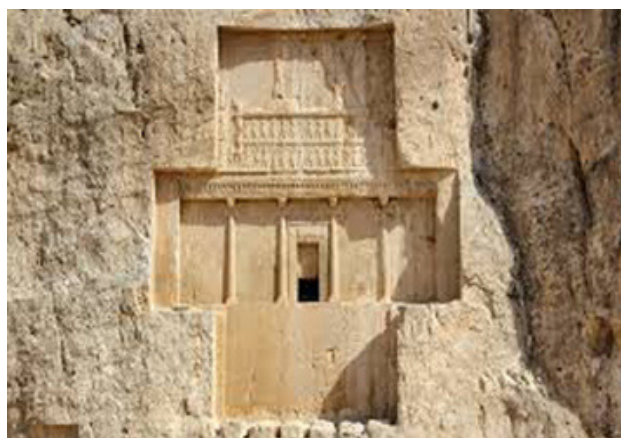
تصویر ۹. نقش چلیپا، آرامگاه شاهان هخامنشی. مأخذ: بختورتاش، ۱۳۸۶: ۲۰۰.

وی را فراهم می‌آورد. در واقع هراکلیتوس در جریانی موازی با تعالیم زرتشت، آتش را به عنوان اصل نخستین جهان می‌پذیرد. به دیگر سخن وی آتش را جوهر همه موجودات دانسته که همانند کلمه در کار است. آتش قانون الهی است که بر جهان حکم می‌راند و نماینده نظم کلی کاینات دانسته می‌شود. آتش همان لوگوس یا خرد جهانی و قانون کمالی است که انسان‌ها به جانب آن سیر می‌کنند، در تعالیم زرتشتی و حکمت نوری ایران نیز آتش و نور حاصل از آن ابزار عدالت، راستی، درستی و در پیوند با اشته و هیسته است. اشته در نهایت همه چیز را قضاوت می‌کند، همانند لوگوس که کل گیتی را هدایت می‌کند. از این رو نشان چلیپا به عنوان نمادی از آتش و نور یگانه تمثیل دیداری اشته و لوگوس در هنر است. به دیگر سخن چلیپا نمادی از آتش روحانی است که روشنی می‌بخشد و همیشه درخشان، فروزان و راهنماست. این آتش