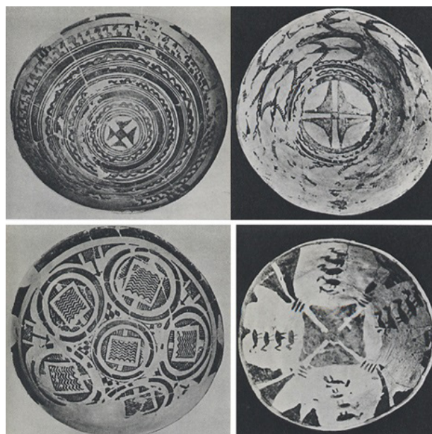
تصویر ۸. نقش چلیپا بر روی سفال‌های شوش، مأخذ: بختورتاش، ۱۳۸۶: ۳۸۶.