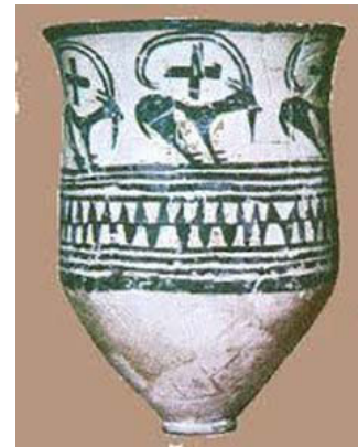
تصویر ۱. آوندسیلک بانقش چلیپا.