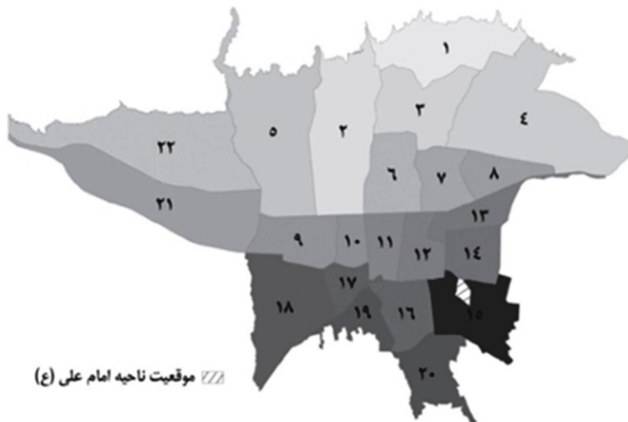
تصویر ۲-ب. موقعیت ناحیه امام علی در استان تهران.