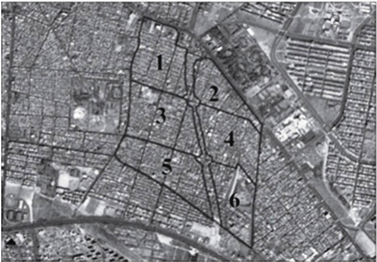
تصویر ۲-الف. محلات ناحیه امام علی.