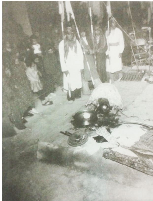
تصویر ۱. حضور تماشاگران در میان لشکریان در تعزیه.