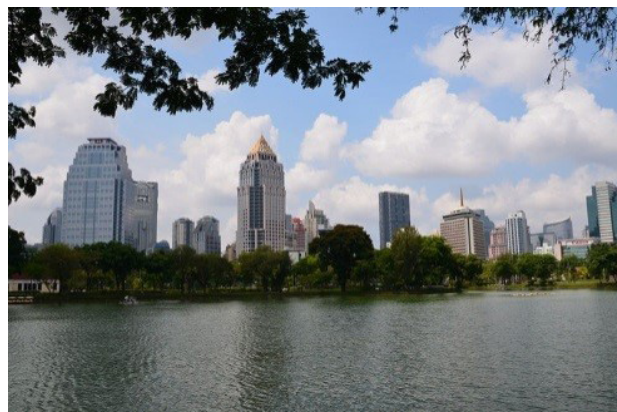
تصویر ۵. نمای هتل لامپینی؛ مأخذ : www.wikimedia.com