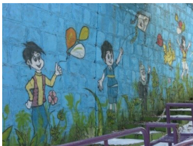
تصویر ۹. نقاشی دیواری؛ ورودی شهر بازی.