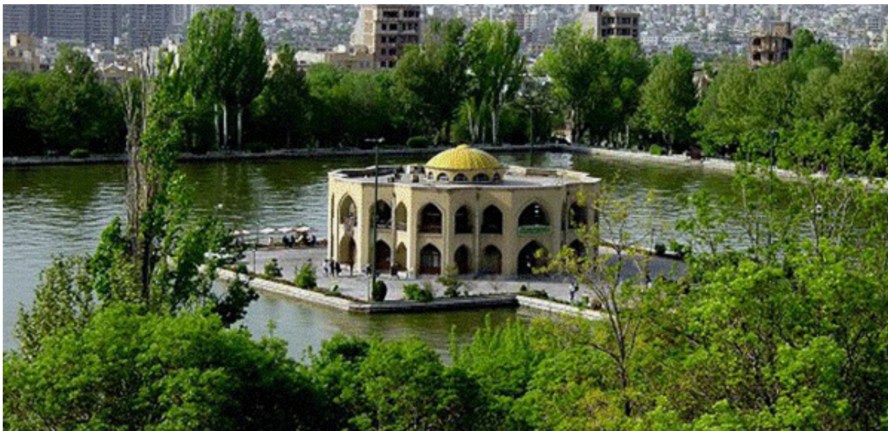
تصویر ۱. نمای عمارت و استخر؛ پارک ایل گلی.

سهند است. احداث بنای اولیه آبگیر به زمان سلطان یعقوب آق قویونلو نسبت می‌دهند و توسعه آن را از دوره صفویه می‌دانند. تکمیل عمارت و گردشگاه مخصوص درباریان و آبادانی آن را به زمان قهرمان میرزا پسر عباس میرزا نایب السلطنه که حکمران آذربایجان بوده نسبت می‌دهند (همان). در دوره صفویه آب استخر ایل گلی بزرگ‌ترین آب انبار شهر برای باغ‌ها به حساب می‌آمد که در دوره آق قویونلوها و