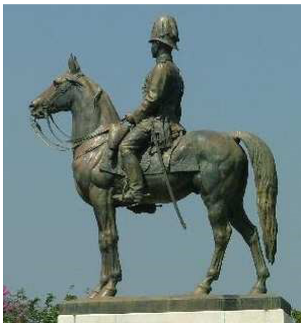
تصویر ۳. مجسمه رامای پنجم؛ ورودی پارک لامپینی.

هتل (تصویر ۵) و کتابخانه عمومی پارک لامپینی از لحاظ فرم ظاهری از معماری یونان تبعیت می‌کنند. سایه‌بان‌ها با شکل سنتی معماری سامی و برج ساعت متأثر از هنر چینی