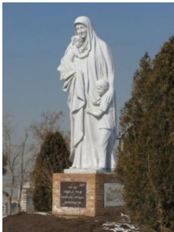
تصویر ۷. مجسمه مادر؛ پارک ایل گلی. مأخذ: نگارندگان : www.wherein-bangkok.com

کلاسیک و مدرن است. در گروه مجسمه‌های لامپینی علیرغم تنوع آثار، کمبود مجسمه‌هایی با رویکرد منطقه‌ای و بومی وجود دارند مسئله‌ای که به نوعی دیگر در ایل گلی شاهد آن هستیم (جدول ۱).