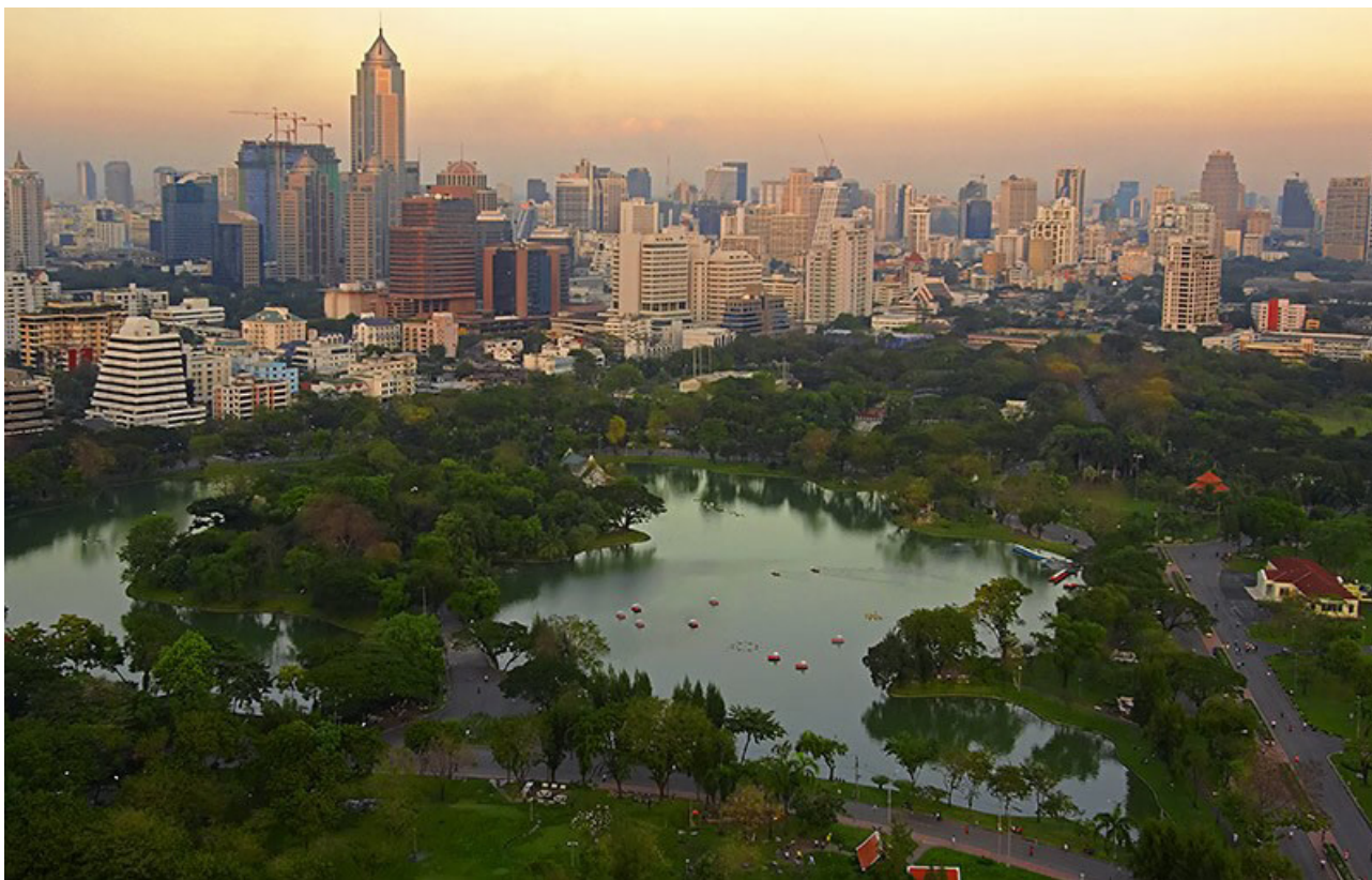
تصویر ۲. نمای ورودی و دریاچه؛ پارک لامپینی.