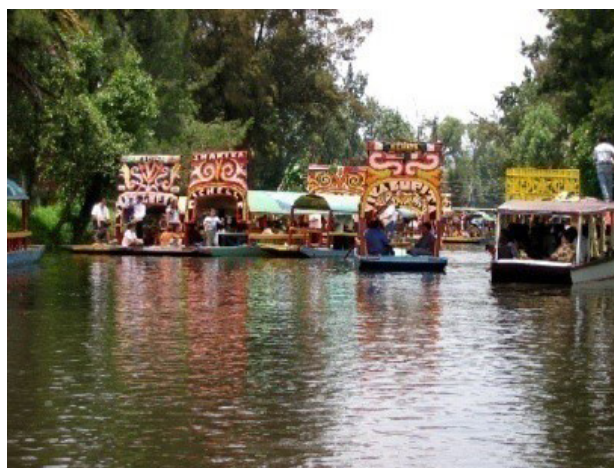
تصویر ۱۱. دریاچه و قایق؛ پارک لامپینی.