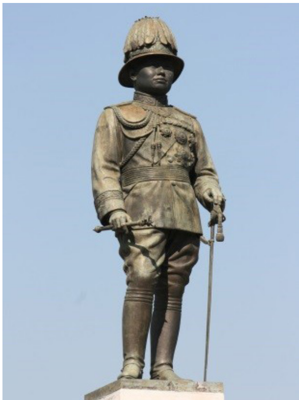
تصویر ۶. مجسمه رامای؛ ورودی پارک لامپینی.

در بسیاری از کشورها پر از دحام‌ترین و خلوت‌ترین نقاط، محل نصب آثار هنری به شمار می‌روند. شلوغ‌ترین مکان‌ها، عاملی برای ارتباط اثر هنری با عموم را در پی دارند و خلوت‌ترین مکان‌ها با داشتن مجسمه‌ها پویایی بیشتری را ارائه می‌دهند و از سویی دیگر عامل جذب اشخاص به این فضاها می‌شوند؛ مسئله‌ای که در ایل گلی نادیده گرفته شده‌اند؛ مجسمه کودکان در پس درختان و کافی شاپ گم شده است. ایل گلی با مقیاس کلان خود، دارای فضای بی‌شماری برای قرارگیری آثار است برای نمونه پلکان ورودی، که در جلب مخاطب و هویت‌بخشی به مکان دارای پتانسیل بالایی است. در پارک لامپینی مجسمه رامای پنجم (تصویر ۶)، مجسمه مدرن، مجسمه زن و کودک قرار دارد. پارک لامپینی با داشتن چندین مجسمه دارای تنوعی از سبک‌های اجرایی