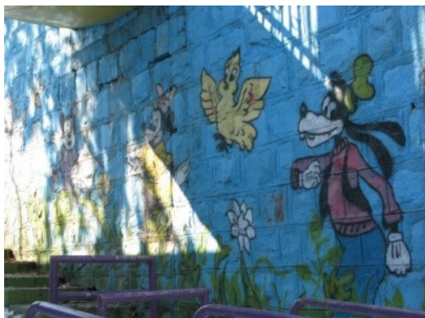
تصویر ۸. نقاشی دیواری؛ ورودی شهر بازی.