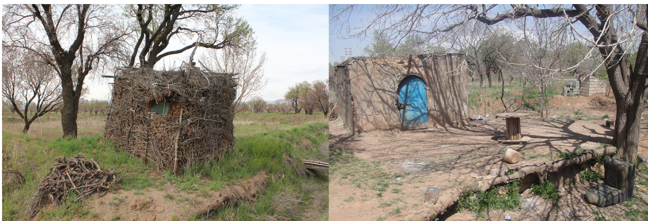
تصویر ۲. راست: چاه‌خانه بادرختان سایه‌انداز همانند توت برای استراحت باغبانان. مأخذ: نگارندگان. چپ: آله ساخته شده از شاخه درخت برای دیده‌بانی باغبانان. مأخذ: نگارندگان.

برگه‌ای (نصفه‌ای) (ورجاوند، ۱۳۷۷: ۱۸). در نظام مالکیت و مدیریت پیش گفته رابطه نزدیک میان مالکان و مدیران بسیار اهمیت داشته و تفاهم آنان بر روی سود حاصل از درآمدها حیاتی بوده است. چنین مناسباتی رابطه انسانی جوامع محلی قزوینی را بسیار قوی می‌ساخته است.