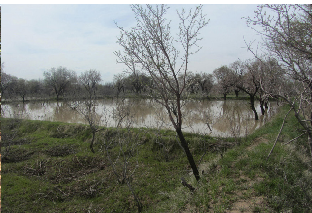
تصویر ۱. راست: شیوه کشت مختلط گیاهان باغستان و آبیاری غرقابی باغستان. چپ: درختان کهنسال پسته در فصل محصول.

محصول دهند. باغستان سنتی قزوین طبق تعریف زکریابن محمد بن محمود قزوینی (۶۰۵-۶۸۳)، پس از قرن ششم هجری همانند حلقه‌ای سبز در اطراف شهر شکل گرفته‌اند (گلریز، ۱۳۸۲: ۱۴۶)؛ (تصویر ۳، راست) و در دوره‌های مختلف تاریخی ایران به حیات خود ادامه داده‌اند. شواهد حضور باغ‌ها در سفرنامه‌های متعلق به دوره‌های صفوی (همانند دل لاوله و تاورنیه) و قاجار (همانند مامونف و دیولافوا) موجود است. در نقشه