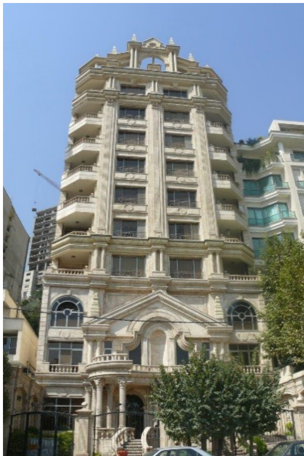
تصویر ۵. مجتمع مسکونی در خیابان نیاوران تهران، نمونه‌ای از طراحی موسوم به کلاسیک.

شکل می‌دهند و دسته دیگر که تمایلی در پیوند خود از طریق سلیقه به مد را در دستور کار ندارند، بنابراین نسبت سلیقه و مد در معماری به میزان تمایل افراد در تعلق یافتن به لایه‌های اجتماعی و کسب تمایز و تشخیص فردی، بستگی دارد (تصویر ۵ و ۶).