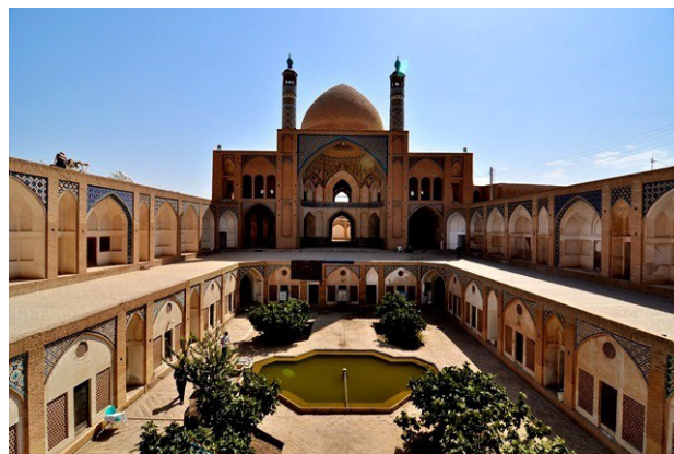
تصویر ۲. مسجد آقا بزرگ کاشان.