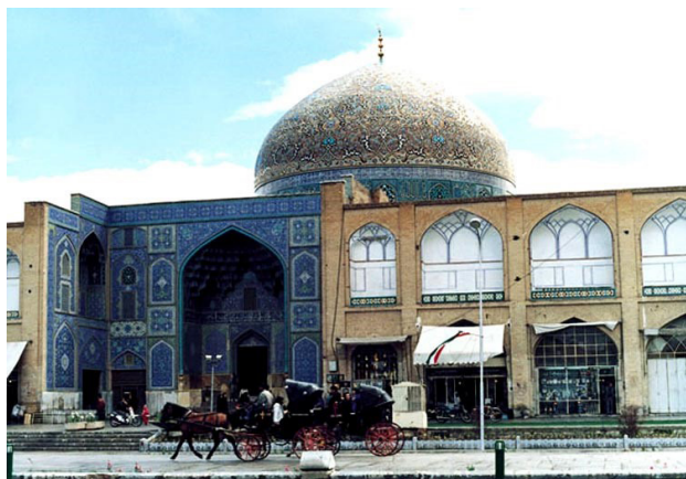
تصویر ۱. مسجد شیخ لطف‌الله اصفهان.

آثار هنری و معماری راه یافت، موجب پیوند عمیقی میان این عرصه‌ها شد. چنانکه یوهانی پالاسما باور دارد «معماری هنر سازگاری میان ما و جهان است و این ژرف‌اندیشی از طریق حس اتفاق می‌افتد؛ به نظر وی نخستین مرتبه این رخداد به طور معمول بصری است و حس‌های دیگر مانند لامسه و بویایی نیز در مراتب بعدی فعال می‌شوند و به آن اضافه می‌گردند» (Pallasmaa, 1994). بنابراین نخستین جستجوها در مورد نسبت معماری و سلیقه، به‌سان یک فصل مشترک، به وادی حس و زیباشناسی معطوف است. اما چگونه؟ توجه اهل نظر در مورد حس زیباشناختی، به دو امر معطوف می‌شود: نخست آنکه اگر چه تجربه زیباشناختی با حواس آغاز می‌شود اما با آن پایان نمی‌پذیرد؛ زیرا دیدن رنگ‌ها، شکل‌ها، فضاها در آثار هنری و معماری با تیرگی و روشنی، نرمی و زبری، دوری و نزدیکی فاصله صحنه‌ها و رویدادها همراه است که طی فرایند ادراک حسی به تولید معنا می‌انجامد. دوم اینکه ادراک حسی و زیباشناختی ادراک جنبه‌های معینی از متعلق ادراک است و لازم نیست محدود به آثار هنری و معماری یا مصنوعات انسان باشد؛ پدیدارهای طبیعی، چهره انسان، اصوات، طلوع و غروب آفتاب و هر پدیده‌ای در هستی می‌تواند به‌سان متعلق ادراک، برای انسان وجه حسی داشته باشد (اسکروتن، ۱۳۹۳: ۱۸-۱۷). نکته مهم، تفاوت میان پیدایش حس خوشایندی که به واسطه خود اثر یا حس خاص مسحور کننده‌ای است که از طریق آن در ما به وجود می‌آید. مانند شنیدن یک قطعه موسیقی یا دیدن صحنه‌ای از تئاتر یا شنیدن یک شعر. شعر یا موسیقی مسحور کننده است اما وجه ملموس مادی ندارد. اینجا تنها حس شنوایی است که به سبب آن شخص دچار جذب یا وجد می‌شود. بنابراین در مقوله زیباشناختی و حسی که پس از آن به وجود می‌آید دو نکته مستتر است، یکی در باب لذت