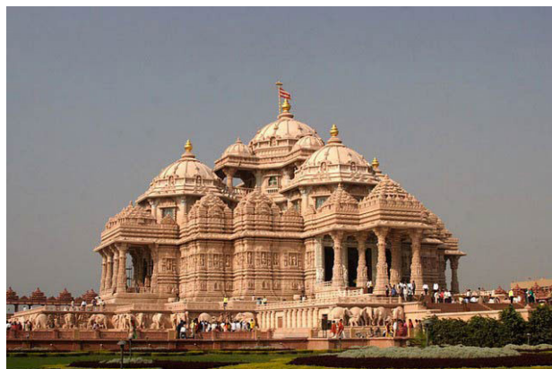
تصویر ۴. معبد آشکاردام هند.

به این ترتیب بررسی سلیقه از مشاهده یک بنا به دو مقوله کلی رسید. اول اینکه انتخاب براساس ادراک حسی یا دریافت معنا از منظر فرم یا آنچه به لحاظ بصری یا عینی دیده شده انجام شود، دوم آنکه مفاهیم و معانی بعد از دیدن بنا از مرتبه ظاهر فراتر رود و با توجه به ذهنیات فرد شکل بگیرد که آنگاه با توجه به زمینه‌های ذهنی افراد با هم به دریافت‌های متفاوتی خواهد رسید. اما بدیهی است در مقابل نمای یک بنا یا برون معماری، ما نظاره‌گر هستیم و در درون آن ساکن. ظاهر بنا به شهر تعلق دارد و موجودیتی صلب و ایستاست، در حالیکه درون، فضایی است پویا و زنده که بیش از آنکه دیده شود، احساس می‌شود. بنابراین سکونت یا زندگی و فعالیت در درون، بنا وجه دیگری از معماری است که افزون بر حس دیداری، با حس‌های دیگر انسان عجین‌تر است. پس در جستجوی مبادی سلیقه در معماری، به کیفیت سکونت در بنا پرداخته خواهد شد.