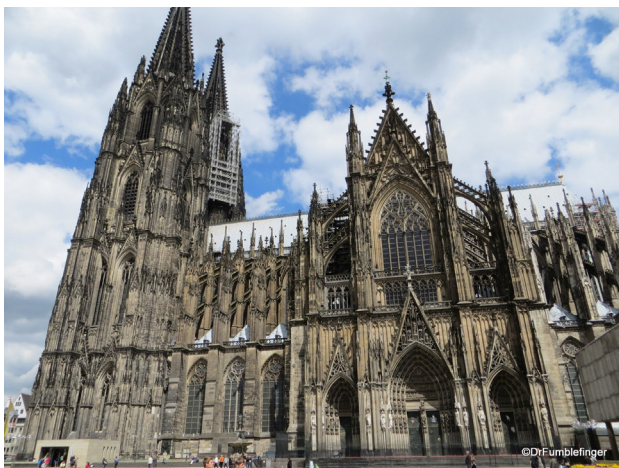
تصویر ۳. کلیسای جامع کلن آلمان.