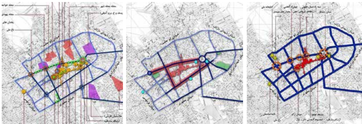
تصویر ۲. نقشه‌های ساختار ذهنی مردم از بافت تاریخی در سه بعد کالبدی، عملکردی و معنایی. مأخذ: نگارندگان.