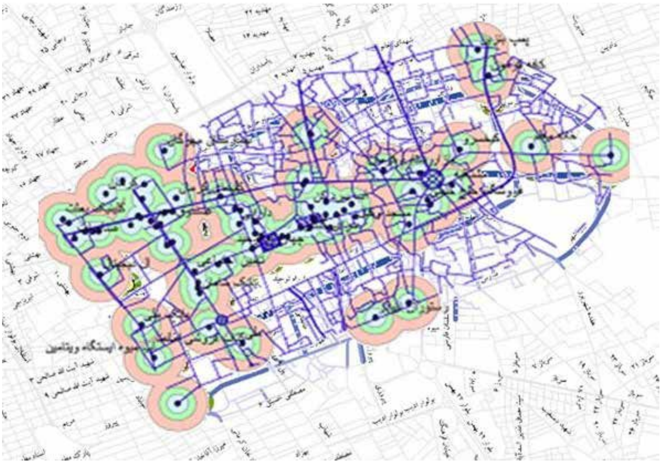
تصویر ۴. نقشه تحلیل ارزش‌های مکانی مرتبط با کاربری زمین.