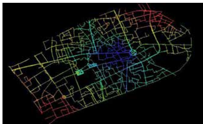
تصویر ۳. نقشه‌های تحلیل a. عمق محوری، b. آنتروپی محوری.