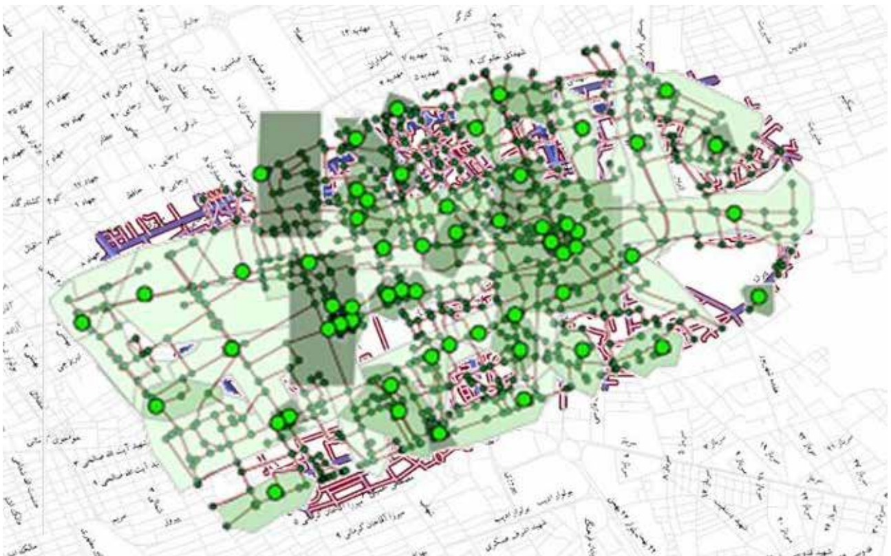
تصویر ۵. نقشه تحلیل ارزش‌های مکانی مرتبط با کاربری زمین.