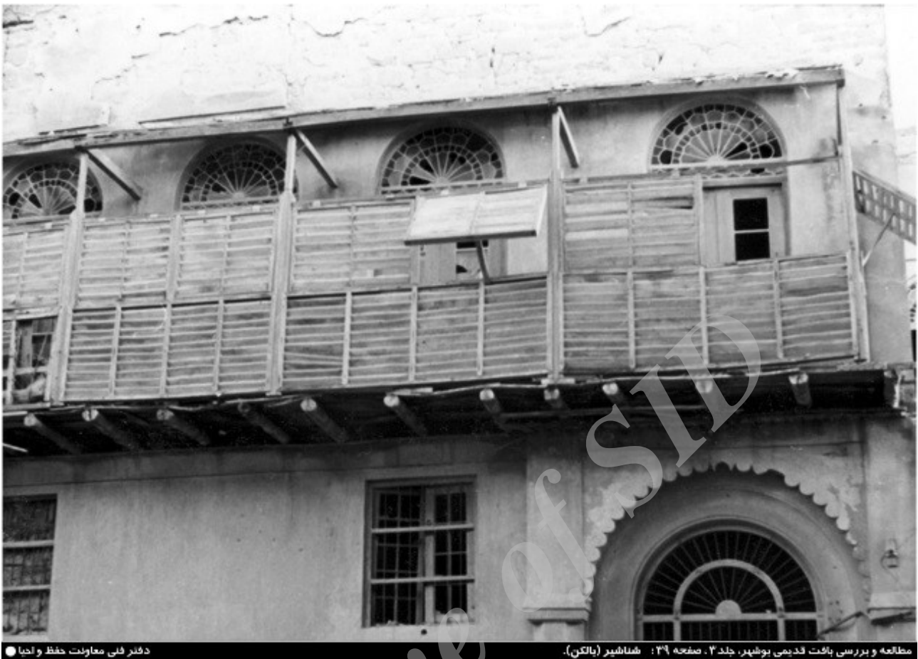
مطالعه و بررسی بافت قدیمی بوشهر، جلد ۳، صفحه ۳۹: شناسییر (بالکن).

تصویر ۱. شناسییر.