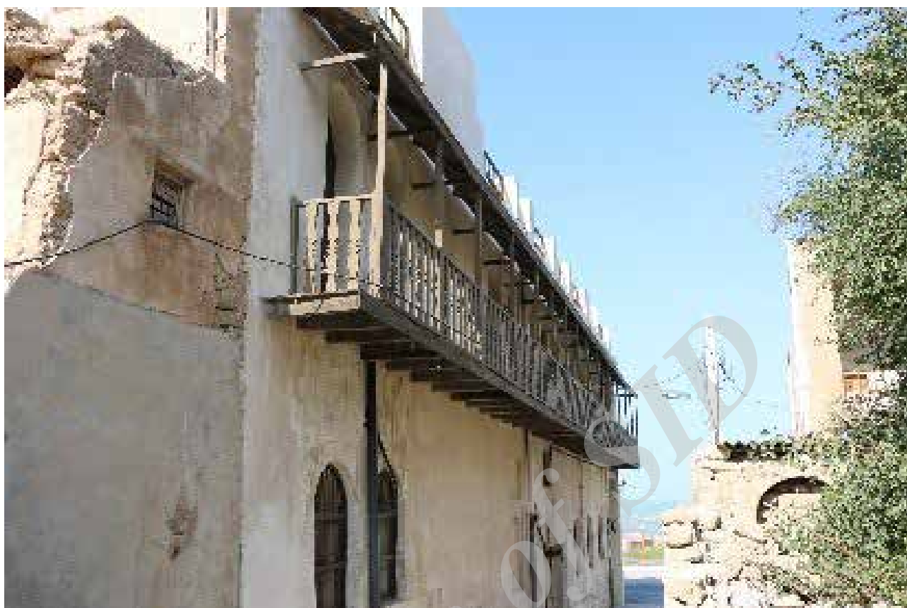
تصویر ۸. بدنه فاقد کرکرهی شناسیرها، شناسیر عمارت طاهری. عکس : بحرانی، ۱۳۹۶.