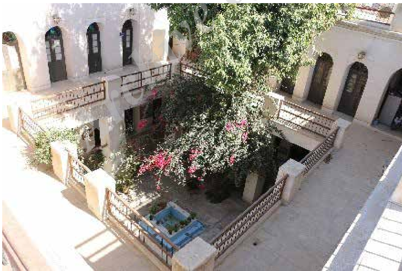
تصویر ۶. عقب‌نشینی در طبقات بالای خانه به منظور ایجاد فضای رابط.

علاوه بر گفته‌های بالا استفاده از شناسیر به عنوان رابط بین فضاهای خانه باعث ایجاد سایه اندازی بر روی حیاط مرکزی و جداره‌های خارجی خانه می‌شود. این سایه اندازی باعث ایجاد دماهای مختلف بر روی سطح دیوار و نتیجه آن ایجاد کوران در اطراف ساختمان است که این کوران‌ها چرخش بهتر هوا را به همراه دارند. از طرفی شناسیر با ایجاد ناهم‌واری در سطح جداره خارجی این کوران‌ها را تشدید می‌کند (تصویر ۷). ● ایجاد محرمیت : یکی از ویژگی‌های مهم معماری ایرانی توجه