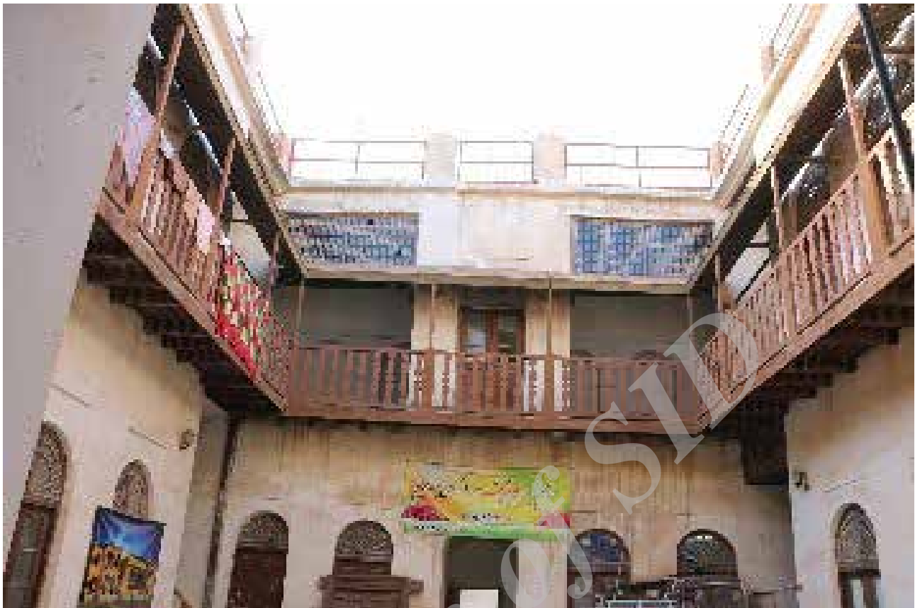
تصویر شماره ۷. پیش‌آمدگی شناسی‌ها درون حیاط مرکزی.

انداختن هوا در محل زندگی شرایط بهتری را فراهم کرد. در این مواقع معماری نیز تلاش دارد شرایط را بهبود بخشد که در پژوهش‌های پیشین یکی از پاسخ‌های معماری را شناسی‌ها بیان کردند. گفته شده است که شناسی‌ها به دلیل ساختار فیزیکی، تهویه خوب و جریان یافتن هوا در آن، محل مناسبی برای زیستن است و ساکنان بخشی از اوقات خود را در تابستان در آن می‌گذرانند. وقتی از بعد عقلائی و با این دید که معماری یک پدیده چند بعدی است به این فرضیه می‌نگریم، در می‌یابیم که شناسی‌ها با این ابعاد غیر معقول خود هیچ‌گاه محلی برای گذراندن وقت نبوده است چرا که حتی عبور یک نفر هم در آن به سختی صورت می‌پذیرد و این نکته نیز بیان شد که اگر شناسی‌ها تنها یک عنصر اقلیمی بود، در دوره‌های بعدی و در چهار محله جدید بوشهر از معماری بومی بوشهر حذف نمی‌شد. از طرف دیگر وجود عنصر طارمه این فرضیه را که شناسی‌ها محلی برای زیستن بوده است را کاملاً رد می‌کند چرا که هر جا نیاز به فضایی برای استراحت و کاهش اثر شرجی وجود داشته، طارمه مورد استفاده قرار می‌گرفته است.