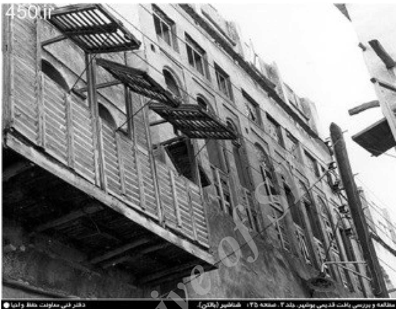
تصویر ۵ ساختار ایجاد ساختاری برای ایجاد امنیت و حریمیت.

خلاقانه به نیاز خود داده‌اند. این پاسخها در معماری خود را در قالب عناصر معماری نشان می‌دادند و کاربران سعی بر آن داشتند که این عناصر را به مرور زمان بهبود بخشند تا استفاده‌های دیگری نیز از آن بکنند و از جنبه‌های مختلفی از آن سود ببرند. با بیان این مسئله به بررسی دیگر ویژگی‌های عنصر شناسیر می‌پردازیم ولی این ویژگی‌ها بنا به دلایل ذکر شده به هیچ وجه دلیل وجودی این عنصر معماری نیستند. بلکه ساکنان خانه‌های بوشهری در کنار دلیل اصلی بیان شده در بالا از آنها بهره‌مند می‌شدند.