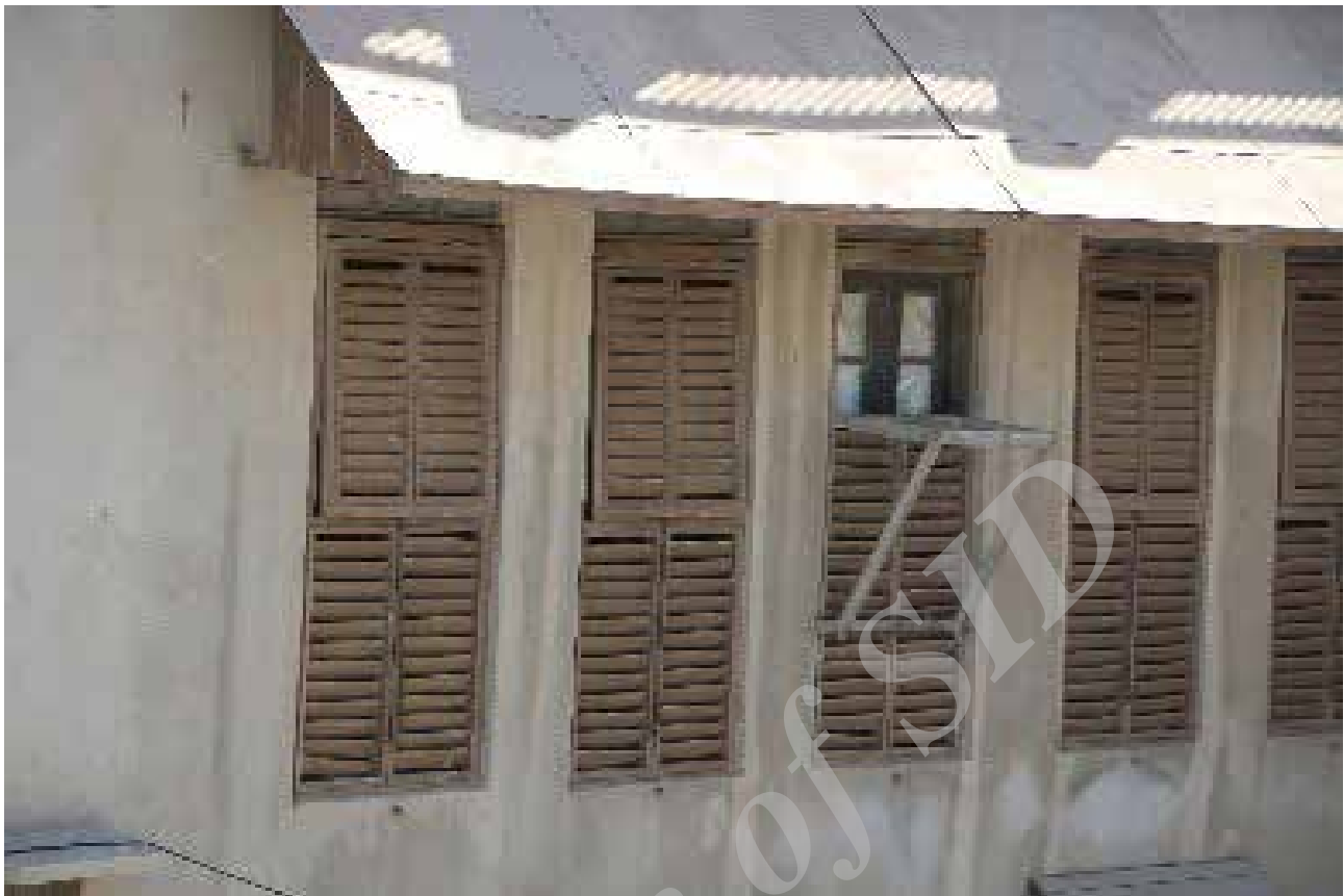
تصویر ۴. شباهت ساختار شناسیها و بازشوهایی که در جلو خود شناسیها ندارند. عکس: بحرانی، ۱۳۹۶.

بازشوهایی زیاد مانند ۵ دری و ۶ دری در خانه‌های بوشهری دلیل آن است. این بازشوها که ارتفاع آنها از سقف تا کف است در تمام طول روز در ماه‌های گرم سال باز هستند تا بتوانند جریان باد را وارد خانه کرده و اثر شرجی را کاهش دهند. باز بودن پنجره‌های قدی، خطرات بسیار زیادی را برای ساکنان به خصوص کودکان به وجود می‌آورد که برای تامین ایمنی آنها تا ارتفاعی از این پنجره‌ها را با کرکره‌هایی می‌پوشاندند ولی این کرکره‌ها جلوی باد را می‌گیرند و از شدت جریان آن می‌کاهند (تصویر ۵).