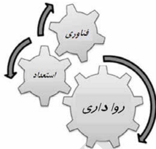
تصویر ۳. متغیرهای شهر خلاق.

در سطح بین‌المللی سازمان‌هایی نظیر سازمان آموزشی، علمی و فرهنگی سازمان ملل متحد ۸ با طرح شبکه جهانی شهرهای خلاق، سازمان همکاری و توسعه اقتصادی ۹ و کمیسیون اروپا ۱۰ نیز از این ایده در سیاستگذاری‌های خود استفاده کردند. البته زمینه پرداختن به ایده شهر خلاق در یونسکو را باید در سال ۲۰۰۱ و بیانیه جهانی تنوع فرهنگی، جستجو کرد که به دنبال نفی استانداردسازی فرهنگ تحت شرایط جهانی شدن بود (Sasaki, 2010). شبکه شهرهای خلاق یونسکو نشان دهنده پتانسیل بسیار بالای فرهنگ برای تقویت توسعه پایدار است. شهرها با پیوستن به این شبکه متعهد می‌شوند که با نگرش تقویت خلاقیت و صنایع فرهنگی، مشارکت را در زندگی فرهنگی ارتقا داده و فرهنگ را در طرح‌ها و استراتژی‌های توسعه اقتصادی و اجتماعی بگنجانند. گفتنی است دستور کار توسعه پایدار برای سال ۲۰۳۰ که سپتامبر سال ۲۰۱۵ به تصویب رسید، بر نقش فرهنگ و خلاقیت به عنوان اهرم‌های کلیدی برای توسعه پایدار شهری تأکید می‌کند. شاید اصلی‌ترین مزیت حضور در این شبکه را بتوان در افزایش آگاهی جهانی از ویژگی‌های منحصر به فرد هر یک از این شهرها دانست که در نهایت می‌تواند به افزایش سرمایه‌گذاری، استفاده بهینه از سرمایه‌های انسانی، رونق گردشگری داخلی و بین‌المللی و در نهایت رونق اقتصادی و فرهنگی این شهرها بیانجامد.