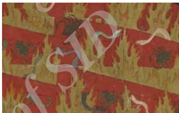
تصویر ۲۱. عذاب متکبرین. بخشی از تصویر ۱۶.

نمادین در تمام نگاره‌های دوزخ، تاریکی است که درآیه ۴۰ سوره نور آمده است؛ و اعمال کافران را به ظلمت‌هایی تشبیه کرده، مولانا تحت تأثیر همین آیات تاریکی را انکار حقایق و جهل می‌داند، ملاصدرا نیز اشاره می‌کند که دوزخ سرای روحانی خالص نیست، بلکه تیره است. تغییر چهره از دیگر خصوصیات دوزخ و دوزخیان است، ملاصدرا در رساله سه اصل آورده است: هر صفت که در دنیا بر کسی غالب شود به سبب بسیاری افعال و اعمالی است که صاحب آن