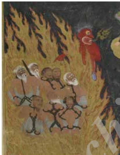
تصویر ۱۸. نمایش غل و زنجیر. بخشی از تصویر ۱۲.