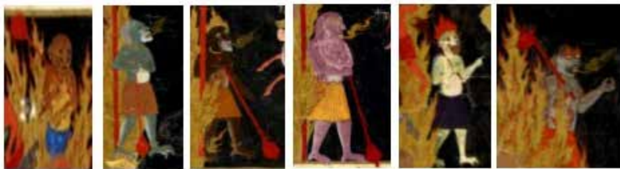
تصویر ۲۰. نگهبانان دیو شکل همراه با گرز، از سمت راست بخشی از تصاویر ۱۳ تا ۱۸.

هستند : آتشی که شعله‌اش مانند قصری است، درکات آن، درخت زقوم با میوه‌های شیطانی، چشمه آب سوزان، نگهبانان، غل و زنجیر و تغییر رنگ پوست و چهره دوزخیان؛ این عناصر با اندکی تغییر در نگاره‌های دیگر نیز مشاهده می‌شوند از جمله آتش و تاریکی که در تمامی نگاره‌ها به عنوان نشانه تصویری دوزخ هستند، مأموران عذاب و نگهبانان دیو شکل نیز از جمله عناصر ثابت دیگر هستند که در اکثر نگاره‌های این نسخه، در میانه تصویر همراه با گرز در آتش ایستاده‌اند همچنین ریختن آب جوش بر سر دوزخیان از جمله مختصاتی است که در قرآن به آن اشاره شده است؛ اما در نگاره‌ها وجود ندارد و دو عنصر عقرب و مار به عنوان عذاب‌های دوزخیان که در یکی از نگاره‌ها دیده می‌شود در بسیاری از احادیث سخن به میان آمده اما در قرآن به آنها اشاره‌ای نشده است. نگارگر در بازنمایی بصری این نگاره‌ها که براساس منابع ارزشمندی همچون قرآن، احادیث و روایات بوده است؛ علاوه بر مصور کردن داستان، به بیان مفاهیم نمادین مورد نظر خود پرداخته است. به این ترتیب چنین می‌توان بیان کرد : مفاهیم عرفانی همچون آتش، تاریکی و ... در نگاره‌های این نسخه نشان دهنده آگاهی نگارگر از جهان عرفانی و عالم معنا است و به کارگیری مضامین عرفانی در این نگاره‌ها در جهت به خدمت گرفتن آموزه‌های اخلاقی است.