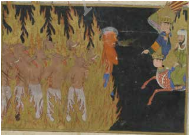
تصویر ۱۹. سیمای دوزخیان. بخشی از تصویر ۴.

کرده است: "دوزخ را هفت در است که اقوال و افعال ناپسند درهای آن هستند، و بهشت را هشت در که افعال و اقوال پسندیده درهای آن بود، مشاعر آدمی نیز هشت است پس حس ظاهر به اضافه خیال و وهم و عقل و هرگاه عقل با این هفت همراه نباشد و این هفت بی فرمان عقل کار کنند، هر هفت درهای دوزخ بوند" (نسفی، ۱۳۴۱: ۲۹۶).