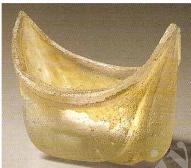
تصویر ۲. کشتی از جنس شیشه، متعلق به قرن ۳ و ۴ ه ق، ارتفاع ۲/۳ س.م، عرض: ۲۰/۷ س.م، محل نگهداری: موزه کویت، مأخذ: Carboni, 2001: 117.