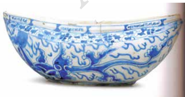
تصویر ۳. کشتی سفالی آبی و سفید، متعلق به عصر صفوی، ارتفاع: ۱۲/۵ س.م، محل نگهداری: مجموعه خصوصی، مأخذ: Canby, 2009: 136.

انتظارات کلی و جزئی مخاطبین (کاربران) از کاسه‌های کشتی شکل، به استناد متون ادب فارسی، با انتظارات مخاطبین از ظروف معمولی و روزمره‌تر همچون، کاسه، کوزه و طبق، تبدیل می‌شود. تا توسط این مقایسه جایگاه زیبایی شناختی کشتی نزد مخاطبین آن، مشخص شود. از آنجا که با مشخص شدن جایگاه زیبایی شناختی این ظرف، در سومین مرحله بازسازی افق انتظار سیر دریافتی غنی دیده می‌شود که موجب به وجود آمدن ظرفی دیگری به نام کشکول شده است، در این مرحله از مبحث زنجیره دریافت یابوس نیز بهره گرفته شد؛ همان‌گونه که ذکر شد، زنجیره دریافت به سیر بسط، گسترش و پرمایه‌تر شدن آثار طی دریافت‌های متوالی گفته می‌شود؛ و می‌توان با بررسی آن به اهمیت تاریخی و جایگاه زیبایی‌شناختی و حتی چگونگی تکامل آثار پی برد. بنابراین در سومین مرحله بازسازی افق انتظار، بنا به ضرورت تحقیق برای شناخت جایگاه زیبایی شناختی کشتی از مبحث زنجیره دریافت بهره گرفته شد.