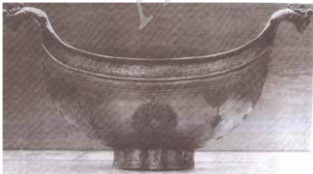
تصویر ۵. کشکول برنجی متعلق به عصر صفوی، ارتفاع: ۷۱ س.م، محل نگهداری: موزه آثار ترک و اسلام، استانبول، مأخذ: ملکیان شیروانی، ۱۳۸۵: ۷۷.

اما السفینه مکانت لمساکین یعلمون فی البحر فاردت ان اعیبه و کان وراءهم ملک یاخذ کل سفینه غصبا (سوره کهف، آیه ۷۹)، (اما آن کشتی از آن خانواده‌ای فقیر بود که از آن ارتزاق می‌کردند من آن کشتی را شکستم، زیرا پادشاه