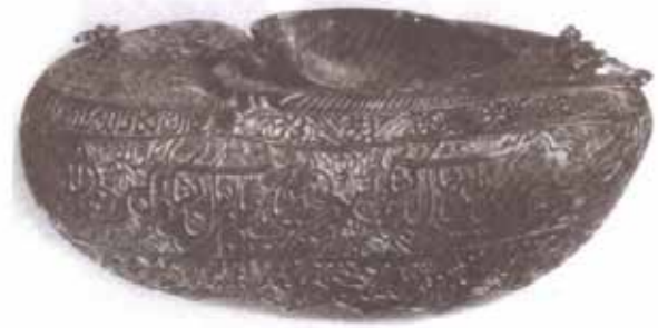
تصویر ۸. کشکول از پوست نارگیل، متعلق به عصر قاجاریه، ارتفاع: ۳۲/۷، محل نگهداری: مجموعه خصوصی ایرانی، مأخذ: ملکیان شیروانی، ۱۳۸۵: ۸۷.

مخاطب مدار هانس روبرت یاوس، روش بازسازی افق انتظار و زنجیره دریافت بهره گرفته شد (تصویر ۹)؛ (جدول ۱). ابتدا با روش بازسازی افق انتظار، روش سه مرحله‌ای که به وسیله آن می‌توان به معیاری که مخاطبین برای ارزش‌گذاری و تفسیر آثار یک عصر به کار می‌برند، پی‌برد؛ افق انتظار کشتی در یک سیر طولانی در اعصار مختلف اسلامی تا پایان عصر قاجاریه به استناد متون ادب فارسی بازسازی شد؛ که نتیجه آن نشان می‌دهد که ویژگی‌های اصلی این ظرف یعنی فرم هلالی یا کشتی شکل آن و تخصیص به باده‌گساری موجبات دریافت‌های خیال‌انگیزی در ادب فارسی خصوصاً در قالب تشبیه و استعاره به هلال ماه و کشتی شده و از آنجا که می‌در متون ادب فارسی خصوصاً ادب عرفانی