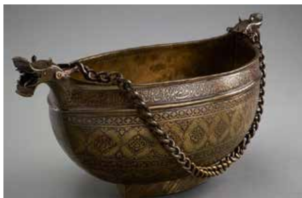
تصویر ۶. کَشکول برنجی متعلق به عصر صفوی، ارتفاع ۶۱ س.م، محل نگهداری: موزه آقاخان، مأخذ: https://www.agakhanmuseum.org/collection/artifact/ beggars-bowl-kashkul بازیابی شده در تاریخ ۹۶/۴/۱۰

او [جام بقا کَشکول است زینت سلطنت ما ار صلت درویشی است [؟] / دستگیر شه و درویش و گدا کَشکول است تاج و تخت ملک جمله جهان شبه شهی است / زانکه زببنده توحید خدا کَشکول است