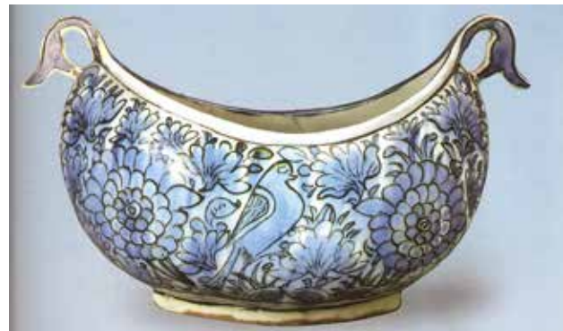
تصویر ۴. کشتی سفالی آبی و سفید، متعلق به قرن ۱۲ ه. ق. ارتفاع: ۱۴ س. م. محل نگهداری: موزه ارمیتاژ، مأخذ: Piotrovsky, 2000: 157.

عمارتنگری این پل کرد (جامی، ۱۳۷۸ ج ۲: ۱۶۸). کشتی باده کشتی نوحست پیش ما / گو سیل غم ببار و جهان گو خراب شو (اهلی شیرازی، ۱۳۴۴: ۳۶۲). از شط غم کشتی می بر کنار آرد مگر / ورنه از تدبیر نتوان بست دریا را پلی (نظیری نیشابوری، ۱۳۴۰: ۳۶۲). دهر اگر بحر پر آشوبست مستان را چه غم / کشتی من بیخطر دایم به ساحل می رود (کلیم کاشانی، ۱۳۳۶: ۱۶۲). اگر سفینه برای نجات بحر غم است / بس است کشتی دریاکشان کدوی شراب (صائب، ۱۳۸۷، ج ۱: ۴۴۹).