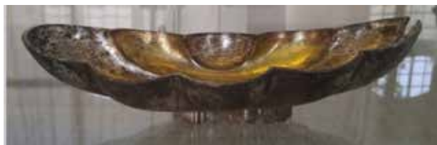
تصویر ۱. کشتی نقره زراندود شده، متعلق به عصر ساسانی، ارتفاع ۵ س.م، محل نگهداری: موزه ملی ایران، مأخذ: آرشیو موزه ملی ایران.