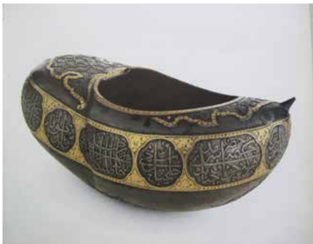
تصویر ۷. کَشکول فولادی طلاکوب، ارتفاع: ۸/۲ س.م عرض: ۲۱/۵ س.م، متعلق به عصر صفوی، محل نگهداری: مجموعه نوهاد، مأخذ: alan jaimes, 1982: 115