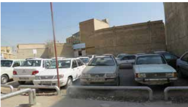
تصویر ۶. فضاهای باز محله جماله که تبدیل به پارکینگ شده است. مأخذ: نگارندگان.