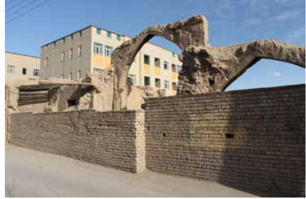
تصویر ۳. خانه‌های نوساز در جوار بافت تاریخی جماله. مأخذ: نگارندگان.