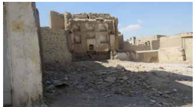
تصویر ۵. خانه‌های قدیمی تخریب شده در محله جماله.

سلسه مراتب است، از بارزترین معضلات امروز بافت محله جماله است.