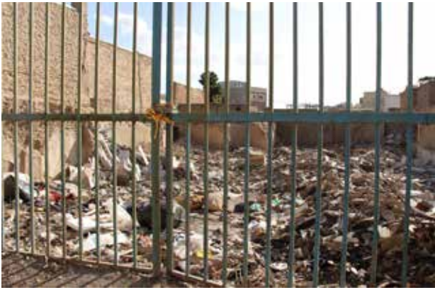
تصویر ۴. خانه‌های متروکه رهاشده در محله جماله.

علی‌رغم آنکه چارچوب نظری بازسازی محله جماله سعی در حفظ ارزش‌ها و بناهای تاریخی علاوه بر اضافه کردن امکانات جدید به محله بود، اما در مرحله اجرا خیابان‌کشی‌های متعدد، سرعتی‌سازی و تخریب خانه‌های نیمه‌ویران بر اثر اصابت موشک و بمب به‌جای بازسازی آنها و مواردی از این قبیل آن‌گونه می‌نمایاند که نظریات معماری مدرن اجرا